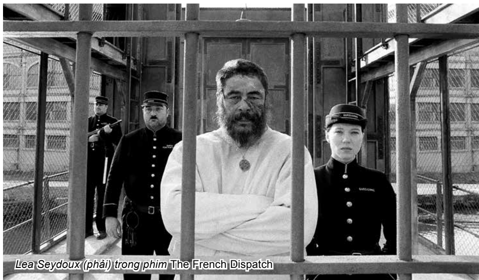
Léa Seydoux (phải) trong phim The French Dispatch

Léa Seydoux xuất thân trong gia đình nổi tiếng ở nước Pháp cả về vị thế xã hội lẫn truyền thống nghệ thuật. Ở Pháp, cô là biểu tượng của nhan sắc và thành công với những giải thưởng danh giá từ khi còn trẻ tuổi. Nhưng với phần còn lại của thế giới, bộ phim đưa cái tên Léa Seydoux nổi danh hẳn nhiên là tác phẩm đồng tính nóng bỏng, gây rất nhiều tranh cãi Blue Is the Warmest Colour (Xanh là màu ấm áp nhất) và sau đó là vai diễn Bondgirl quyến rũ Madeleine Swann trong tập phim Spectre (Tổ chức Spectre). Từ trước đến nay, loạt phim về điệp viên 007 nhiều lần