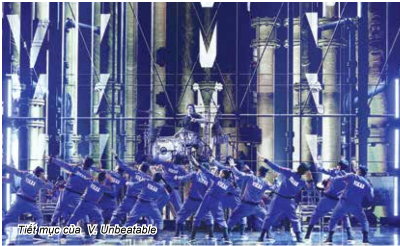
Tiết mục của V. Unbeatable