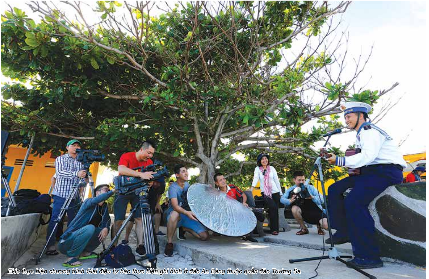
Êkíp thực hiện chương trình Giải điệu tự hào thực hiện ghi hình ở đảo An Bàng thuộc quần đảo Trường Sa

CÙNG THAM GIA SẢN XUẤT VỚI CÁC NHÀ BÁO, BTV KÌ CỰU TẠI BAN SẢN XUẤT CÁC CHƯƠNG TRÌNH GIẢI TRÍ, NHIỀU CƠ HỘI QUÝ BÁU ĐÃ VÀ ĐANG ĐƯỢC GIAO CHO CÁC BẠN TRẺ THUỘC ĐỘ TUỔI 9X. CÓ THỂ NÓI, ĐÂY LÀ MỘT QUYẾT ĐỊNH TÁO BẠO CỦA LÃNH ĐẠO BAN VÀ CŨNG LÀ NIỀM VINH DỰ, MAY MẮN CỦA CÁC PV, BTV TRẺ.