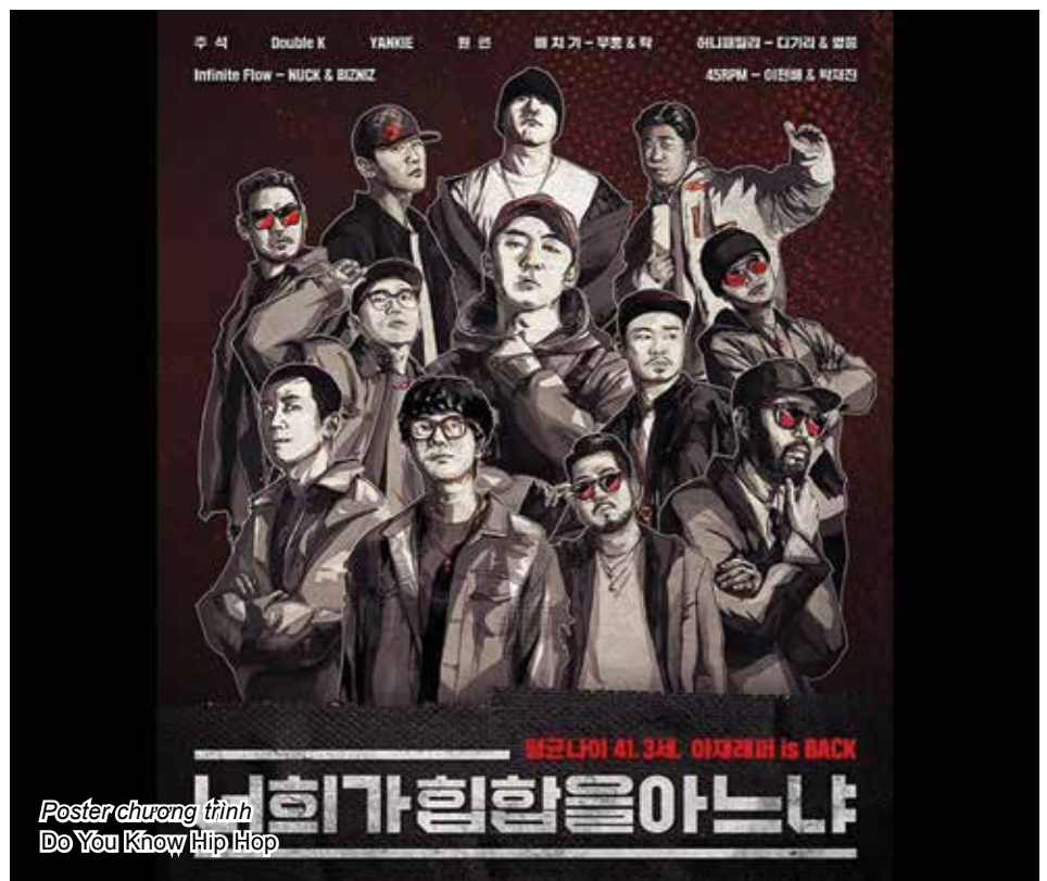
Poster chương trình Do You Know Hip Hop