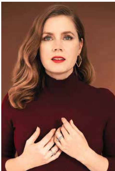
Amy Adams đóng vai chính trong phim Hillbilly Elegy