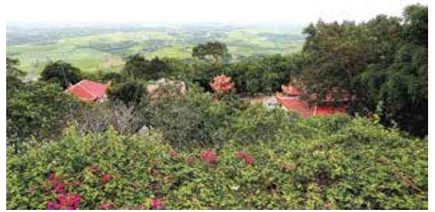
Chùa Bà Đen nằm ở độ cao 350m

như cảm nhận về thiên nhiên, núi Bà Đen còn là địa điểm du lịch tâm linh nổi tiếng tại miền Nam. Khám phá núi Bà Đen, du khách có thể ghé qua quần thể chùa tại đây. Có rất nhiều ngôi chùa lớn nhỏ như: chùa Thượng, chùa Hạ, chùa Trung, chùa Hang... mỗi chùa mang một kiểu kiến trúc và có những câu chuyện riêng.