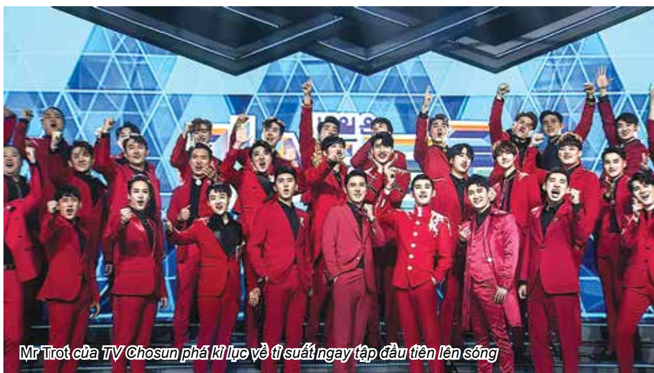
Mr Trot của TV Chosun phá kỉ lục về tỉ suất ngay tập đầu tiên lên sóng

những người đã đưa hip hop trở nên phổ biến ở Hàn Quốc vào cuối những năm 1990 và đầu năm 2000. Mnet đã sản xuất rất nhiều chương trình liên quan đến hip hop như: Show Me The Money (Đừng để tiền rơi), Unpretty Rapstar (Tìm kiếm rapper nữ), High School Rapper (Rapper trường học)... nhưng Do You Know Hip Hop là một chương trình hoài cổ “sẽ giúp khán giả nhớ lại những kỉ niệm xưa và nhận ra những giá trị đáng trân trọng của hip hop. Nó không đơn thuần chỉ là xu hướng”, nhà sản xuất Hwang Sung Ho nhấn mạnh. Mnet tham vọng sẽ làm hồi