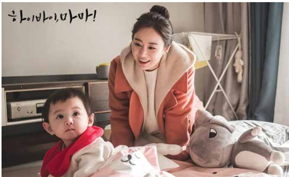
Kim Tae Hee có màn tái xuất ấn tượng trong Hi, Bye Mama