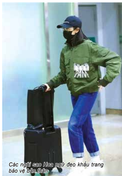
Các ngôi sao Hoa ngữ đeo khẩu trang bảo vệ bản thân

T rong bối cảnh tình hình dịch bệnh viêm đường hô hấp cấp Covid 19 ngày càng lan rộng, theo tiếng gọi của Đảng Cộng sản Trung Quốc, hàng nghìn cán bộ đảng viên đã bất chấp nguy hiểm, sẵn sàng gạt bỏ hạnh phúc riêng tư, tình nguyện dấn thân vào vùng tâm dịch để chung tay chống chọi với bệnh dịch. Ở một mặt trận khác, các nhà đài cũng hợp sức tuyên