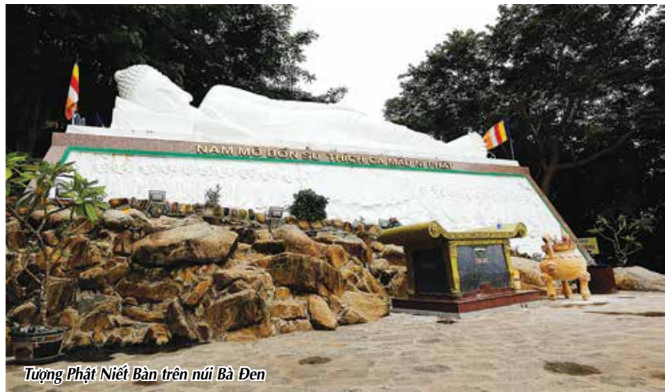
Tượng Phật Niết Bàn trên núi Bà Đen

ĐƯỢC BIẾT ĐẾN LÀ MỘT VÙNG ĐẤT GIÀU TRUYỀN THỐNG YÊU NƯỚC, TÂY NINH CÒN CÓ TIỀM NĂNG PHÁT TRIỂN KINH TẾ TO LỚN VỚI NHỮNG THỂ MẠNH NHƯ DU LỊCH, NÔNG NGHIỆP, CÔNG NGHIỆP CHẾ BIẾN... MẢNH ĐẤT NÀY VỪA MANG ĐẶC ĐIỂM CỦA CAO NGUYÊN, VỪA CÓ SẮC THÁI CỦA VÙNG ĐỒNG BẰNG, SỞ HỮU NHỮNG THẮNG CẢNH THIÊN NHIÊN NỔI TIẾNG, SỰ ĐA DẠNG VĂN HÓA CỦA 21 DÂN TỘC, NHỮNG CÔNG TRÌNH KIẾN TRÚC TÂM LINH ĐỘC ĐÁO VÀ BỀ DÀY LỊCH SỬ ĐÁNG TỰ HÀO.