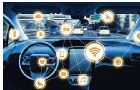
Công nghệ giọng nói giúp đỡ tích cực cho các lái xe trong việc đọc và nghe thông tin

Các phiên bản ứng dụng công nghệ nói trong báo chí sẽ góp phần giúp gia tăng trải nghiệm cho người đọc, mang đến hình thức tiếp nhận tin tức hoàn toàn mới mẻ.