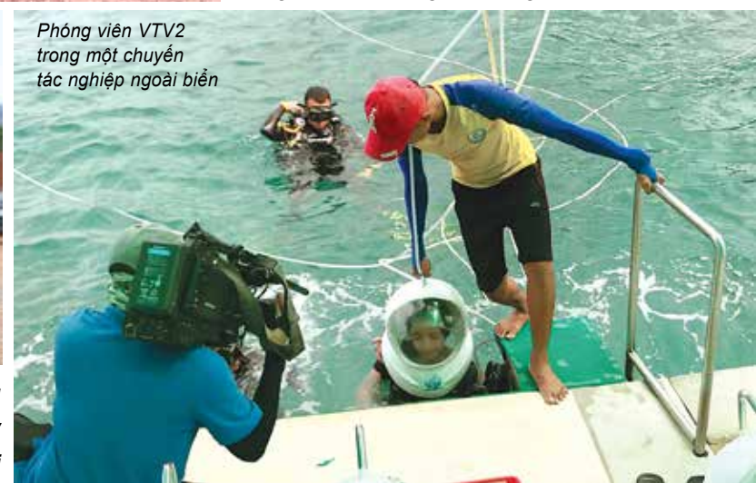
Phóng viên VTV2 trong một chuyến tác nghiệp ngoài biển

Kênh Youtube trước mắt sẽ phục vụ cho việc lưu trữ các chương trình của VTV2 để khán giả có thể tiếp cận một cách chủ động. Đối tượng vẫn là những ai xem Youtube và quan tâm tới nội dung của VTV. Ngoài ra, trong tương lai, chúng tôi cũng đang lên kế hoạch để sản xuất nội dung chuyên biệt trên Youtube, còn nó là gì thì mọi người hãy đăng kí cho kênh Youtube VTV Chất lượng cuộc sống nhé.