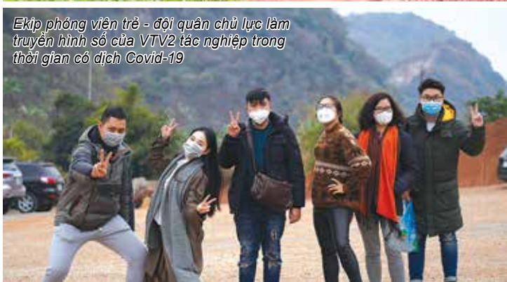
Ekip phóng viên trẻ - đội quân chủ lực làm truyền hình số của VTV2 tác nghiệp trong thời gian có dịch Covid-19