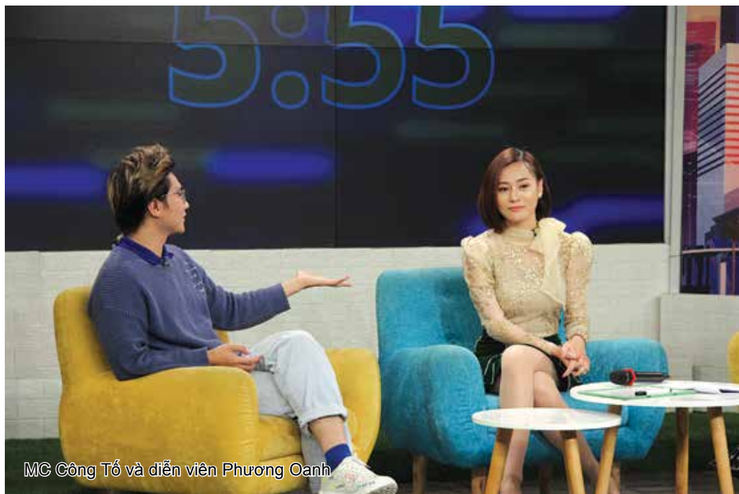
MC Công Tố và diễn viên Phương Oanh

Trong khi đó, với format Bữa trưa vui về phát sóng vào thứ Ba, thứ Năm và thứ Bảy, khán giả sẽ được trò chuyện và tương tác cùng thần tượng, gửi những lời nhắn