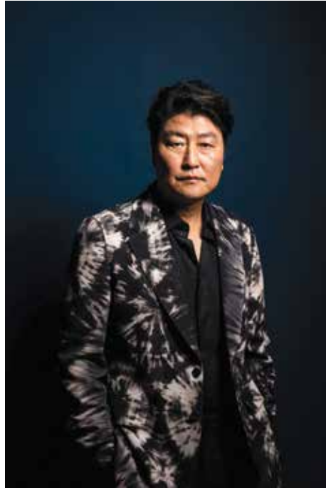
Song Kang Ho người được mệnh danh là Bảo chứng phòng vé Hàn