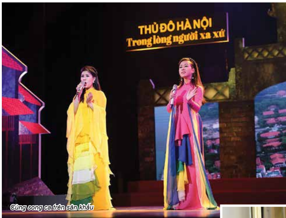
Cùng song ca trên sân khấu