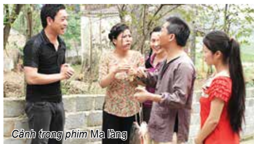
Cảnh trong phim Ma làng

- Đài Truyền hình Việt Nam), phim chính luận luôn được xem là dòng phim “khó, khô và khổ” nên ngay từ khi quyết định thực hiện dự án Sinh tử , đoàn làm phim đã gặp thách thức. Đó là những thách thức từ nội dung kịch bản, thách thức với các đạo diễn cho đến thách thức với