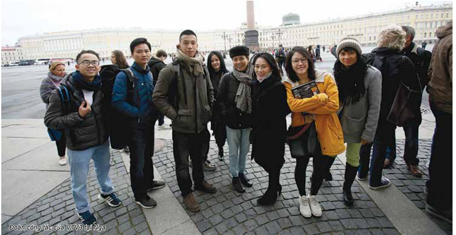
Đoàn công tác của VTV3 tại Nga