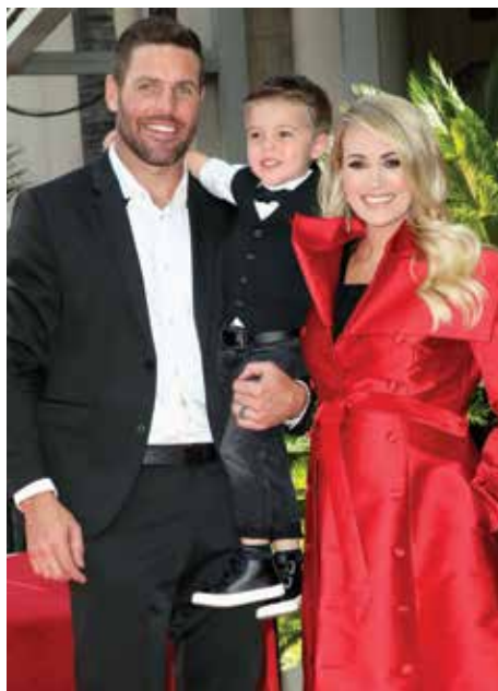
Gia đình hạnh phúc của Carrie Underwood

Đằng sau vẻ hào nhoáng, quyến rũ của một ngôi sao ca nhạc đồng quê, Carrie Underwood còn là một “prepper” đích thực. “Prepper” là cụm từ ám chỉ một cộng đồng người ở Mỹ luôn đưa ra những kế hoạch đối phó với những thời điểm xấu nhất như khủng hoảng kinh tế, chính trị, biến đổi khí hậu, khủng bố, thảm họa, cúp điện kéo dài... Trên thực tế, cô là một fan cứng của bộ phim The Walking Dead (Xác sống) nhiều năm nay. Có lẽ đó cũng chính là lí do cô luôn bị ám ảnh bởi một thế giới có sự hiện diện của Zombie. Năm 2017, khi trở thành khách mời của chương trình truyền hình Today , Carrie đã không ngần ngại thể hiện tình yêu với bộ phim The Walking Dead bằng việc sẵn sàng ngồi