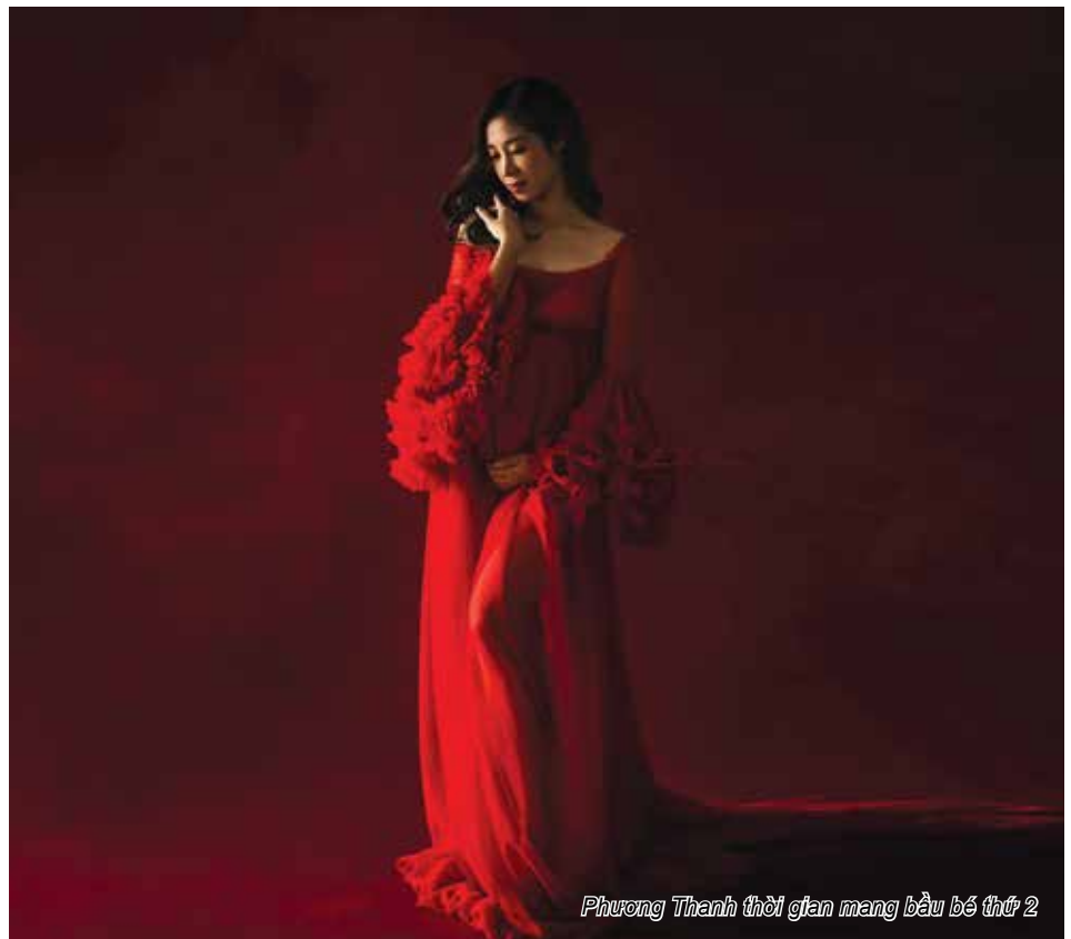
Phương Thanh thời gian mang bầu bé thứ 2