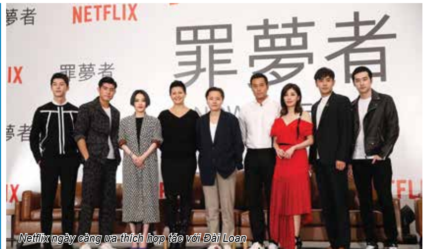
Netflix ngày càng ưa thích hợp tác với Đài Loan