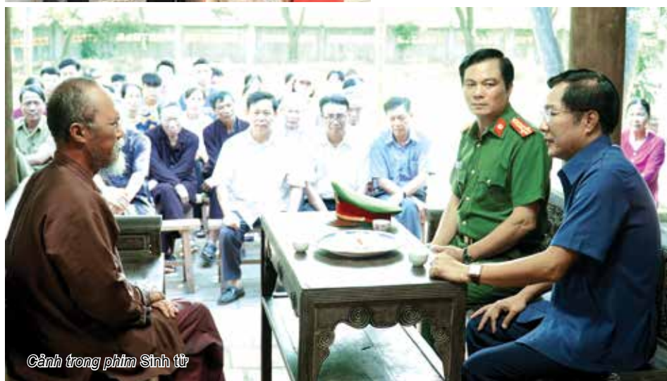
Cảnh trong phim Sinh tử

chính dàn diễn viên, đặc biệt là lời thoại của từng nhân vật. Đạo diễn NSND Khải Hưng và NSUT Mai Hiền đã mất 3 năm để theo đuổi dự án này.