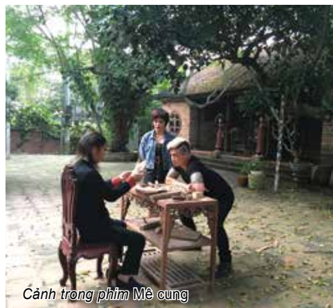
Cảnh trong phim Mê cung

vẫn được cho là khô khan, khó xem nên dễ tăng sự hấp dẫn, các phim chính luận đã cài vào chuyện gia đình, tình yêu đôi lứa như những lát cắt nhẹ nhàng, gần gũi với đời thường. Đặc biệt, nội dung phim luôn truyền tải sâu sắc những thông điệp nhân văn, chạm đến trái tim và tình cảm người xem. Để có được các tác phẩm chính luận chất lượng tốt, trên thực tế các nhà làm phim đã và đang gặp không ít khó khăn. Sau kịch bản thì phim chính luận còn gặp