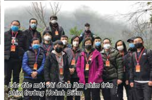
Lắc đầu một vài đoàn làm phim trên phim trường Hoàn Kiếm