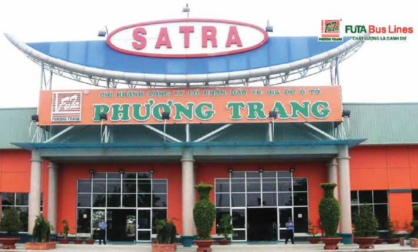
Hình ảnh Trạm dừng Satra - Thủ Đức