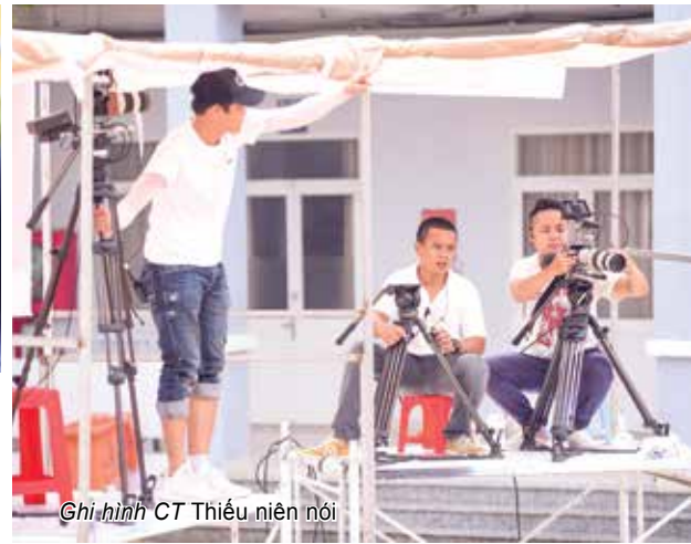
Ghi hình CT Thiếu niên nói

Được sự vào cuộc và hỗ trợ nhiệt tình từ Bộ Giáo dục – Đào tạo cũng như các trường học, các gia đình... Thiếu niên nói đã tạo nên một điểm hẹn sinh hoạt rất sôi nổi, hào hứng ở mỗi nơi ekip ghé tới. Nhưng đằng sau những khuôn hình ngập tràn cảm xúc, hứng khởi ấy là khoảng thời gian dài ghi hình rất vất vả và khi dưới nắng nóng, khi hổi hả xử lí sự cố từ các cơn mưa. Không đi theo format cố định mà xâu chuỗi rất nhiều mẩu chuyện nhỏ nên việc chọn lọc, làm hậu kì cho Thiếu niên nói ngắn gọn thời gian hơn hẳn một số chương trình giải trí khác. Để giúp học sinh có đủ sự tự tin, thoải mái nói ra tâm tư của mình, đội ngũ làm chương trình nhiều lần phải dành tới 2 -3 tiếng trao đổi, “làm công tác tư tưởng” với các em, bỏ