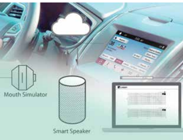
Loa thông minh - một thiết bị ngoại vi hỗ trợ người lái xe tiếp cận thông tin bằng âm thanh

công nghệ hiểu văn bản và ngôn ngữ tự nhiên để tạo ra âm thanh tổng hợp hoàn chỉnh với nhịp điệu và ngữ điệu phù hợp.