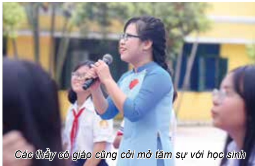
Các thầy cô giáo cũng cởi mở tâm sự với học sinh

chặng đường nhiều dấu ấn với sự vào cuộc hào hứng, đầy “dũng khí” đến từ cả học sinh, gia đình, thầy cô và nhà trường. Sự xuất hiện của thầy hiệu trưởng trường THPT Hùng Vương trong tập 3 chương trình là minh chứng cho lần sóng thay đổi đó. Học sinh trực tiếp đồng dạng nói lên tâm tư của mình với người đứng đầu nhà trường vì các em cảm nhận được rằng thầy hiệu trưởng chính là người mong muốn biến những năm tháng ngồi trên ghế nhà trường của các em thành kỉ niệm đẹp để bằng việc tạo nên những hoạt động ngoại khóa đột phá để gắn kết. Theo thầy Hiệu trưởng trường THPT Hùng Vương, giáo dục trong thời kì mới cần sự thấu hiểu, chia sẻ, ở đó quan hệ thầy cô – học sinh cần phải xóa bỏ một số ranh giới cố hữu để tạo sự gắn bó như những người trong gia đình.