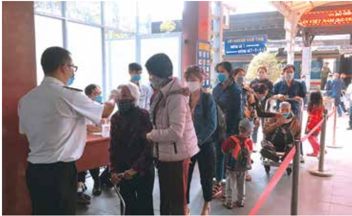
Đo thân nhiệt hành khách trước khi lên tàu