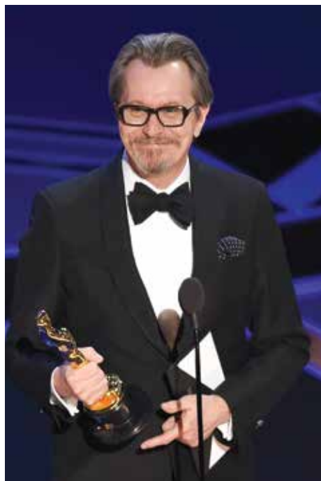
Nam diễn viên từng đoạt giải Oscar - Gary Oldman - đóng phim tiểu sử Mank