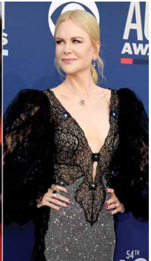
Meryl Streep hợp tác cùng Nicole Kidman trong bộ phim The Prom