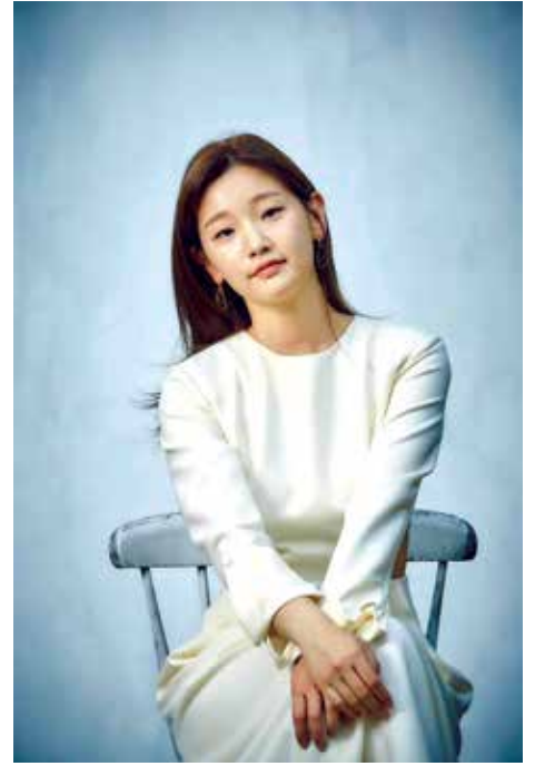
Park So Dam sở hữu gương mặt đậm chất điện ảnh và diễn xuất thực lực

VỚI 4 TƯỢNG VÀNG OSCAR VÀ DOANH THU PHÒNG VÉ CÁN MỐC 200 TRIỆU USD TRÊN TOÀN CẦU, PARASITE (KÍ SINH TRÙNG) ĐÃ ĐƯA TÊN TUỔI CỦA DÀN DIỄN VIÊN VƯƠN TẦM THẾ GIỚI. NẾU NHƯ ĐẠO DIỄN BONG JOON HO ĐÃ BẮT TAY VÀO NHỮNG DỰ ÁN MỚI NGAY SAU KHI LỄ TRAO GIẢI KẾT THÚC THÌ NHỮNG NGƯỜI CÙNG ÔNG TẠO NÊN CHIẾN THẮNG LỊCH SỬ NÀY SẼ LÀM GÌ ĐỂ DUY TRÌ TÊN TUỔI CỦA MÌNH? ĐÂY LÀ CÂU HỎI ĐƯỢC RẤT NHIỀU NGƯỜI HÂM MỘ QUAN TÂM.