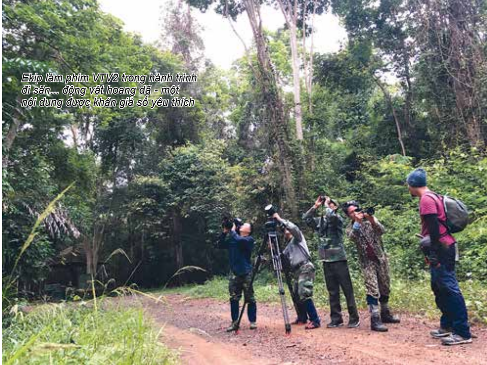
Ekip làm phim VTV2 trong hành trình đi săn... động vật hoang dã - một nội dung được khán giả số yêu thích