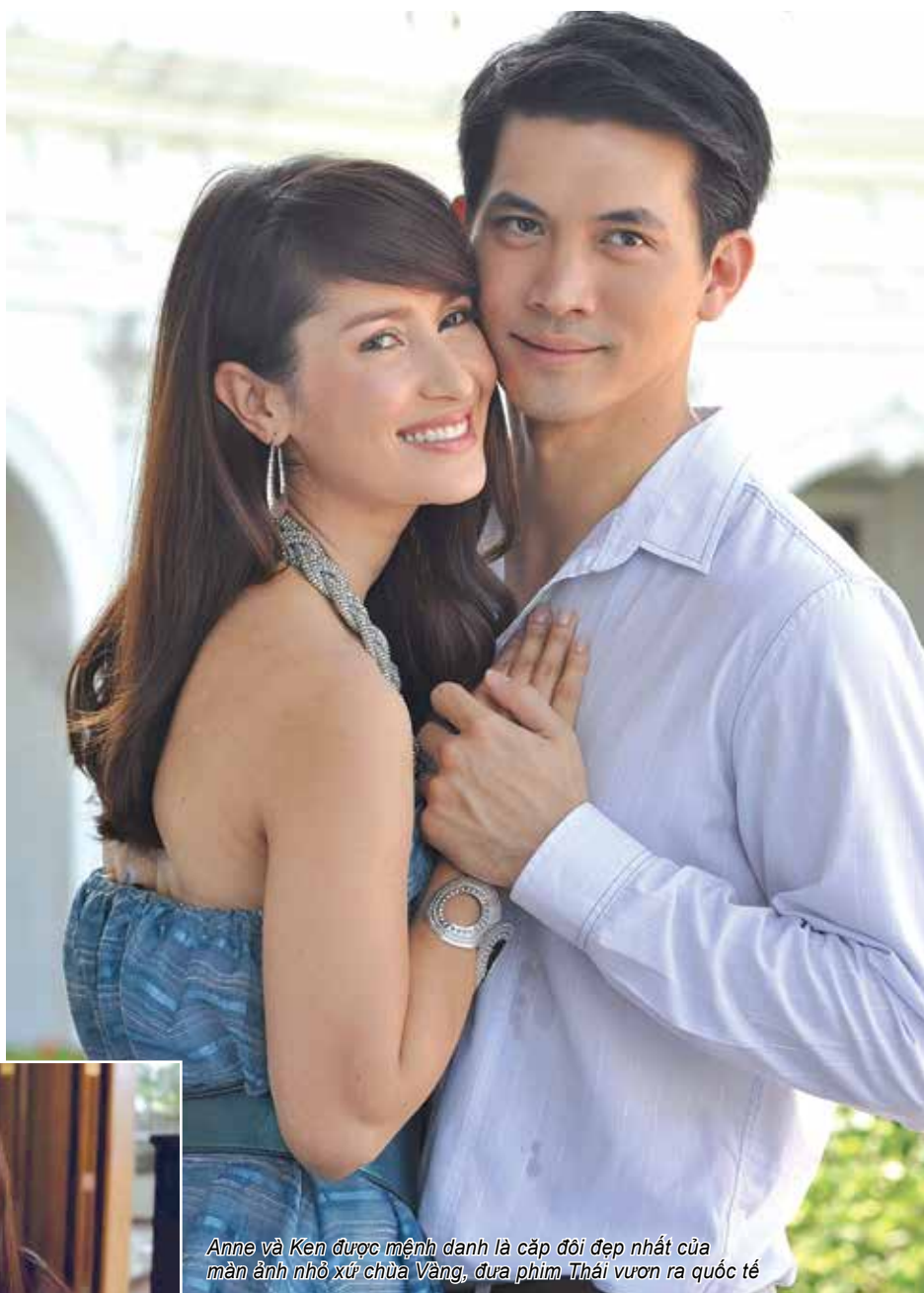
Anne và Ken được mệnh danh là cặp đôi đẹp nhất của màn ảnh nhỏ xứ chùa Vàng, đưa phim Thái vươn ra quốc tế

30 năm trong nghề, Anne Thongprasom sở hữu gần 80 giải thưởng ở tất cả các lĩnh vực. Cô đã vinh dự được công chúa Maha Chakri Sirindhorn trao tặng giải