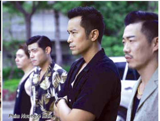
Phim Nowhere man

Đài Loan là một trong ba nền điện ảnh nói tiếng Hoa lớn nhất, bên cạnh Trung Quốc đại lục và Hồng Kông. Tuy nhiên, khán giả châu Á nói chung và khán giả Việt Nam nói riêng vẫn bị ấn tượng bởi những bộ phim điểm tình xưa kia hay hàng loạt những tác phẩm truyền hình thần tượng của vùng lãnh thổ này mà quên rằng Đài Loan có một nền điện ảnh tồn tại độc lập với ngành thương mại giải trí phục vụ số đông khán giả trẻ, một nền điện ảnh của những cách tân táo bạo biến nơi đây dần trở thành một giới cửa dòng điện ảnh tác giả. Và bây giờ, khi Đài Loan đang là đích đến của nhiều nhà đầu tư điện ảnh nước ngoài, nền điện ảnh tại đây được dự đoán sẽ còn có cơ hội bứt phá và phát triển hơn thời điểm hiện tại rất nhiều.