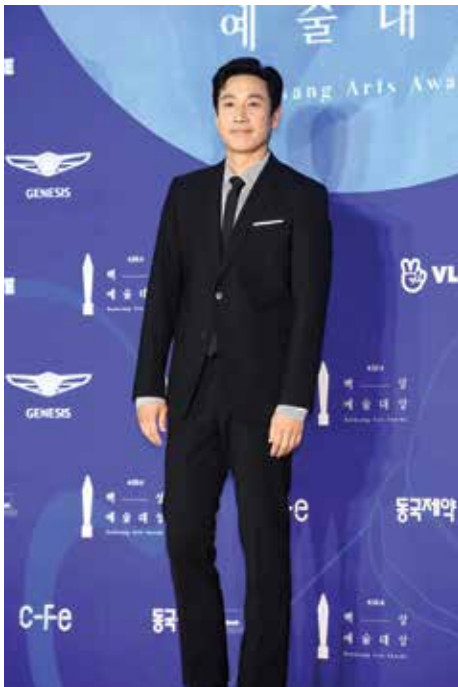
Lee Sun Kyun ngôi sao của các bom tấn

Lịch trình của Choi Woo Sik, nam diễn viên thủ vai Ki Woo trong Parasite cũng đã kín đặc đến cuối năm. Điều đó không có gì lạ với một chàng trai chỉ mới ngấp nghé 30 tuổi nhưng đã có đến 3 lần sải bước trên thảm đỏ LHP Cannes với 3 tác phẩm đình đám: Train to Busan (Chuyến tàu tới Busan), Okja (Siêu lợn), Parasite . Chiến thắng lịch sử tại Oscar một lần nữa giúp Choi Woo Sik trở thành ngôi sao trẻ đắt giá của màn ảnh Hàn. Dự án mới nhất của Choi Woo Sik là Time to Hunt (Đến giờ đi săn) bộ phim kinh dị do đạo diễn Yoo Sung Hyun cầm trịch. Phim xoay quanh một nhóm bạn thân bốn người cùng nhau lập nên một kế hoạch nguy hiểm để tìm kiếm cuộc sống tốt đẹp hơn. Tuy nhiên, họ đã bị truy đuổi bởi một vật thể kì bí. Time to Hunt đã có màn ra mắt ấn tượng tại LHP Berlin vào ngày 1/3 vừa qua và hiện vẫn chưa có thời gian phát hành chính thức vì ảnh hưởng của đại dịch Covid -19. Hiện tại, nam diễn viên sinh năm 1990 này đang bận rộn trên trường quay của The Policeman's Lineage (Gia tộc cảnh sát) -