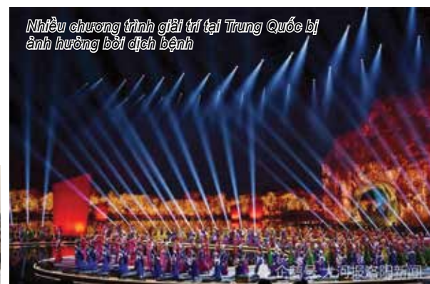
Nhiều chương trình giải trí tại Trung Quốc bị ảnh hưởng bởi dịch bệnh

Years , là một nhân chứng từng trải qua giai đoạn Trung Quốc bùng phát dịch SARS 17 năm về trước cho biết, anh đã cảnh báo hiểm họa về bệnh nhiễm đường hô hấp cấp do một loại virus lạ từ tháng 1 và có những biện pháp thích hợp để nhắc nhở các thành viên trong đoàn làm phim của mình.