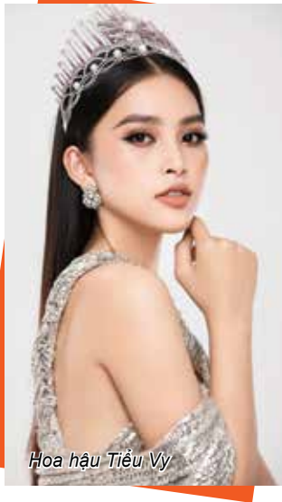
Hoa hậu Tiểu Vy

Miss World 2018 mà còn mang đến cuộc sống chất lượng cao hơn cho người dân Bản Nju ở vùng sâu, xa rất khó khăn của tỉnh Quảng Bình. Những việc làm ý nghĩa