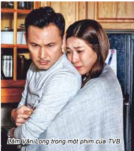
Lâm Văn Long trong một phim của TVB

Lâm Văn Long là một trong những ngôi sao màn ảnh nhỏ trong thập niên 1990. Nghệ sĩ sinh năm 1967 này khởi nghiệp khá muộn, khi đã 20 tuổi mới tham gia cuộc thi tuyển chọn diễn viên của Đài TVB. Năm 1990, anh bắt đầu được biết đến với vai phản diện trong phim Người nơi biên giới . Sau đó, anh có nhiều vai diễn đa dạng trong các thể loại phim khác nhau