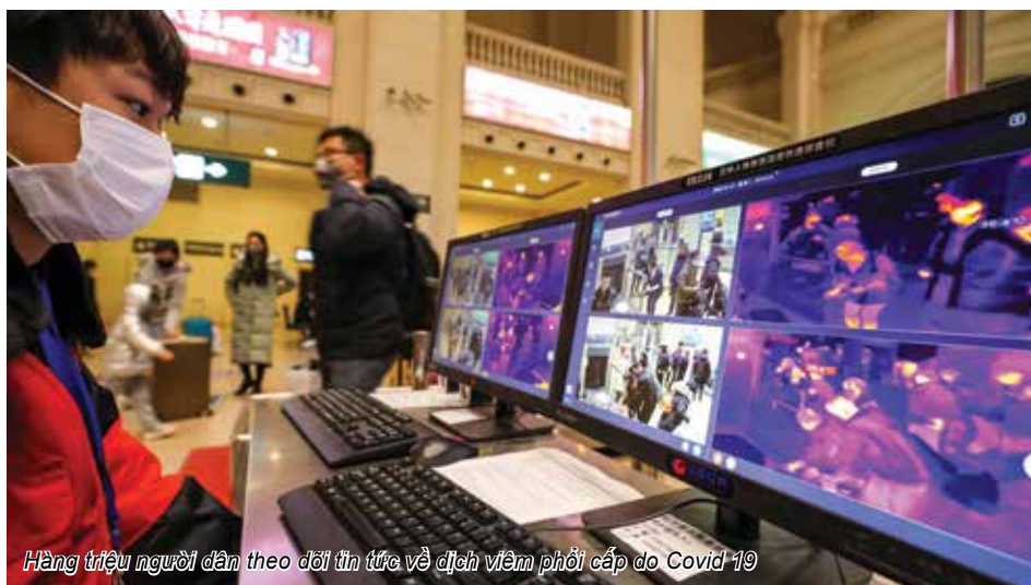
Hàng triệu người dân theo dõi tin tức về dịch viêm phổi cấp do Covid 19

bản tin truyền hình được trực tiếp nhiều giờ liền, cung cấp đầy đủ mọi thông tin về dịch corona lên sóng. 36 đài truyền hình vệ tinh quốc gia phải phát sóng tiết mục, chương trình hướng dẫn phòng chống dịch bệnh 24/24h. Một số đài chuyên sản xuất các chương trình giải trí như Đài Hồ Nam và Chiết Giang đều hủy phát sóng và lịch ghi hình toàn bộ các chương trình thực tế ăn khách như: Khoái lạc đại bản doanh , Vương bài đối vương bài , Lãng du kí ... Nhiều bản tin với tiêu đề cổ động với nội dung: “Ý chí của người dân tựa tường thành, ngăn chặn và đẩy lùi virus corona” cũng được một loạt các đài truyền hình như Chiết Giang, Sơn Đông, Hồ Nam, An Huy... sản xuất.