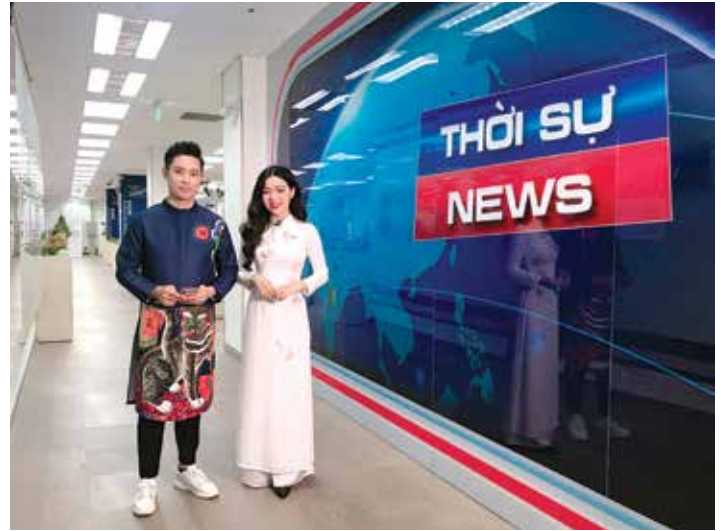
Với MC Thanh Tùng

VTV Kết nối là chương trình truyền hình chuyên biệt, hé lộ cho khán giả những công việc hậu trường ở VTV, giúp khán giả tìm hiểu sâu hơn về công việc phía sau những hình ảnh mà khán giả thường thấy trên sóng truyền hình hay giới thiệu những món ăn mới và đặc sắc nhất trên sóng THVN... Chương trình thực sự gần gũi, có tính tương tác cao với khán giả. Và, đúng là gắn bó với chương trình lâu rồi nhưng mỗi khi lên hình mình luôn có cảm giác háo hức. Không biết hôm nay sẽ giới thiệu về chương trình gì? Câu chuyện hậu trường sẽ có những gì thú vị đây? Thật thích thú khi mình lại được là người truyền tải những thông tin hậu trường vốn ít người biết đến khán giả truyền hình.