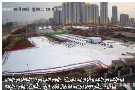
Hàng triệu người dân theo dõi thi công bệnh viện dã chiến tại Vũ Hân qua truyền hình

Kể từ khi dịch viêm phổi do corona virus bùng phát và diễn biến phức tạp, với số ca nhiễm lẫn ca tử vong không ngừng tăng từng ngày, giới chức Trung Quốc đã phong tỏa 16 thành phố nhằm giảm thiểu nguy cơ lây lan. Đường phố và các địa điểm du lịch đều vắng bóng người. Nhiều ngành công nghiệp đình trệ, trong đó ngành sản xuất phim truyền hình cũng bị ảnh hưởng nặng nề do phim trường Hoàn Kiếm đóng cửa. Bắt đầu từ ngày 9/2, một số đoàn phim truyền hình mới rậm rịch trở lại làm việc. Tại trường quay Hoàn Kiếm, phim trường lớn nhất thế giới tại tỉnh Triết Giang đã dán thông báo hướng dẫn các đoàn làm phim phải giữ vệ sinh, an toàn và trật tự trong quá trình tác nghiệp giữa những ngày tâm điểm của đại dịch Covid 19. Trước đó, phim trường Hoàn Kiếm