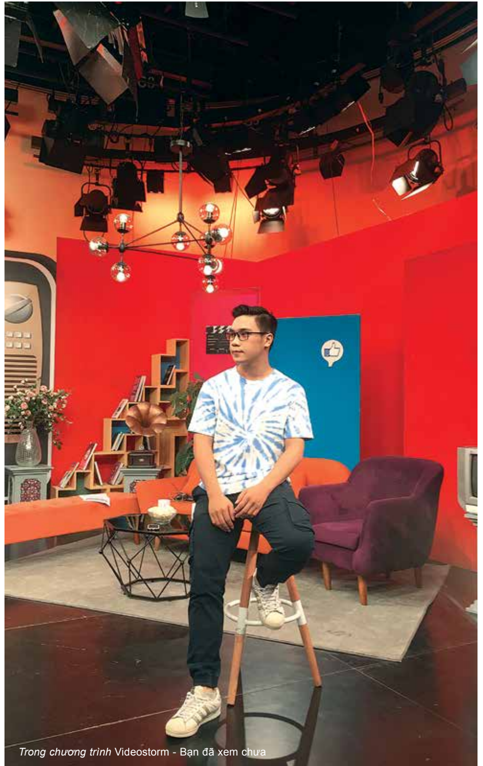
Trong chương trình Videostorm - Bạn đã xem chưa