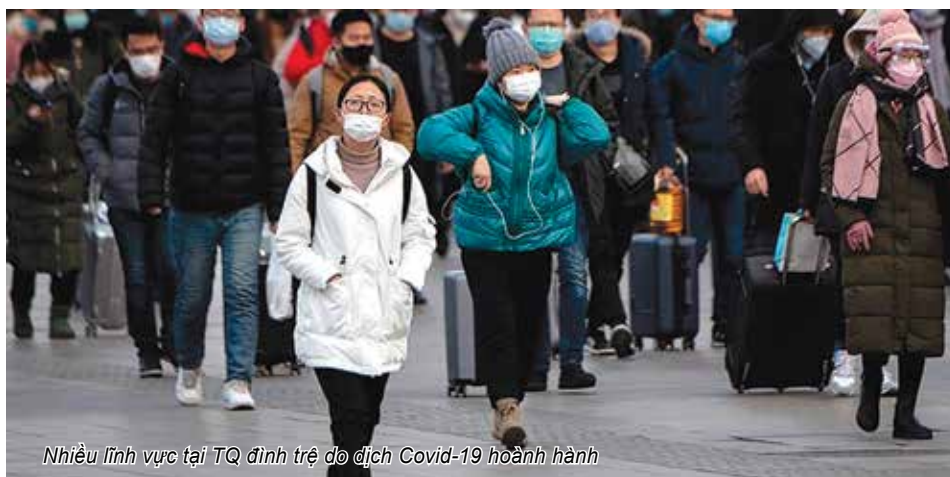
Nhiều lĩnh vực tại TQ đình trệ do dịch Covid-19 hoành hành

Qua khảo sát chung cho thấy, tỉ lệ người theo dõi các chương trình truyền hình cảnh báo và cập nhật tình hình