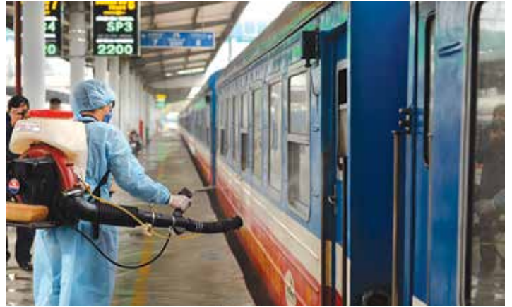
Khử trùng tàu bằng thiết bị y tế chuyên dụng

T hực hiện các văn bản chỉ đạo của Chính phủ, Bộ Y tế, các cơ quan lý Nhà nước về phòng chống dịch bệnh viêm đường hô hấp cấp do chủng virus 2019-nCoV, Đường sắt Việt Nam đã thực hiện tốt nhiều biện pháp để phòng chống, ngăn ngừa sự lây lan của dịch bệnh viêm đường hô hấp cấp do chủng virut corona.