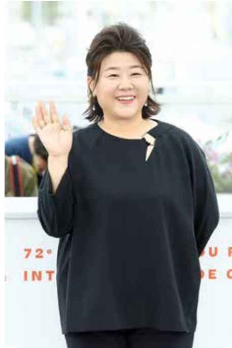
Lee Jung Eun nữ diễn viên cực kì đắt show của điện ảnh Hàn

bộ phim được chuyển thể từ tiểu thuyết hình sự trinh thám nổi tiếng của nhà văn Nhật Bản, Joh Sasaki. Nội dung kể về chàng sĩ quan cảnh sát trẻ tuổi xuất thân con nhà nòi. Một lần tình cờ nghe bố và ông nội – vốn cũng là cảnh sát cấp cao nói chuyện, anh phát hiện ra nguyên nhân vì sao gia đình mình bắt đầu dĩ phải lựa