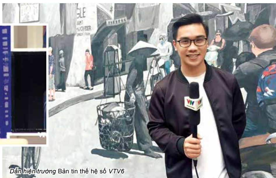
Dẫn hiện trường Bản tin thể hệ số VTV6