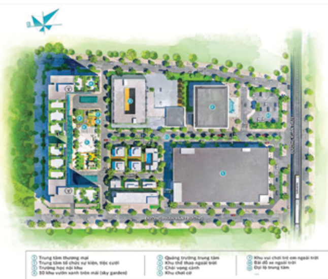
Mặt bằng Dự án Mipec Rubik 360.

Mọi chi tiết xin liên hệ: Công ty CP Thương mại và Dịch vụ Xuân Thủy Hotline đơn vị bán hàng: 18006350