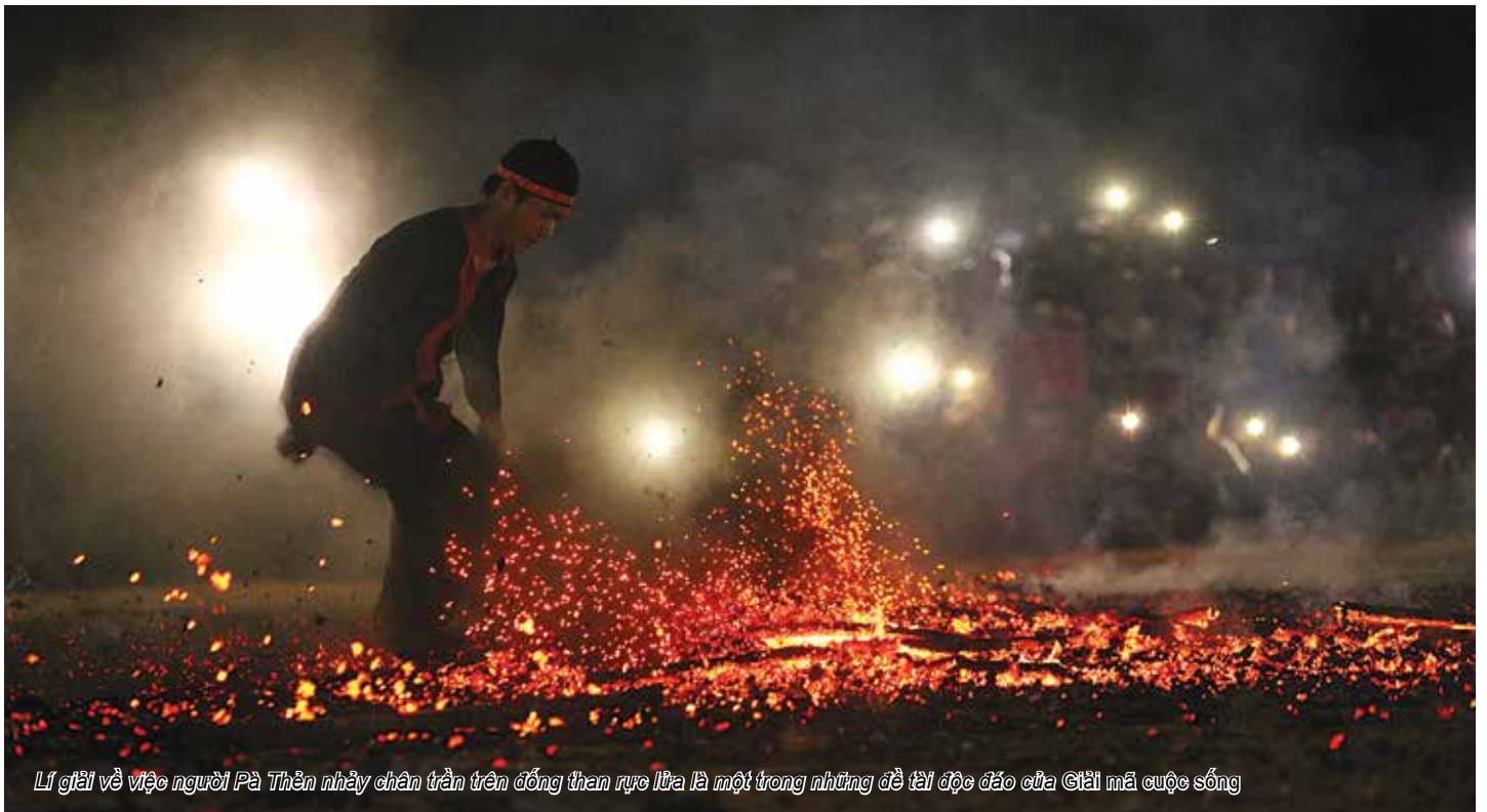
Lí giải về việc người Pà Thên nhảy chân trần trên đồng than rực lửa là một trong những đề tài độc đáo của Giải mã cuộc sống