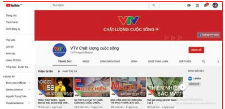
Trang YouTube VTV chất lượng cuộc sống

◆ Xin bạn cho biết, con số hơn 1 triệu người theo dõi fanpage VTV2 Chất lượng cuộc sống đã đạt được từ bao giờ?