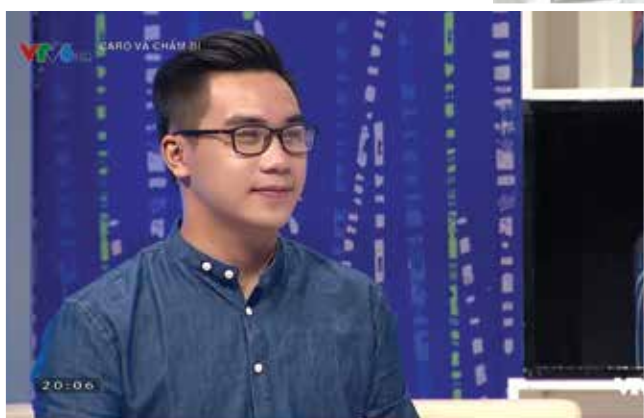
Trong chương trình Caro và Chấm bi