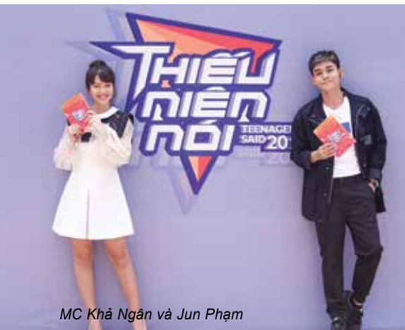
MC Khả Ngân và Jun Phạm

Thiếu niên nói hướng tới học sinh thuộc cả ba cấp học: tiểu học, trung học cơ sở, trung học phổ thông. Với biên độ tuổi rộng như vậy, khá dễ để khán giả nhận ra sự khác biệt về tính tình, cách thể hiện của các nhân vật. Trong khi học sinh THPT có xu hướng giải bày, tâm sự nhiều với bạn bè,