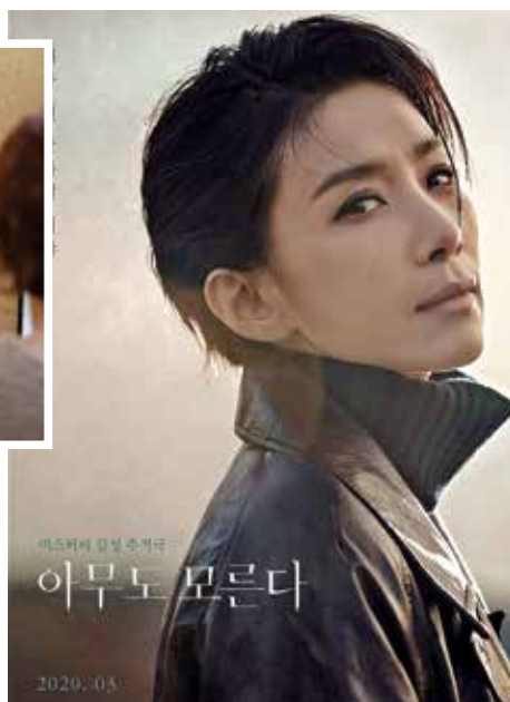
Nữ diễn viên chuyên trị vai ác Kim Seo Hyung sẽ có màn lột xác trong Nobody Knows

Sau thành công vang dội của Crash Landing On You (Hạ cánh nơi anh), Đài TvN vừa cho ra mắt bộ phim Hi Bye, Mama (người mẹ ma) đánh dấu sự trở lại của nữ diễn viên Kim Tae Hee sau 5 năm vắng bóng. Phim kể về một người mẹ đã qua đời vì một tai nạn thương tâm, được phép quay lại với chồng con sau 49 ngày. Kim Tae Hee vào vai Cha Yu Ri, một người mẹ không thể siêu thoát vì mong muốn được một lần ôm con vào lòng. Mặc dù đã làm ma 5 năm, Cha Yu Ri vẫn duy trì được tính cách vui tươi, lạc quan. Nhan sắc trẻ trung, diễn xuất đầy tiến bộ của nữ nhân 39 tuổi nhận được rất nhiều lời khen ngợi của khán giả. Tuy nhiên, không thể