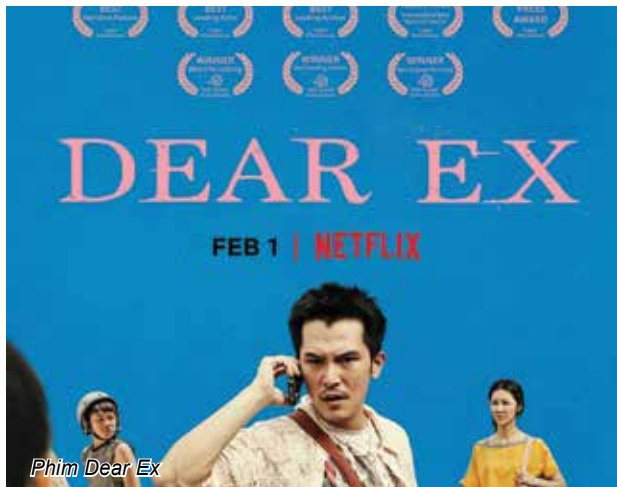
Phim Dear Ex