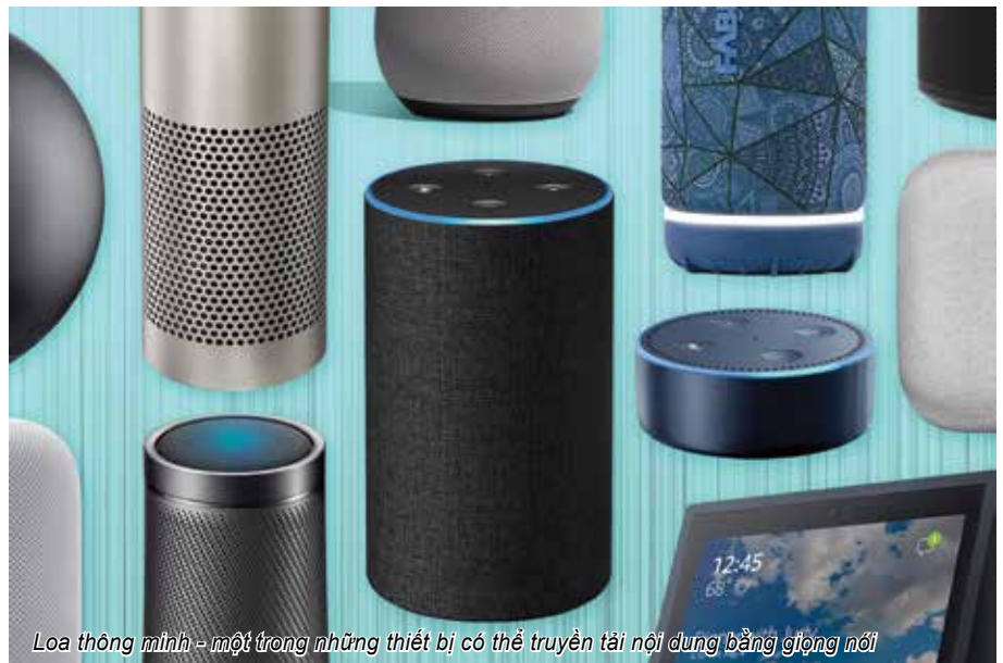
Loa thông minh - một trong những thiết bị có thể truyền tải nội dung bằng giọng nói

Một trong những giải pháp báo chí tiềm năng giúp việc đọc báo điện tử một cách tự động, đồng thời hứa hẹn mở ra nhiều ứng dụng hữu ích khác trong truyền thông chính là công nghệ chuyển đổi văn bản thành giọng nói tiếng Việt có cảm xúc trên nền tảng trí tuệ nhân tạo (AI) TTS (Text to Speech), hiện đang bắt đầu ứng dụng rộng rãi tại Việt Nam, đã được phát triển bởi nhà mạng Mobifone. Đây là