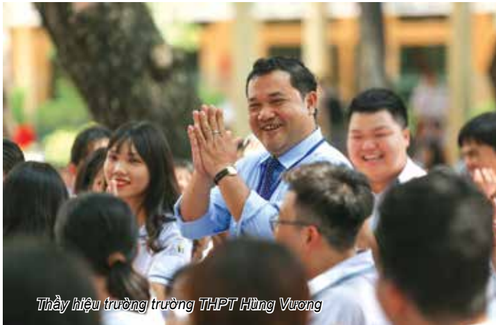
Thầy hiệu trưởng trường THPT Hùng Vương