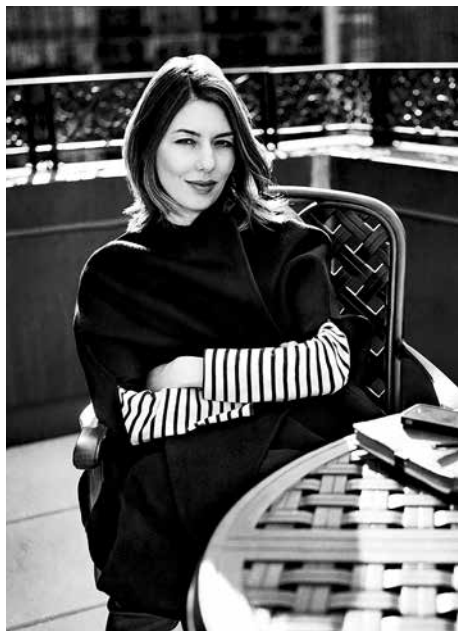
Nữ đạo diễn Sofia Coppola tái xuất

qua đó cho thấy tiềm năng của bộ phim này. Đây cũng là sản phẩm ghi dấu sự hợp tác của hai nữ diễn viên được mệnh danh là "những kẻ thất bại vĩ đại nhất tại Oscar": Glenn Close (7 lần đề cử) và Amy Adams (6 đề cử) với mục tiêu chinh phục tượng vàng.