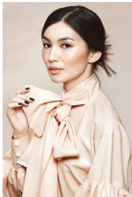
Gemma Chan góp mặt trong phim Let Them All Talk