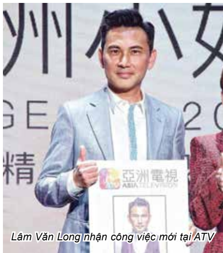
Lâm Văn Long nhận công việc mới tại ATV

LÂM VĂN LONG LÀ DIỄN VIÊN NỔI TIẾNG DO ĐÀI TRUYỀN HÌNH TVB ĐÀO TẠO, NHƯNG BẤT NGỜ ĐƯỢC NHẬN CHỨC PHÓ CHỦ TỊCH ĐÀI ATV - ĐỐI THỦ CẠNH TRANH LÂU ĐỜI - KHIẾN NHIỀU NGƯỜI NGỠ NGÀNG.