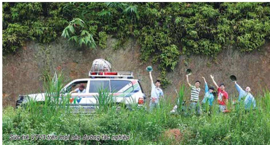
Sức trẻ VTV3 trên mọi nẻo đường tác nghiệp

Café sáng với VTV3 cũng một dự án có sự chung tay của các PV, BTV trẻ. Đây là chương trình rất khó để thay đổi nhận thức, tư duy nhưng nay đã đi vào thực hiện một cách ổn định. Trước kia, chương trình chia mỗi phòng làm một tuần. Hiện nay, chương trình tổ chức thành liên quân, thành đội nhóm liên kết chung và không có bức tường. Trong đó, những người được phụ trách chương trình còn rất trẻ và được đào tạo tỉ mỉ qua các khóa học với các chuyên gia nước ngoài. Điều đáng nói