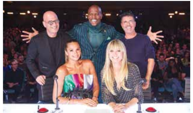
Các giám khảo và MC của America's Got Talent - The Champions mùa thứ 2

H ồng chỉ khán giả mà chính Howie Mandel đã bày tỏ sự tiếc nuối sâu sắc khi trên cương vị giám khảo không thể giúp V.Unbeatable chiến thắng tại mùa giải America's Got Talent (AGT) thứ 14 diễn ra từ tháng 5 đến tháng 9/2019. Chỉ xếp vị trí thứ tư là kết quả được nhiều người đánh giá chưa thực sự công bằng với tài năng của nhóm nhảy đến từ Mumbai (Ấn Độ), vì thế họ đã lập tức tái chinh chiến tại phiên bản The Champions mùa thứ hai của AGT . Lần này vị trí Quán quân đã không thể tuột khỏi tay V.Unbeatable với những màn trình diễn ngoạn mục.