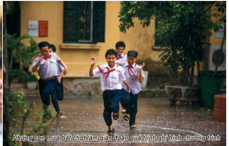
Những cơn mưa bất chợt làm gián đoạn quá trình ghi hình chương trình

chặng đường nhiều dấu ấn với sự vào cuộc hào hứng, đầy “dũng khí” đến từ cả học sinh, gia đình, thầy cô và nhà trường. Sự xuất hiện của thầy hiệu trưởng trường THPT Hùng Vương trong tập 3 chương trình là minh chứng cho lần sóng thay đổi đó. Học sinh trực tiếp đồng dạng nói lên tâm tư của mình với người đứng đầu nhà trường vì các em cảm nhận được rằng thầy hiệu trưởng chính là người mong muốn biến những năm tháng ngồi trên ghế nhà trường của các em thành kỉ niệm đẹp để bằng việc tạo nên những hoạt động ngoại khóa đột phá để gắn kết. Theo thầy Hiệu trưởng trường THPT Hùng Vương, giáo dục trong thời kì mới cần sự thấu hiểu, chia sẻ, ở đó quan hệ thầy cô – học sinh cần phải xóa bỏ một số ranh giới cố hữu để tạo sự gắn bó như những người trong gia đình.