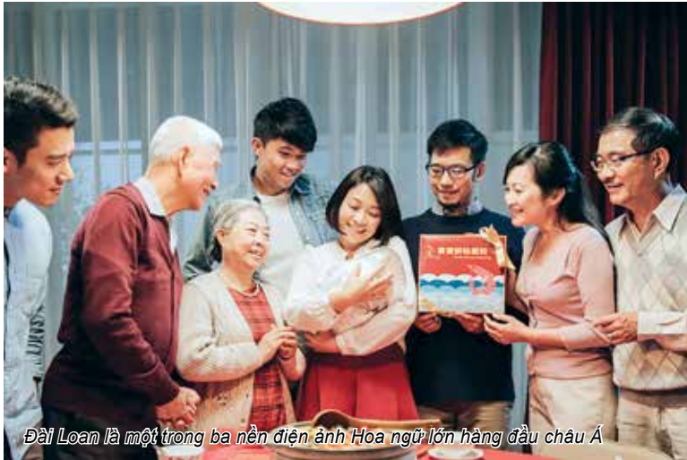
Đài Loan là một trong ba nền điện ảnh Hoa ngữ lớn hàng đầu châu Á

HÀNG LOẠT CÁC NHÀ CUNG CẤP DỊCH VỤ TRỰC TUYẾN TRONG KHU VỰC VÀ TOÀN CẦU ĐANG TÌM KIẾM NƠI SẢN XUẤT NỘI DUNG HOA NGỮ VỚI CHI PHÍ THẤP MÀ KHÔNG BỊ GIỚI HẠN KIỂM DUYỆT. VÀ ĐÀI LOAN CHÍNH LÀ SỰ LỰA CHỌN THAY THẾ SỐ 1 CHO TRUNG QUỐC ĐẠI LỤC.