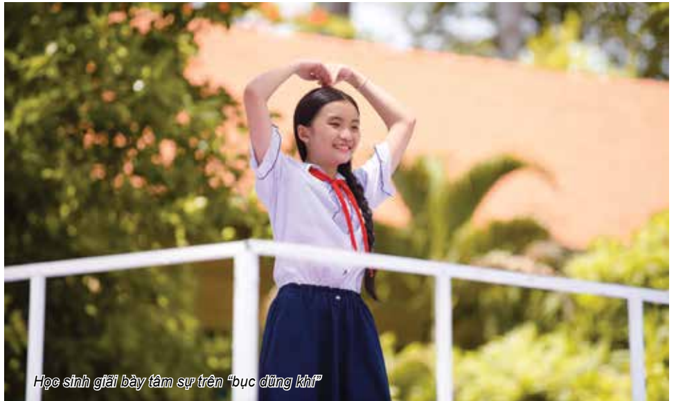
Học sinh giải bày tâm sự trên “bục đứng khi”

Đại diện ekip sản xuất Thiếu niên nói cho biết: “Khi quyết định thực hiện phiên bản Việt cho một format đã rất thành công ở Trung Quốc, chúng tôi xác định bước vào