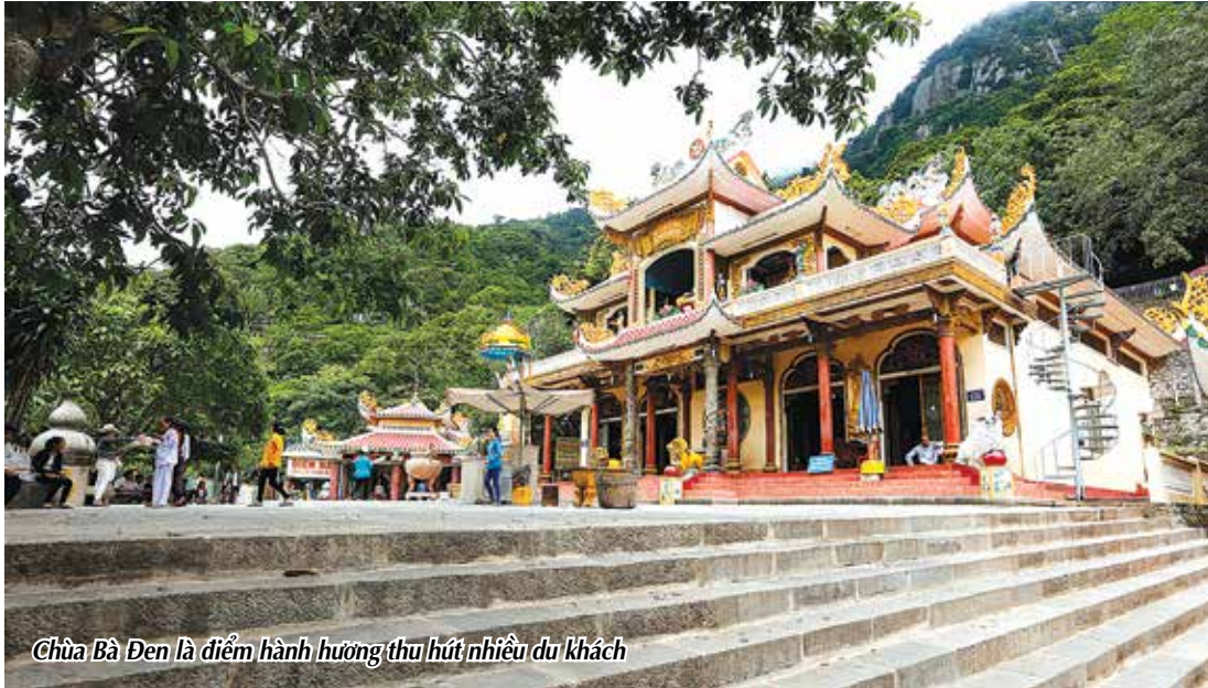
Chùa Bà Đen là điểm hành hương thu hút nhiều du khách

Với vị trí đặc địa, được xem là một trong những cửa ngõ giao lưu quốc tế quan trọng giữa Việt Nam với Campuchia, Thái Lan..., giao lưu trao đổi hàng hoá giữa các vùng kinh tế trọng điểm phía Nam và các tỉnh thuộc vùng đồng bằng sông Cửu Long, Tây Ninh có đủ điều kiện để trở thành một trung tâm kinh tế - xã hội của