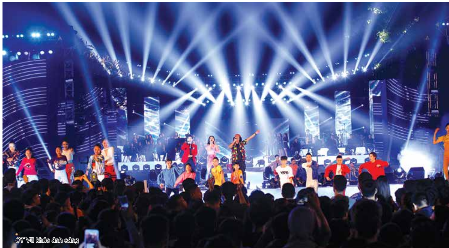
CTV Vũ khúc ánh sáng