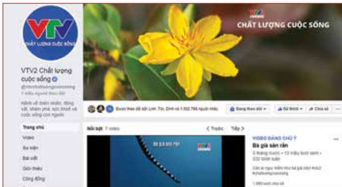
Trang chủ fanpage VTV2 Chất lượng cuộc sống

LÀ MỘT THÀNH VIÊN TÍCH CỰC TRONG VIỆC XÂY DỰNG VÀ ĐIỀU HÀNH TRANG FANPAGE VTV2 CHẤT LƯỢNG CUỘC SỐNG VÀ ĐANG XÚC TIẾN XÂY DỰNG KÊNH YOUTUBE DÀNH RIÊNG CHO KHÁN GIẢ YÊU THÍCH CÁC CHƯƠNG TRÌNH KHOA GIÁO CỦA VTV, BTV VIỆT ANH CHIA SẺ VỀ CÔNG VIỆC CHINH PHỤC KHÁN GIẢ SỐ MÀ ANH ĐANG RẤT TÂM HUỆT.