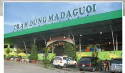
Hình ảnh Trạm dừng Madagui - Lâm Đồng

CÔNG TY CỔ PHẦN XE KHÁCH PHƯƠNG TRANG FUTA Bus Lines