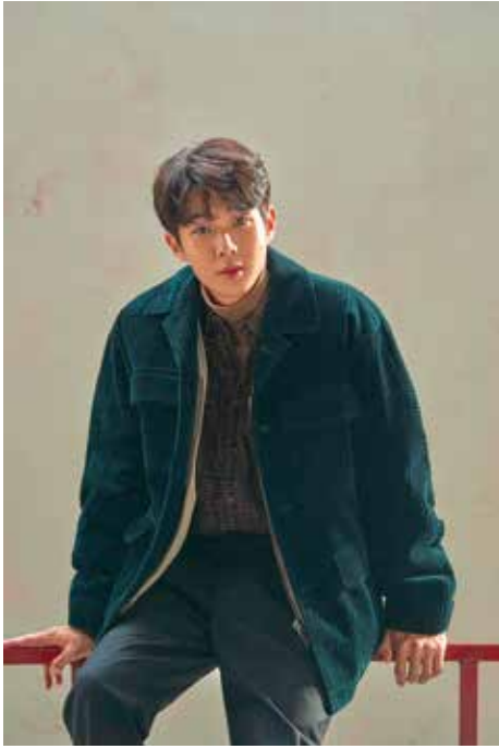
Choi Woo Sik được xem là diễn viên tài năng nhất trong lứa tuổi của anh