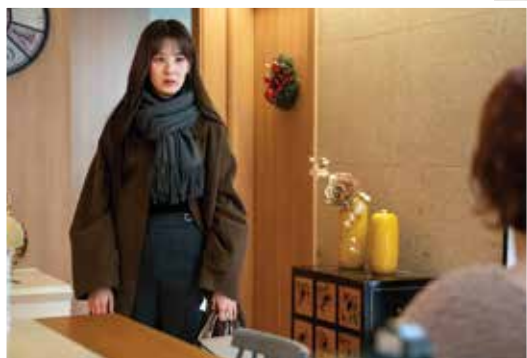
Seohyun khiến dân mạng dậy sóng với vai diễn đồng tính trong Hello Dracula

sinh tên tuổi của 12 rapper huyền thoại tham gia chương trình cũng như xua tan bớt bầu không khí u ám của dịch bệnh.