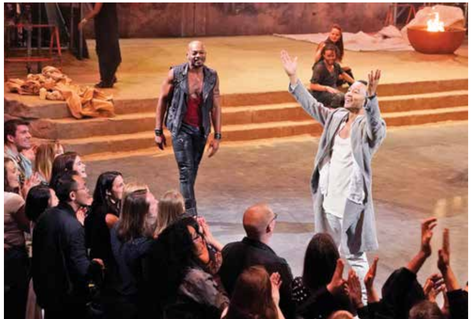
Jesus Christ Superstar Live in Concert có công lớn khi ghi danh cả ba người vào câu lạc bộ EGOT của những huyền thoại

kịch thể giới với các tác phẩm để đời mà hiếm người chưa từng biết tới. Một trong số đó là vở Phantom of Opera (Bóng ma trong nhà hát). Tim Rice là người đồng hành ăn ý với Andrew Lloyd Webber trong hàng loạt vở với phần viết lời xuất sắc cho các bản nhạc mê hoặc lòng người. Ngoài ra, Tim Rice còn cộng tác rất thành công với các nghệ sĩ như Elton John để rồi sau đó giành giải Oscar, Grammy cho những ca khúc bất hủ như: A Whole New World (phim hoạt hình Aladdin ) và Can You Feel the Love Tonight (phim Vua sư tử ). Thuộc thế hệ hậu bối, chỉ mới 39 tuổi, John Legend cũng đã sở hữu sự nghiệp rất đáng nể khi có tới 10 giải Grammy, một tượng Oscar cho ca khúc Glory (phim Selma ) và một giải Tony khi đồng sản xuất vở Jitney .