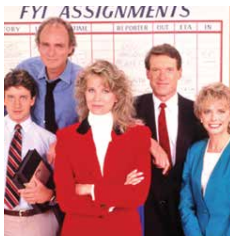
Phim Murphy Brown phiên bản cũ và mới