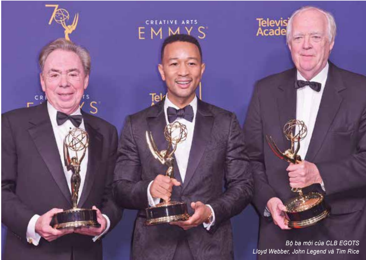
Bộ ba mới của CLB EGOTS Lloyd Webber, John Legend và Tim Rice

EGOT - LÀ TÊN GỌI CỦA MỘT NHÓM NGHỆ SĨ XUẤT SẮC HIẾM CÓ TRONG NỀN NGHỆ THUẬT MỸ KHI SỞ HỮU CẢ 4 GIẢI THƯỞNG CAO QUÝ NHẤT THUỘC 4 LĨNH VỰC KHÁC NHAU: EMMY (TRUYỀN HÌNH), GRAMMY (GHI ÂM - ÂM NHẠC), OSCAR (ĐIỆN ẢNH) VÀ TONY (SÂN KHẤU). CHO ĐẾN TRƯỚC NHỮNG NGÀY ĐẦU CỦA THÁNG 9 NĂM 2018, CHỈ CÓ VỎN VẸN 12 CÁI TÊN ĐƯỢC GHI TRONG “CÂU LẠC BỘ” EGOT. NHƯNG VỚI CHIẾN THẮNG VANG DỘI CỦA NHẠC KỊCH TRUYỀN HÌNH JESUS CHRIST SUPERSTAR LIVE IN CONCERT (THIÊN CHÚA), CON SỐ ĐÃ TĂNG VỘT LÊN 15.