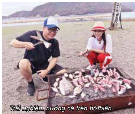
Trải nghiệm nướng cá trên bờ biển

Wakayama là điểm đến thứ ba của chúng tôi, sau khi thăm toà thành cổ, chúng tôi tìm tới thị trấn Hidaka, được trải nghiệm đánh bắt cá, nướng cá bên bờ biển, thử làm tre đen, thăm khu nuôi gấu trúc duy nhất tại Nhật Bản, cho