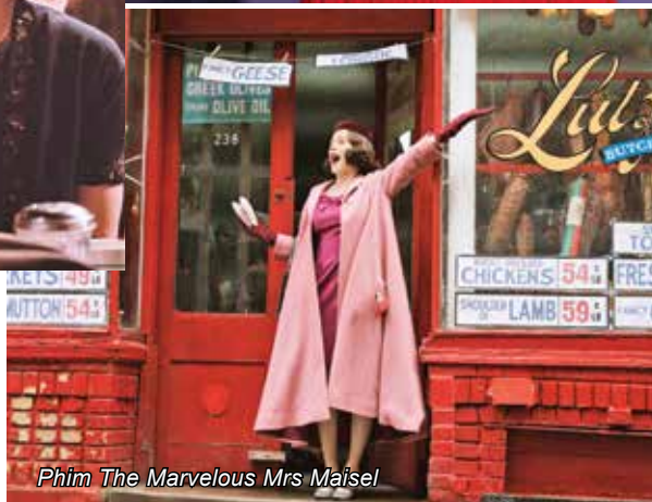
Phim The Marvelous Mrs. Maisel

Rachel đáng kể để có những phút xuất thần trong phim khi người nghệ sĩ độc thoại không chỉ mang trí tuệ, tâm huyết mà mang cả nỗi đau, sự chua xót của mình đổi lấy tiếng cười cho khán giả. Phần thưởng trong mơ cho Rachel là phần tạo hình tuyệt đẹp mà phim dành cho nhân vật nữ chính. Thời trang trong phim được đầu tư bất mắt, mỗi phụ nữ là một quý bà, quý cô với vóc dáng mảnh mai, mái tóc uốn chài cầu kì, trang phục đẹp mê hồn đến từng phụ kiện nhỏ. Có thể nói, mỗi lần nhân vật Midge Maisel xuất hiện như thể mang tới hình ảnh từ các cuốn tạp chí thời trang sành điệu, kể cả khi vào bếp hay quần quanh trong nhà.