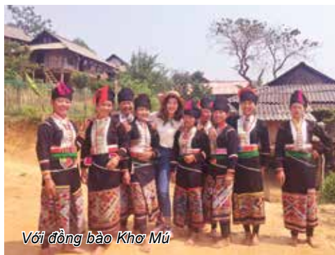
Với đồng bào Khơ Mú

Trải nghiệm thì nhiều, điều mình giàu có nhất chính là những kỉ niệm và cảm