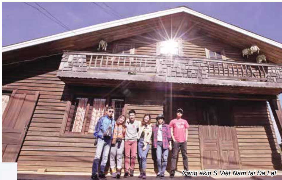
Cùng ekip S Việt Nam tại Đà Lạt

Bên cạnh đó cũng có khá nhiều kỉ niệm liêu lĩnh nhớ đời. Ngày còn đi học, vì muốn vừa học vừa đi dẫn nên mình thường xin phép ekip để mình quay xong sẽ về Hà Nội trước. Một đũa con gái “bánh bèo” như mình lần đầu đi xe khách một mình. Có lần mệt quá ngủ quên bị trộm hết đồ rồi lại gặp đúng xe thả sai bên nên rơi vào trạng thái dở khóc dở cười. Có lần thì quá giờ xe khách chạy nên mình phải ra đường cao tốc đi nhờ xe tải, cả chuyến xe mình như nín thở, tim đập thình thịch. Nhưng có lẽ vì vậy