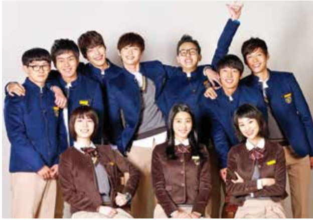
School 2013 : phần hay nhất trong series học đường đỉnh đấm