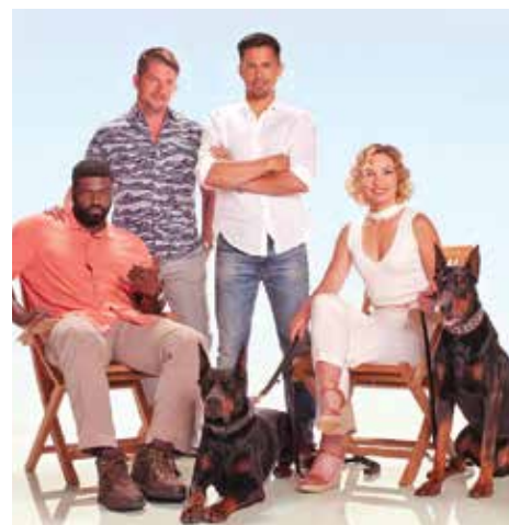
Phim Magnum-P.I 2018