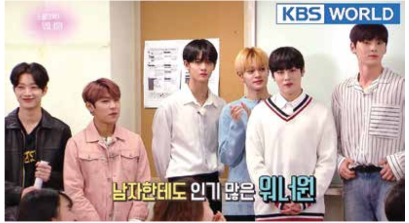
Các chàng trai của Wanna One tham gia chương trình School Attack 2018