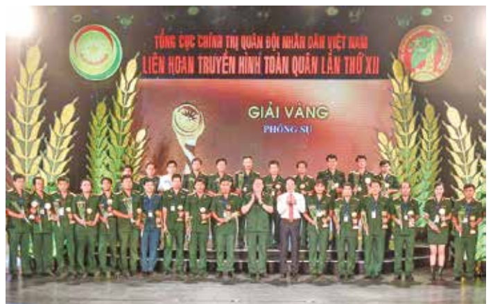
Trao giải vàng hạng mục Phim phóng sự

Một tuần diễn ra Liên hoan Truyền hình Toàn quân (LHTHTQ) là quãng thời gian làm việc nghiêm túc, khách quan và không kém phần căng thẳng của ban giám khảo các thể loại dự thi. Với tổng thời lượng tác phẩm gần 5.500 phút, những nhà quản lý, nhà báo, chuyên gia hàng đầu trong lĩnh vực truyền hình giữ vai trò cân nhắc, đã lao động miệt mài, công tâm, đầy trách nhiệm để giúp Ban Tổ chức không chỉ đánh giá đúng kết quả và chất lượng của LHTHTQ lần thứ 12 mà còn kịp thời chỉ ra những ưu, khuyết điểm, chia sẻ những bài học kinh nghiệm quý báu đối với những người làm báo hình chuyên và không chuyên trong quân đội.