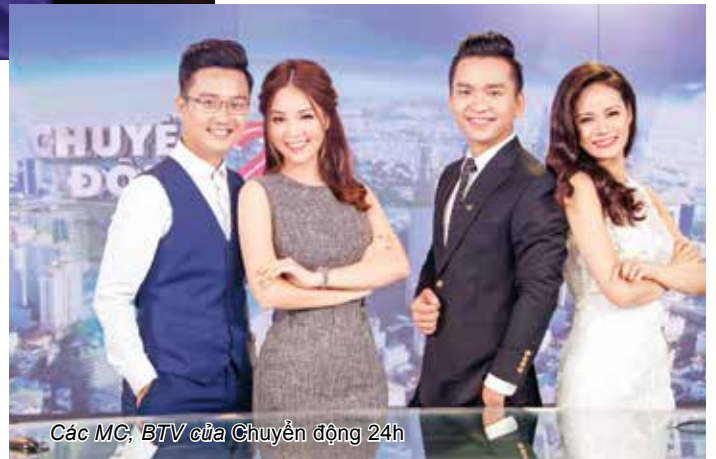
Các MC, BTV của Chuyển động 24h

Quốc phòng và Bệnh viện 103 đã phải tổ chức họp báo, chấn chỉnh tình trạng bảo kê xe cứu thương ở cổng Bệnh viện sau loạt phóng sự Độc quyền xe cứu thương (8/2018); Cục Quản lí chất lượng nông lâm sản và thủy sản (Bộ NN & PTNT) có văn bản đề nghị sở NN&PTNT các tỉnh, thành phố trực thuộc Trung ương không cho phép sử dụng nhựa thông trong giết mổ gia cầm sau loạt phóng sự Vật lông vịt "siêu tốc" bằng nhựa thông (5/2016); TPHCM phải rà soát và điều chỉnh chế độ cho công nhân vệ sinh môi trường đô thị sau loạt bài Cận cảnh công việc