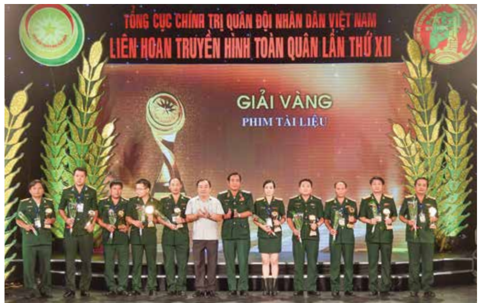
Trao giải vàng hạng mục Phim tài liệu

Phóng sự là thể loại chiếm số lượng lớn nhất tại Liên hoan và cho thấy bước tiến rõ nét về tay nghề, phản ánh một cách toàn diện các mặt hoạt động của công tác Quân sự - Quốc phòng, Đối ngoại Quốc phòng với những thành tích nổi bật của Quân đội trong 2 năm qua, kể từ Liên hoan Truyền