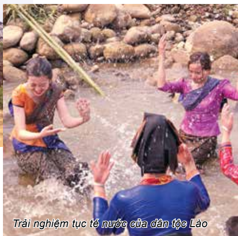
Trải nghiệm tục té nước của dân tộc Lào

mà giờ mình trở nên gai góc hơn, bớt “bánh bèo” đi nhiều rồi (cười).