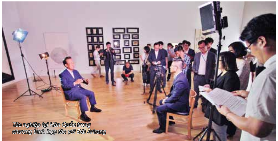
Tác nghiệp tại Hàn Quốc trong chương trình hợp tác với Đài Arirang

◆ Hải Nam đã rèn luyện như thế nào để có được sự tự tin mỗi khi xuất hiện trên sóng?