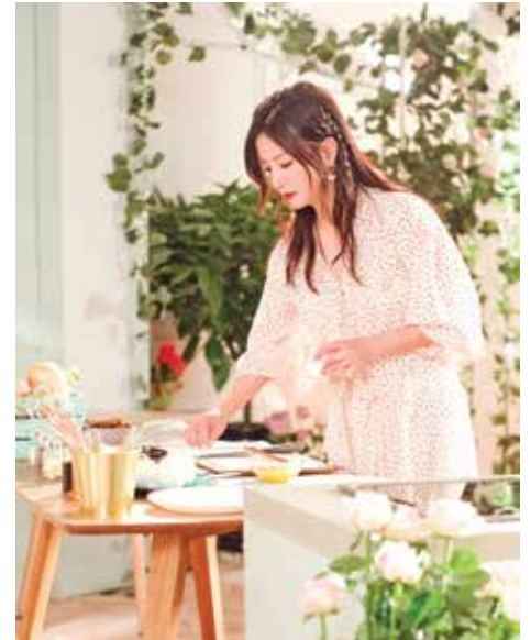
Chương trình Nhà hàng Trung Hoa

NHỮNG CHƯƠNG TRÌNH TRUYỀN HÌNH KẾT HỢP ẨM THỰC, DU LỊCH DO CÁC NỮ NGHỆ SĨ NỔI TIẾNG GIỮ VAI TRÒ CHỦ NHÀ HIỆN ĐANG THU HÚT SỰ QUAN TÂM CỦA CÔNG CHÚNG. NHỮNG CÂU CHUYỆN TƯƠNG CHỨNG RẤT VỤN VẬT NHƯNG ĐÃ MANG LẠI GÓC NHÌN MỚI MẸ CHO NGƯỜI XEM VỀ CUỘC SỐNG THƯỜNG NHẬT CỦA NGHỆ SĨ.