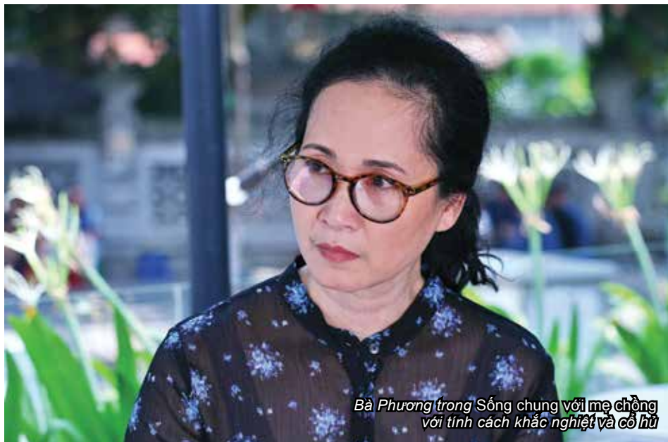
Bà Phương trong Sống chung với mẹ chồng với tính cách khắc nghiệt và cổ hủ