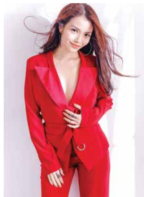
Phong cách thời trang đa dạng của nữ diễn viên

ra thần thái gợi cảm sẽ mang đến một hình ảnh khá thú vị của cô trên màn ảnh.