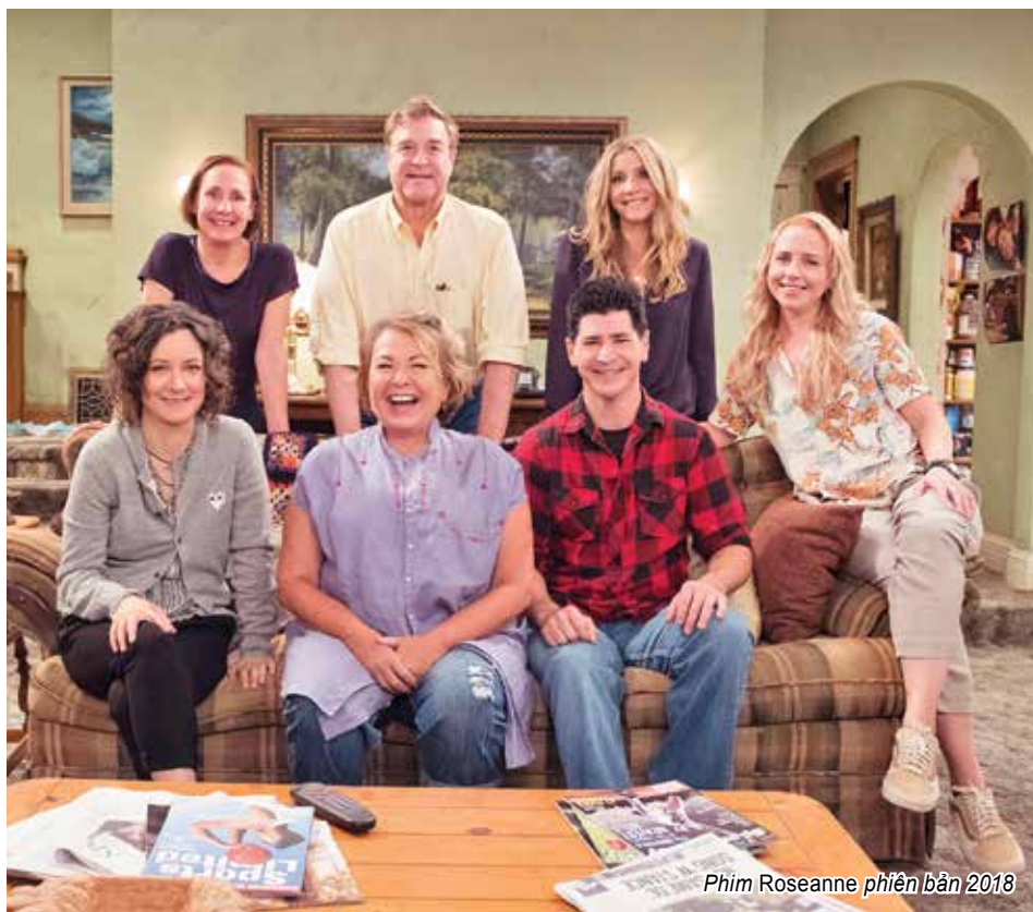
Phim Roseanne phiên bản 2018

Được đánh dấu từ tháng 9 - 12 hàng năm, mùa phim thu tại Mỹ luôn đặc biệt thu hút sự chú ý của dư luận nhờ những bộ phim dài tập và đặc sắc nhất trong năm. Không hẹn mà gặp, hàng loạt series làm lại liên tục đổ bộ trong mùa phim thu 2018 trên năm kênh truyền hình có thể mạnh về phim bao gồm: ABC, CBS, CW, Fox và NBC, không khó để tìm thấy những phiên bản làm lại của nhiều bộ phim: Magnum P.I (Điều tra viên Magnum - 1980), Murphy Brown (Định luật tình yêu của Murphy - 1988), Charmed (Phép thuật - 1998), Roswell (Thị trấn Roswell - 1999), New Mexico (Phi vụ ở Mexico - 1999), The Conners (Gia đình Conner, làm lại từ phim Roseanne - Bà nội trợ Roseanne Conner, năm 1988), Hawaii Five-0 (Biệt đội Hawaii, 1981), Deadwood (Kẻ vô dụng - 2004); và thậm chí là cả “bom tấn” truyền hình Lost in Space (Lạc trong vũ trụ - 1965) trên dịch vụ Netflix hay Cobra Kai