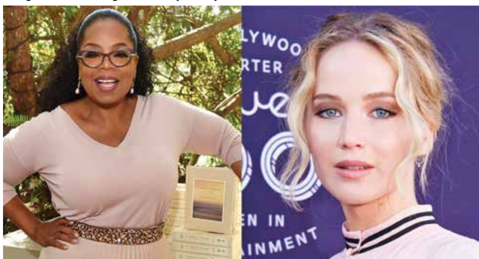
Oprah Winfrey và Jennifer Lawrence là hai nữ nghệ sĩ tích cực ủng hộ phong trào #MeToo

Một thực tế mà ai cũng biết đó là vẫn còn nhiều nạn nhân tại Hollywood bị lạm dụng tình dục chưa đủ dũng khí lên tiếng. Nữ diễn viên Jennifer Lawrence từng đưa ra lời khuyên: “Với vị thế của mình, tôi không ngại nói ra sự thật và luôn sẵn sàng lắng nghe, chia sẻ với những người cùng cảnh ngộ, giúp họ