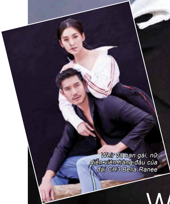
Weir và bạn gái, nữ diễn viên hàng đầu của đài CH3 Bella Ranee

NGƯỜI ĐÀN ÔNG NAM TÍNH NHẤT MÀN ẢNH THÁI ĐÃ KHIẾN NGƯỜI HÂM MỘ BẤT NGỜ KHI VÀO VAI ĐỒNG TÍNH TRONG BỘ PHIM ĐIỆN ẢNH KINH PHÍ THẤP MALILA - THE FAREWELL FLOWER . SAU KHI “CHINH CHIẾN” TẠI NHIỀU LIÊN HOAN PHIM TRÊN THẾ GIỚI, MALILA - THE FAREWELL FLOWER THAM GIA TRANH GIẢI PHIM NÓI TIẾNG NƯỚC NGOÀI HAY NHẤT TẠI OSCAR 2019.