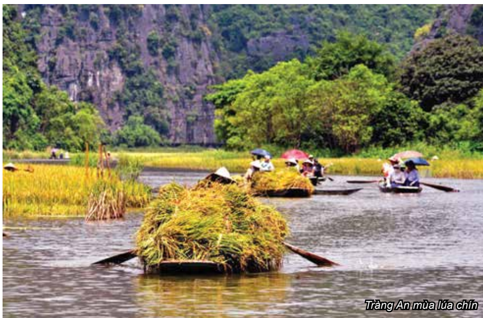
Tràng An mùa lúa chín

Đến với Tràng An, một trong những điều bạn không thể bỏ qua là khám phá