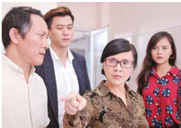
Bà Lâm trong Ngược chiều nước mắt lạnh lùng, tàn nhẫn