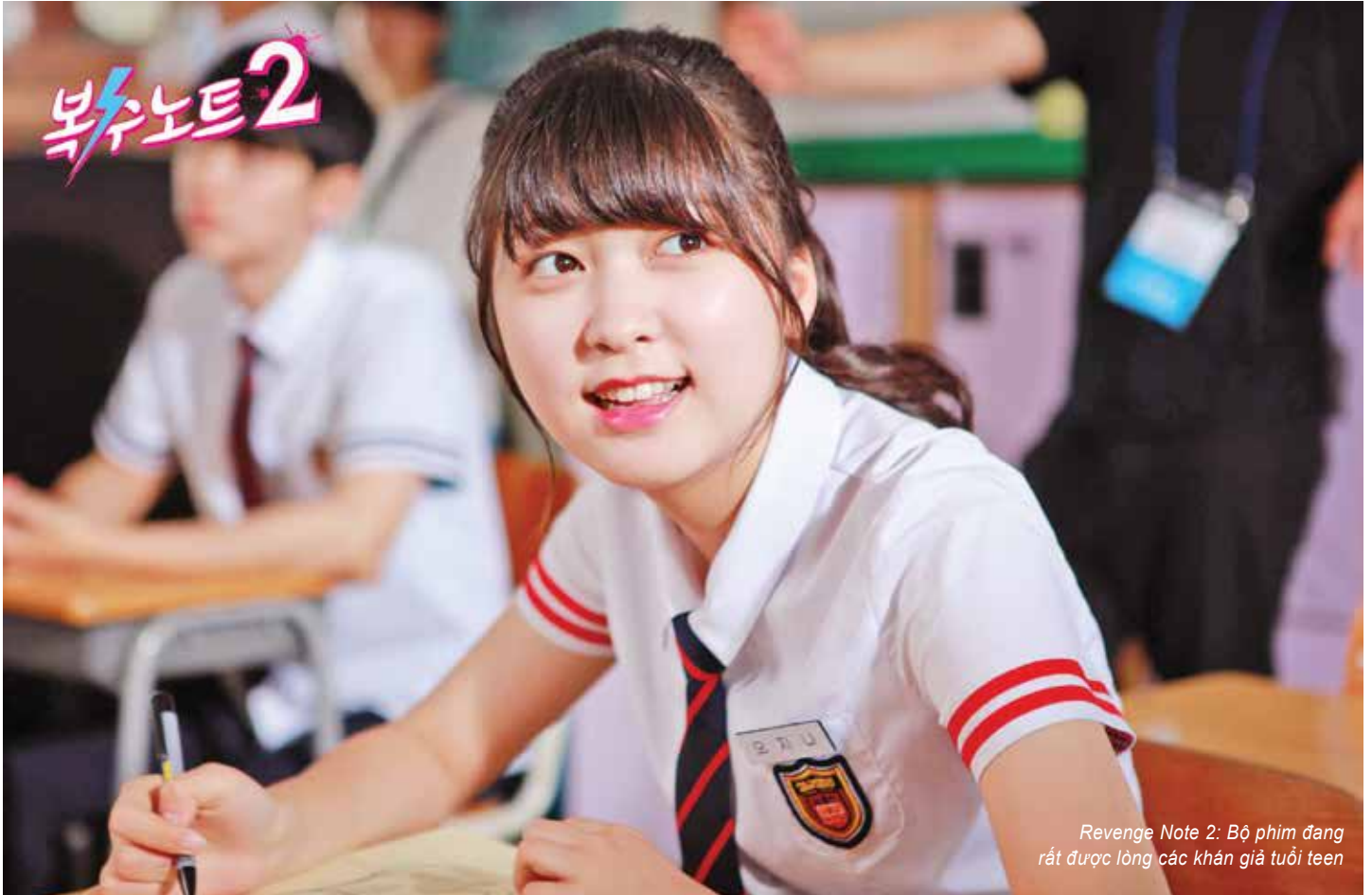
Revenge Note 2: Bộ phim đang rất được lòng các khán giả tuổi teen

VỚI SỰ PHÁT TRIỂN MẠNH MẼ CỦA CÔNG NGHỆ SỐ, KHÁN GIẢ TRẺ NGÀY Càng MẤT DẦN THÓI QUEN XEM TRUYỀN HÌNH. CÁC ĐÀI LỚN CỦA HÀN QUỐC ĐANG NỖ LỰC ĐƯA KHÁN GIẢ Ở ĐỘ TUỔI THANH THIẾU NIÊN QUAY TRỞ LẠI MÀN ẢNH NHỎ SAU MỘT THỜI GIAN DÀI BỊ YOUTUBE VÀ MẠNG XÃ HỘI CHI PHỐI.