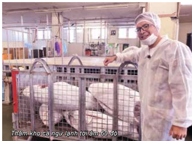
Thăm kho cá ngừ lạnh tới âm 60 độ

tê vì phủ một lớp tuyết mỏng trên mi. Rồi khỏi xưởng cá, chúng tôi may mắn được tham gia lễ hội Việt Nam khi tới thành phố Yokohama cũng thuộc tỉnh Wakayama, gặp rất nhiều người Việt Nam, các cô gái mặc áo dài, cảm giác như đang ở quê nhà vậy.