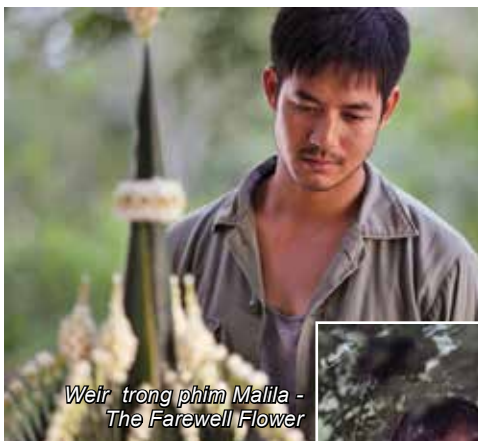
Weir trong phim Malila - The Farewell Flower

Malila - The Farewell Flower là bộ phim thứ hai của đạo diễn Anucha Boonyawatana. The Blue Hour , tác phẩm đầu tay của cô cũng có chủ đề