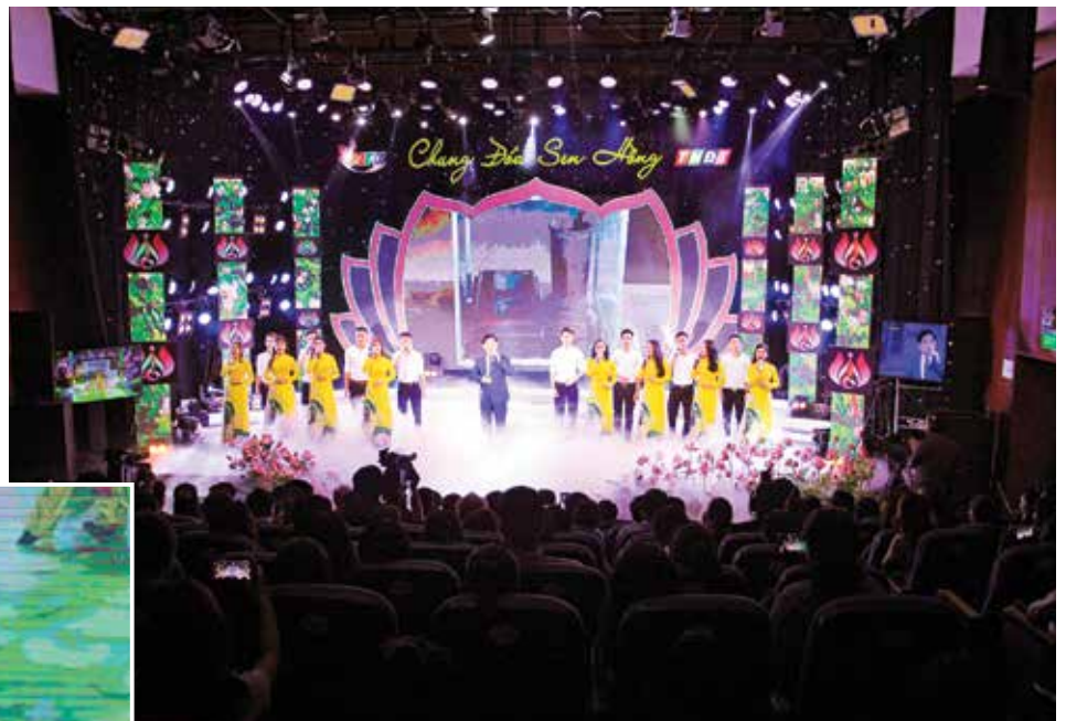
NSND Tiến Dũng biểu diễn tại đêm nhạc Đồi bờ Vi Giặm