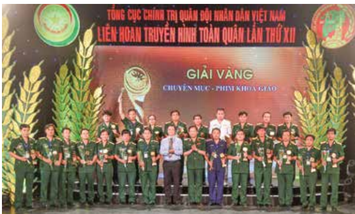
Trao giải vàng hạng mục Chuyên mục, phim Khoa giáo

LIÊN HOAN TRUYỀN HÌNH TOÀN QUÂN LẦN THỨ 12 - NĂM 2018 TỔ CHỨC TẠI CẦN THƠ ĐÃ KHÉP LẠI VỚI NHIỀU THÀNH CÔNG NỔI BẬT. 350 TÁC PHẨM CỦA CÁC THỂ LOẠI THAM GIA ĐÃ TẠO NÊN BỨC TRANH ĐẸP, SINH ĐỘNG, PHẢN ÁNH TOÀN DIỆN CÁC MẶT HOẠT ĐỘNG CỦA NHIỆM VỤ QUÂN SỰ - QUỐC PHÒNG VÀ THỰC TIỄN CUỘC SỐNG NGƯỜI CHIẾN SĨ, TRUYỀN THỐNG CỦA CÁC ĐƠN VỊ, ĐỊA PHƯƠNG TRÊN CẢ NƯỚC.