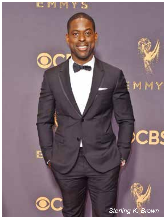
Sterling K. Brown