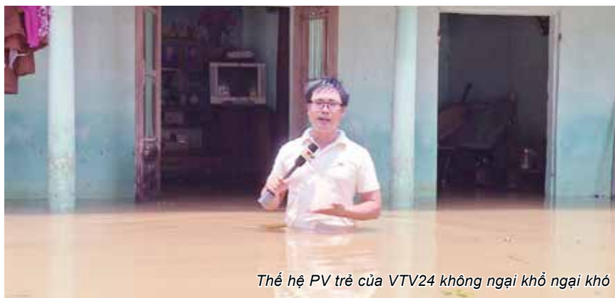
Thế hệ PV trẻ của VTV24 không ngại khổ ngại khó

Bên cạnh Chuyển động 24h và hệ thống bản tin Tài chính - Kinh doanh, các bản tin thiện nguyện và truyền cảm hứng chính là “trụ” thứ ba làm nên thương hiệu của VTV24. Việc tử tế, Cặp lá yêu thương , Hành trình truyền cảm hứng We Choice , Miền quê đáng sống... là những chương trình đã góp phần lan tỏa những giá trị tốt đẹp trong xã hội, được khán giả và dư luận tích cực ủng hộ. Sau khi tách ra khỏi bản tin Chuyển động 24h , ra mắt khung giờ riêng, các chương trình thiện nguyện của VTV24 đã giới thiệu hàng ngàn tấm gương người tốt, việc tốt giúp lan tỏa mạnh mẽ những hành động tử tế trong cộng đồng, hay hỗ trợ hàng ngàn em nhỏ có hoàn cảnh khó khăn được thấp sáng ước mơ cấp sách đến trường... Có thể nói, trụ cột thứ ba về các chương trình Thiện nguyện - Truyền cảm hứng là một sáng tạo của VTV24 trong việc sản xuất ra những sản phẩm báo chí Người tốt - việc tốt, nhân rộng những giá trị tốt đẹp trong cộng đồng, xã hội.