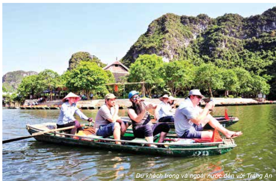
Du khách trong và ngoài nước đến với Tràng An

những địa danh tâm linh. Đền Trần nằm trong khu Du lịch Sinh thái Tràng An, Ninh Bình, là nơi thờ Đức thánh Quý Minh Đại Vương, nổi tiếng linh thiêng khắp xa gần. Đền Trần được Vua Đinh Tiên Hoàng xây dựng vào thế kỉ thứ X, trấn trạch theo 4 hướng Đông - Tây - Nam - Bắc. Là nơi Vua Trần Thái Tông sau khi dẹp loạn giặc Mông xâm lược đã xuất gia tu hành mở mang Phật giáo. Vượt qua 500 bậc đá, chúng tôi vào dâng hương tại đền Trần, ngôi đền tuy nhỏ nhưng ẩn chứa rất nhiều giá trị nghệ thuật chạm khắc đặc sắc trên đá được thể hiện trên các xà ngang, bậc cửa, cột và mái hiên của đền. Những con chim phượng hay cá hoá phượng