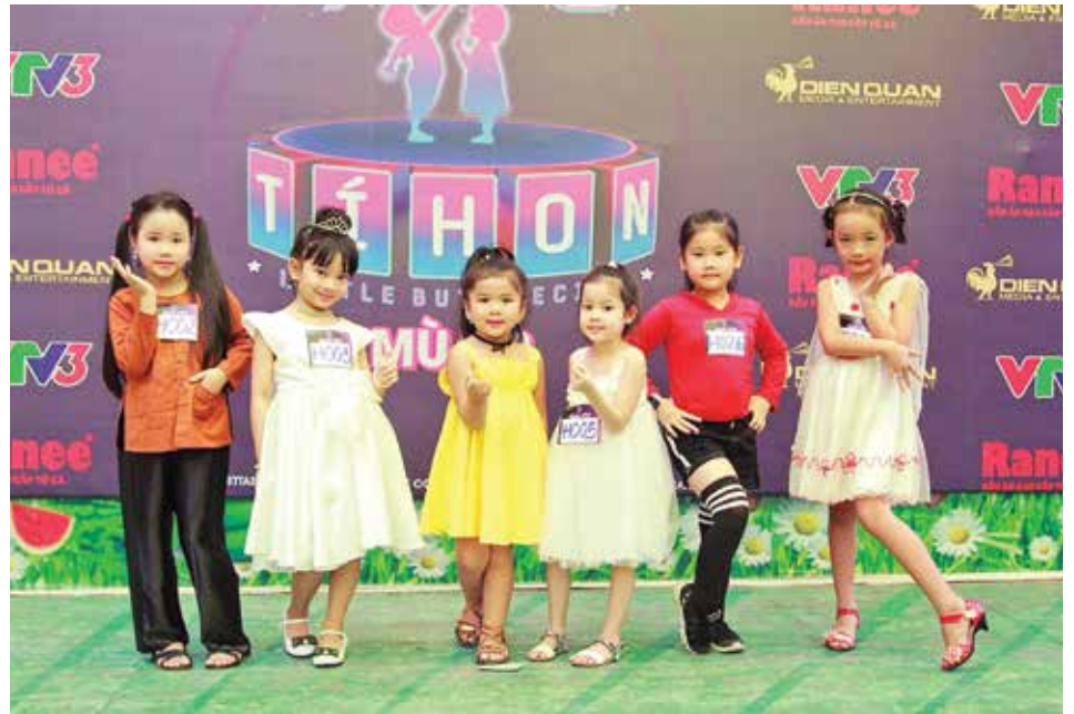
Các thí sinh nhí tham gia vòng tuyển chọn

Đồng hành xuyên suốt cùng các bé là hai nghệ sĩ Trần Thành và Ngô Kiến Huy, từng xuất hiện ở mùa trước. Họ sẽ đảm nhận vị trí hai thành viên trụ cột của Ban bình luận - những người đóng vai trò không kém phần quan trọng trong việc khuyến khích, cổ vũ và tương tác cùng các bé để tạo ra những tình huống vui nhộn, bất ngờ nhằm tạo nên sự khác biệt so với các chương trình thi cử đơn thuần khác. Trần Thành có nhiều kinh nghiệm cũng như lợi thế trong việc tạo sức hút bởi anh đã gây