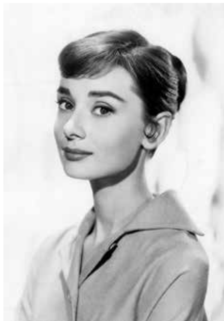
Audrey Hepburn cũng là cá nhân kiệt xuất trong CLB EGOTS

Không chỉ góp phần quan trọng làm nên chiến thắng cho Jesus Christ Superstar Live in Concert ở giải Emmy để mở rộng đội hình EGOT lên tới 15 thành viên, nam ca sĩ John Legend còn là người da màu đầu tiên và là nghệ sĩ trẻ thứ nhì khi được vinh danh lúc 40 tuổi. Anh chỉ "già" hơn một chút so với Robert Lopez – một "quái kiệt" khác trong nhóm EGOT. Robert Lopez không phải cái tên dễ dàng tìm kiếm trên các