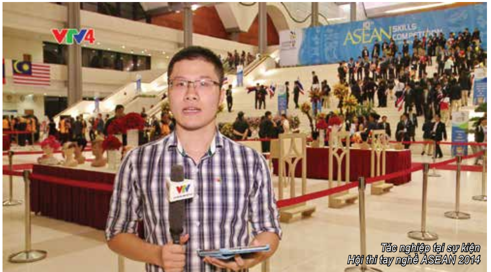
Tác nghiệp tại sự kiện Hội thi tay nghề ASEAN 2014

Mình tốt nghiệp Đại học Hà Nội năm 2013, đúng thời điểm Ban Truyền hình Đối ngoại tuyển phóng viên, biên tập viên. Trước đó, mình cũng đã từng xem các chương trình của VTV4 và rất thích. Ngay lập tức, mình muốn thử sức. Thật may mắn là mình đã được tuyển vào làm việc trong một môi trường tiếng Anh chuyên nghiệp để có cơ hội phát triển đúng chuyên ngành đào tạo. Khi bắt tay