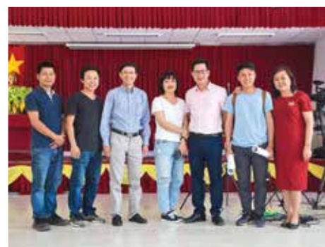
Nhóm làm chương trình và các chuyên gia