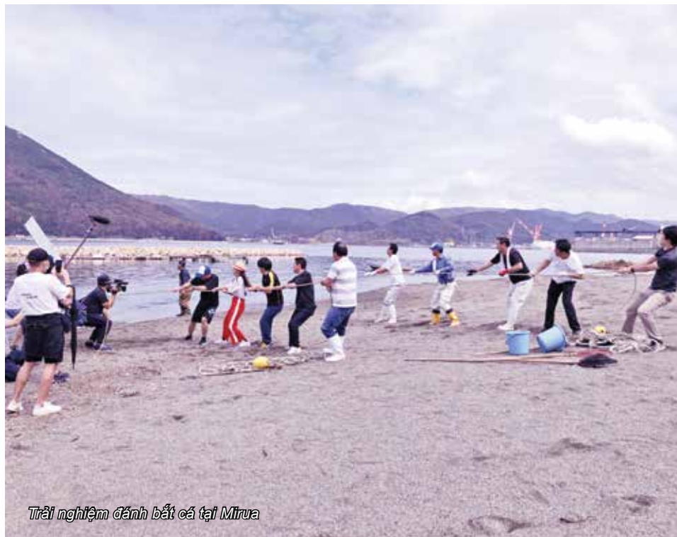
Trải nghiệm đánh bắt cá tại Mirua

mang những nét văn hoá vùng miền đặc trưng thú vị. Tại đây chúng tôi đã được cùng ăn, ở với gia đình người địa phương, đi thu hoạch nông sản, đánh bắt hải sản cùng chủ nhà.