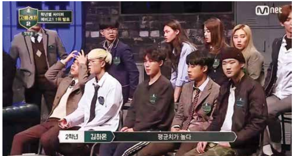
High school Rapper: sân chơi cho các bạn học sinh trung học mê Rap

Hầu hết các đài truyền hình hiện nay đều phát triển nội dung số, nếu các chương trình dành cho giới trẻ có ít người xem trên truyền hình thì nhà sản xuất hoàn toàn có thể phát trên Youtube hoặc các kênh trực tuyến khác nhằm thu hút khán giả và các đơn vị quảng cáo. Chương trình nào thật sự hấp dẫn, chắc chắn các bạn trẻ sẽ háo hức chờ xem trực tiếp trên truyền hình. Ví dụ như After School Hiphop - chương trình thực tế về hip hop dành cho học đường của Đài SBS. Trong chương trình, MC và các rapper sẽ cùng nhau đến các trường cấp 2 và 3 trên khắp Hàn Quốc để lắng nghe câu chuyện của các thí sinh được thể hiện qua các bài rap. After School Hiphop được thực hiện theo phong cách hoàn toàn mới mẻ, khuyến khích các thí sinh thể hiện cảm