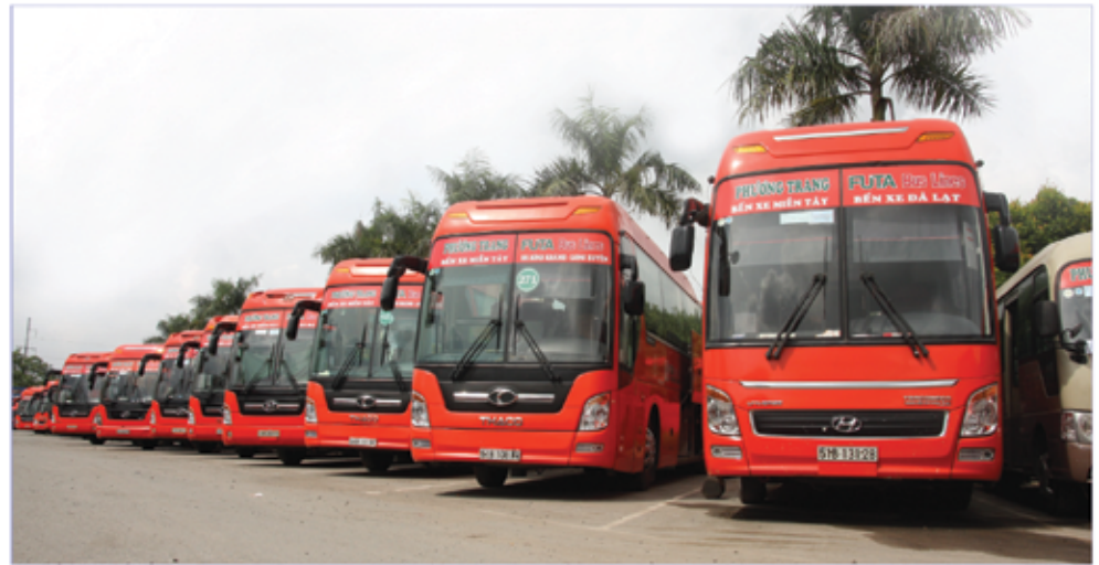
Công ty CP Xe Khách Phương Trang - FUTA Bus Lines được thành lập ngày 14 tháng 04 năm 2002 với hoạt động kinh doanh chính trong lĩnh vực dịch vụ vận tải hành khách.

R a đời từ một doanh nghiệp nhỏ với số đầu xe chỉ từ 5 đến 10 xe khách các loại. Trải qua quá trình hoạt động, với đường lối kinh doanh Uy tín - Chất lượng, với phương châm phục vụ “ Chất lượng là Danh dự ”, sự lịch thiệp hòa nhã, tận tình, chu đáo của đội ngũ nhân viên, Công ty CP Xe Khách Phương Trang - FUTA Bus Lines đã trở thành một địa chỉ tin cậy của đông đảo khách hàng trong cả nước, được hành khách và lãnh đạo chính quyền các cấp hết lòng khen ngợi và đánh giá cao.