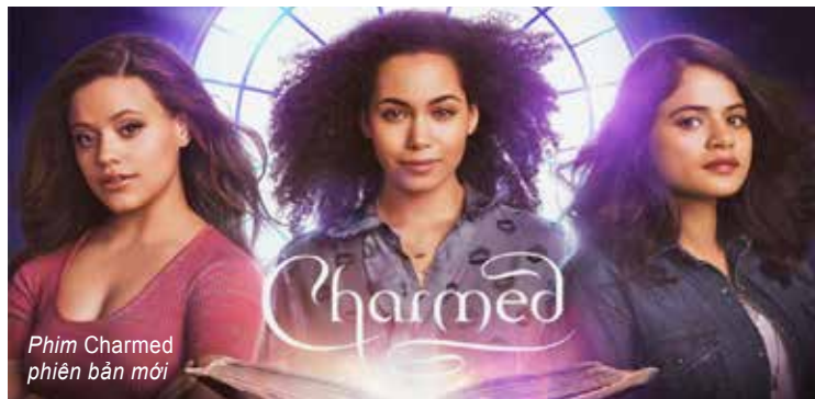
Phim Charmed phiên bản mới