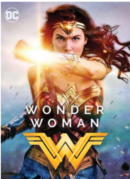
Hình tượng phái nữ trở dậy trên màn ảnh

HOLLYWOOD ĐÃ HOÀN TOÀN THAY ĐỔI, KHÔNG PHẢI CUỘC CÁCH MẠNG VỀ PHIM ẢNH HAY DIỄN XUẤT, THÙ LAO MÀ ĐÓ CHÍNH LÀ SỰ TÔN TRỌNG ĐỐI VỚI PHÁI NỮ, LÀ SỰ TRỞ DẬY MẠNH MẼ CỦA NỮ QUYỀN.