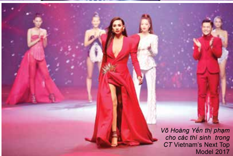
Võ Hoàng Yến thị phạm cho các thí sinh trong CT Vietnam's Next Top Model 2017

nên lạc lõng và đơn độc trên ghế nóng. Nữ nghệ sĩ thừa nhận mình không đủ thân thiết để tung hứng với hai giám khảo còn lại, thậm chí, nhiều khi còn hiểu sai ý nhau dẫn đến những tình huống “dở khóc dở cười”.