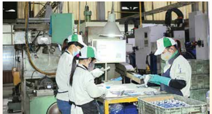
Công ty TNHH Chính xác Việt Nam 1 – đơn vị chấp hành tốt chính sách pháp luật thuế trên địa bàn Vinh Phúc

Bên cạnh đó, ngành Thuế cũng chú trọng đầu tư nhằm hiện đại hóa hệ thống thuế và đẩy mạnh ứng dụng công nghệ thông tin - hiện đại hóa công tác quản lý thuế. Hiện nay, tại Cục Thuế đang vận hành 15 ứng dụng (phần mềm) quản lý cho từng mảng nghiệp vụ chức năng riêng và có một phần mềm TMS quản lý tập trung toàn ngành - công nghệ thông tin hiện đại được đầu tư đúng mức, vì