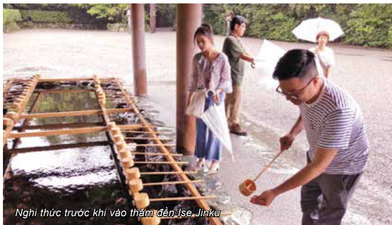
Nghi thức trước khi vào thăm đền Ise Jinku