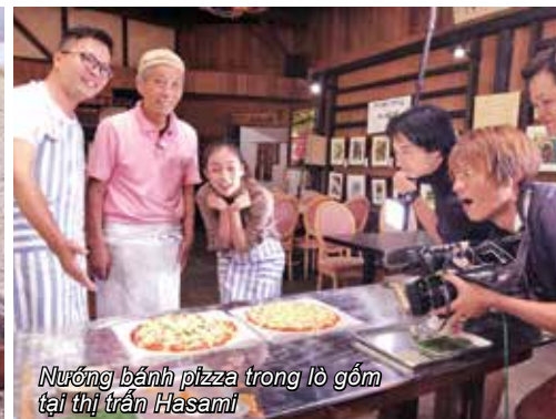
Nướng bánh pizza trong lò gốm tại thị trấn Hasami

hươu cao cổ và tê giác ăn... Một điểm đến nữa mà ekip của chúng tôi không thể bỏ qua là Yuasa, thị trấn làm nước tương đầu tiên của Nhật cách đây 750 năm, thăm quan xưởng làm tương có tuổi đời hơn 200 năm và vào phòng lên men, nơi có những "cụ" vi khuẩn có tuổi đời cùng lúc mới thành lập xưởng.