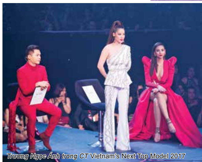
Trương Ngọc Ánh trong CT Vietnam's Next Top Model 2017