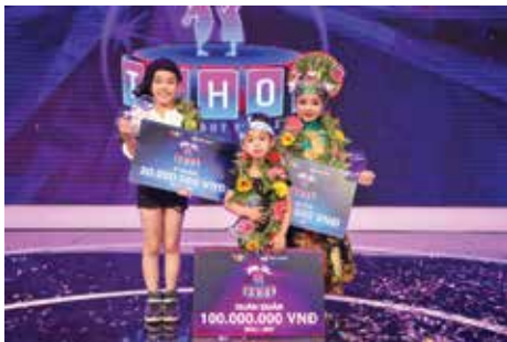
Top 3 Biệt tài tí hon mùa đầu tiên

B iệt tài tí hon là chương trình dành riêng cho các thí sinh từ 3 đến 9 tuổi trên mọi miền đất nước, đa dạng các lĩnh vực như: ca hát, nhảy múa, diễn xuất, hài kịch, ảo thuật, dẫn chương trình, toán học, ngoại ngữ,... và những tài năng đặc biệt khác có thể biểu diễn trước khán giả. Không chỉ là sân chơi cho trẻ em thỏa sức thể hiện tài năng cùng sở thích của mình, cầu nối giúp các em tỏa sáng, chinh phục ước mơ, Biệt tài tí hon còn mang tính giải trí cao bởi những màn đối đáp hóm hỉnh, hài hước và thú vị giữa các thí sinh nhí và Ban bình luận.