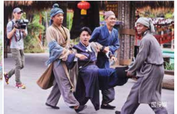
Các hình ảnh trong chương trình

luôn có các thành viên có nhiệm vụ đặc biệt để gây cản trở cho các đội khác. Những thành viên này không cố định mà được chỉ định bất ngờ do nhà sản xuất hoặc bốc thăm, hoặc là các khách mời đặc biệt. Điều này làm tăng kịch tính cho chương trình và đưa đến những kết quả bất ngờ.