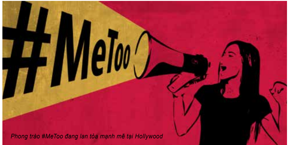
Phong trào #MeToo đang lan tỏa mạnh mẽ tại Hollywood