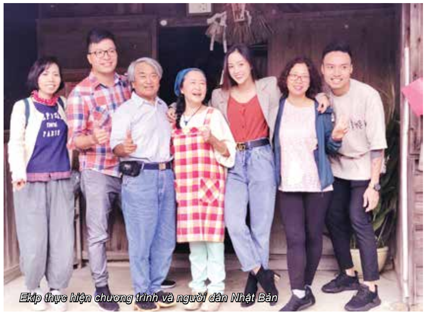
Ekip thực hiện chương trình và người dân Nhật Bản

Sắc màu Nhật Bản là chương trình do VTV phối hợp với Đài TBS Nhật Bản thực hiện, bắt đầu từ 2014. Năm nay, chương trình sẽ đi sâu, khám phá ngành du lịch xanh, một hình thức du lịch trải nghiệm cuộc sống cùng những người nông dân và ngư dân của Nhật Bản. Lần đầu được mời làm nhân vật trải nghiệm, tôi đã trải qua nhiều hoạt động ấn tượng, đáng nhớ cùng ekip làm phim của VTV. Tôi và người bạn đồng hành (diễn viên Tuệ Nhi) đã có dịp được đến 5 tỉnh ven biển của Nhật: Kanagawa, Mie, Wakayama, Nagasaki, Oita. Đây là các tỉnh có diện tích rộng lớn ở Nhật, với các thành phố và thị trấn khác nhau,