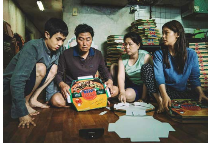
Parasite (Ký sinh trùng) là bộ phim Hàn Quốc đầu tiên chiến thắng ở hạng mục cao quý nhất - Cành Cọ Vàng tại LHP Cannes 2019

ĐIỆN ẢNH HÀN QUỐC ĐÃ CÓ NHỮNG BƯỚC CHUYỂN MÌNH MẠNH MẼ TRONG HƠN MỘT THẬP KỈ QUA. BÊN CẠNH NHỮNG THƯỚC PHIM ĐẸP, NHỮNG BẢN NHẠC CHẠM VÀO TRÁI TIM KHÁN GIẢ, ĐIỆN ẢNH XỨ HÀN THỰC SỰ CHINH PHỤC CÁC TÍN ĐỒ CỦA MÔN NGHỆ THUẬT THỨ BẢY BẰNG KỊCH BẢN CHẤT LƯỢNG, DŨNG CẢM KHAI THÁC NHỮNG MẮNG MÀU SÁNG TỐI CỦA XÃ HỘI HÀN QUỐC MỘT CÁCH CHÂN THỰC, GIÀU CẢM XÚC NHƯNG CŨNG ĐẦY ÁM ẢNH.