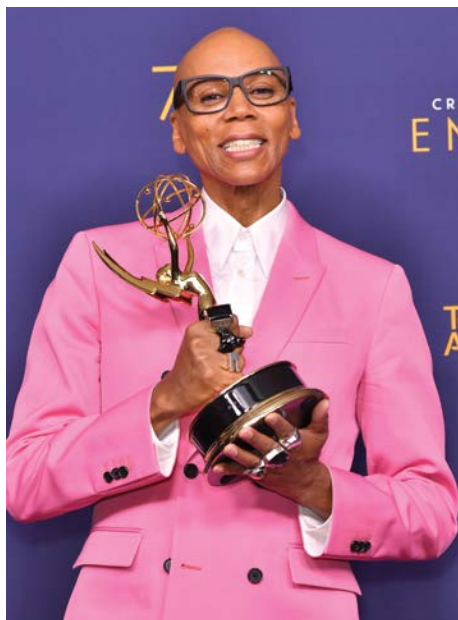
RuPaul bốn lần liên tiếp giành giải Emmy

RuPaul là người đa tài: sáng tác nhạc, ca hát, đóng phim với số lượng album, vai diễn đáng nể. Nhưng ông nổi tiếng nhất với vai trò là một “drag queen” - được hiểu ngắn gọn như những người đàn ông yêu thích việc hóa trang thành phụ nữ. Hóa trang được họ nâng lên tầm nghệ thuật, có dấu ấn, phong cách đậm nét cho dù cách “làm quá” của các “drag queen” trong việc trang điểm, làm tóc, biểu cảm khi chụp hình, tạo dáng... không phải lúc nào cũng phù hợp với thị hiếu của công chúng, càng không đi theo những chuẩn mực thời trang đang thịnh hành. Năm 2009 RuPaul đã sáng tạo và giới thiệu trên sóng truyền hình một format thực tế độc đáo mang tên RuPaul's Drag Race (Chương trình hóa trang của RuPaul) dành cho cộng đồng ngày một đông đảo này. Sự tổng hợp, vay mượn ý tưởng, thử thách, cách tạo tình huống từ hàng loạt chương trình như America's Next Top