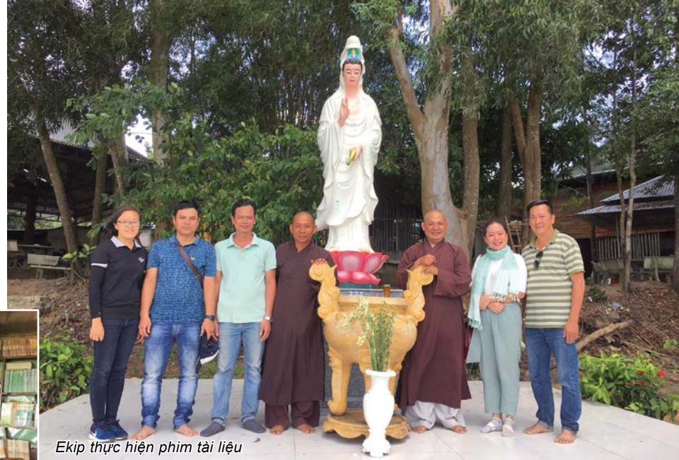
Ekíp thực hiện phim tài liệu

Ba chuyến đi rải rác trong vòng tám tháng, hơn hai mươi cuộc phỏng vấn các nhân vật đã để lại nhiều kỉ niệm đáng nhớ cho nhóm thực hiện. Bộ phim được thực hiện theo hình thức kể