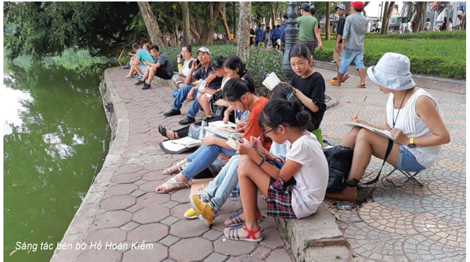
Sáng tác bên bờ Hồ Hoàn Kiếm

THỦ ĐÔ HÀ NỘI NGÀN NĂM VĂN HIẾN VỚI THÁP RỪA CỔ KÍNH, NHỮNG MÁI NGÓI RÊU PHONG PHỔ CỔ HAY NHỮNG KHU TẬP THỂ XƯA CŨ ĐÃ ĐI VÀO THƠ CA NHẠC HỌA VÀ ỚNG KÍNH MÁY ẢNH CỦA RẤT NHIỀU NGHỆ SĨ NỔI TIẾNG. THẾ NHƯNG, CHƯA BAO GIỜ LẠI CÓ MỘT PHONG TRÀO SÁNG TÁC VỀ THỦ ĐÔ THU HÚT MỌI LỨA TUỔI RẪM RỘ TỚI GẦN 4.000 NGƯỜI NHƯ NHÓM KÍ HỌA ĐÔ THỊ HÀ NỘI.