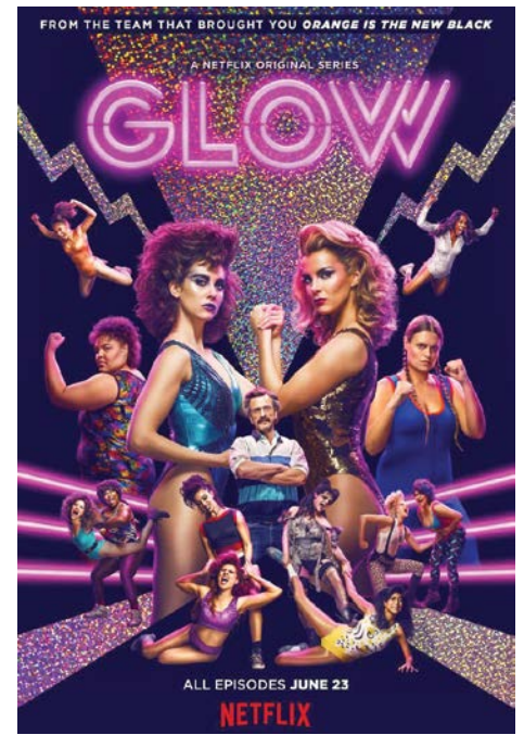
Phim Glow nhanh chóng bị lãng quên

khá rõ ràng cho Disney+ trong phương thức phát hành kiểu truyền thống này đặt ra câu hỏi, phải chăng đây mới là con đường phù hợp cho các sản phẩm truyền hình? Không thể phủ nhận Netflix đã làm nên cuộc