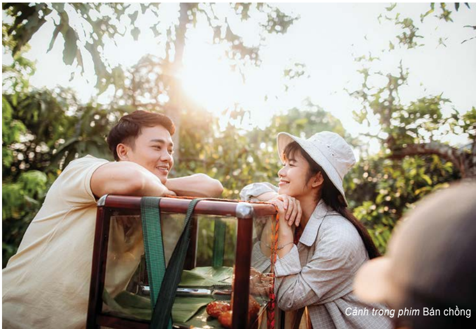
Cảnh trong phim Bán chồng

chạm được vào sự quan tâm của khán giả và mang đến thành công.