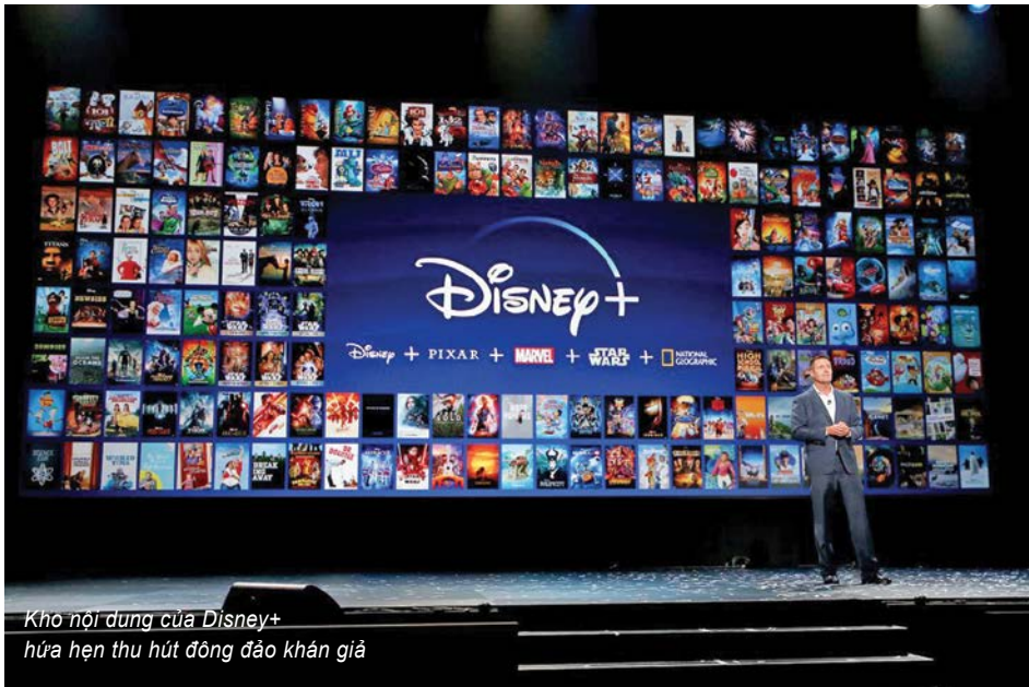
Kho nội dung của Disney+ hứa hẹn thu hút đông đảo khán giả

DỊCH VỤ TRUYỀN HÌNH TRỰC TUYẾN MỚI DISNEY+ DÙ CHƯA ĐẾN NGÀY CHÍNH THỨC TRÌNH LÀN NHƯNG ĐÃ LIÊN TỤC GÂY CHÚ Ý VỚI HÀNG LOẠT DỰ ÁN PHIM RẤT ĐÁNG QUAN TÂM. CHƯA HẾT, DISNEY+ CÒN THÁCH THỨC ĐỐI THỦ NẶNG KÍ NETFLIX BẰNG PHƯƠNG THỨC PHÁT HÀNH HOÀN TOÀN TRÁI NGƯỢC.