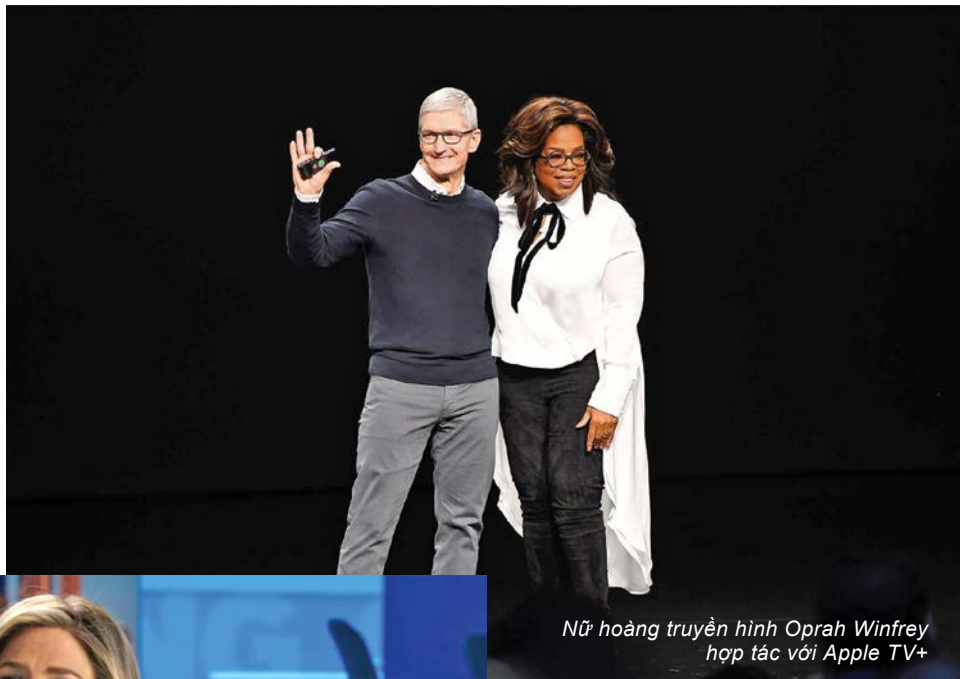
Nữ hoàng truyền hình Oprah Winfrey hợp tác với Apple TV+

Mặc dù có lợi thế của một hãng công nghệ sở hữu nhiều thiết bị cao cấp, Apple vẫn phải đối mặt với sự cạnh tranh gay gắt từ Netflix hay Hulu, Disney... Vì vậy, Apple buộc phải tạo