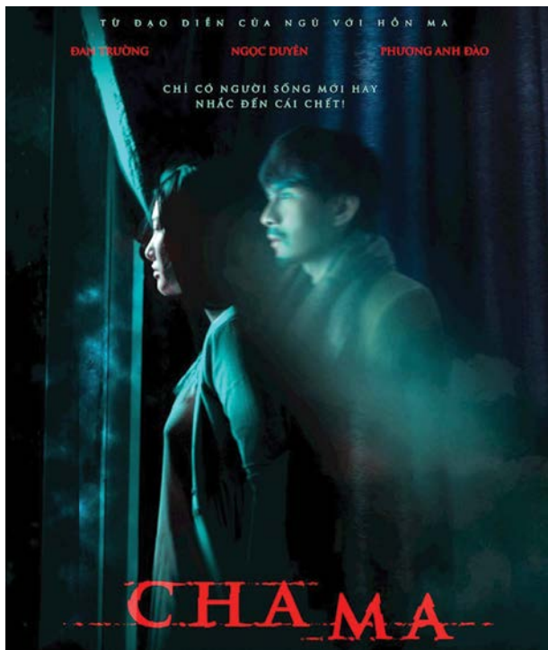
Cha ma đánh dấu bước tiến đầy tiên bộ trong khâu kiểm duyệt