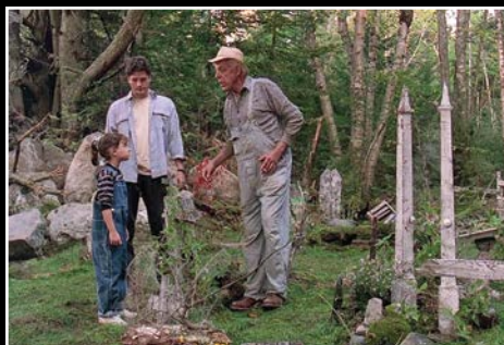
Phim Nghĩa địa ma quái

Thêm một bộ phim nữa do Netflix sản xuất và phát hành là In the Tall Grass được chuyển thể từ truyện ngắn cùng tên do Stephen King viết cùng con trai mình là Joe Hill, xuất bản năm 2012. Đây không phải lần đầu tiên Netflix làm việc với một tác phẩm của King bởi trước đây, vào năm 2017 họ đã từng cho ra mắt Gerald's Game và được đón nhận nồng nhiệt. In the Tall Grass xoay quanh một cặp sinh đôi anh trai và em gái ở Kansas. Sau khi nghe thấy tiếng kêu cứu của một cậu bé, cả hai lần theo tiếng gọi trên một cánh đồng rộng lớn để rồi phát hiện ra rằng không có lối thoát khi đặt chân vào đây. In the Tall Grass có sự tham gia diễn xuất của Patrick Wilson - pháp sư trừ tà Ed Warren trong "Vũ trụ phim kinh dị The Conjuring" lừng danh của hãng