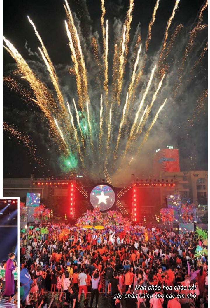
Màn pháo hoa chào kết gây phấn khích cho các em nhỏ

(nghệ sĩ Tụ Long) từ tám trăm bay thần kì lơ lửng từ trên cao hạ xuống mặt đất. Tiên sao (MC Hà Khánh Vân) gây bất ngờ khi đứng cạnh một chú robot khổng lồ, còn Bi béo - con trai nghệ sĩ Xuân Bắc thì hóa thân thành thần đèn bao tử với những màn