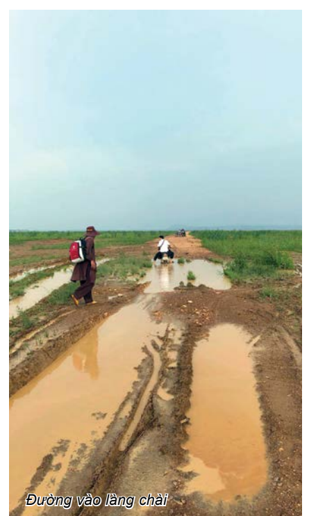
Đường vào làng chài