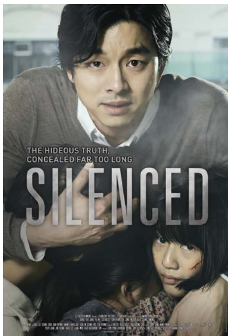
Silenced (Sự im lặng) cũng khai thác đề tài ấu dâm và dựa trên sự kiện có thật

Parasite (Kí sinh trùng) ra mắt tại Liên hoan phim Cannes 2019 và là bộ phim Hàn Quốc đầu tiên chiến thắng ở hạng mục cao quý nhất - Cành Cọ Vàng. Câu chuyện bắt đầu ở căn hộ dưới tầng hầm nghèo khổ ở Seoul, nơi Ki-woo cùng bố mẹ và em gái chật vật sống qua từng ngày. Tình cờ trở thành gia sư cho con gái của ngài Park, Ki-woo lên kế hoạch lừa đảo nhằm đưa người thân của mình vào làm việc trong ngôi nhà này. Tuy nhiên, biến cố xảy ra khiến mọi chuyện trở nên phức tạp. Đạo diễn Bong Joon-ho chuyển tải sự phân biệt giàu - nghèo dưới lăng kính trào phúng mà vô cùng tinh tế trong từng chi tiết ông mang lên màn ảnh. Trong khi gia đình ông Park tận hưởng cuộc sống với tiện nghi xa hoa, những món đồ đắt đỏ, nhà Ki-taek vật lộn để kiếm ăn qua ngày, sự sạo bắt từng vạch sóng wi-fi từ hầm vệ sinh. Nhà Ki-taek, thâm nhập vào nhà ông Park giống như những con kí sinh trùng đeo bám và bòn rút sức sống của