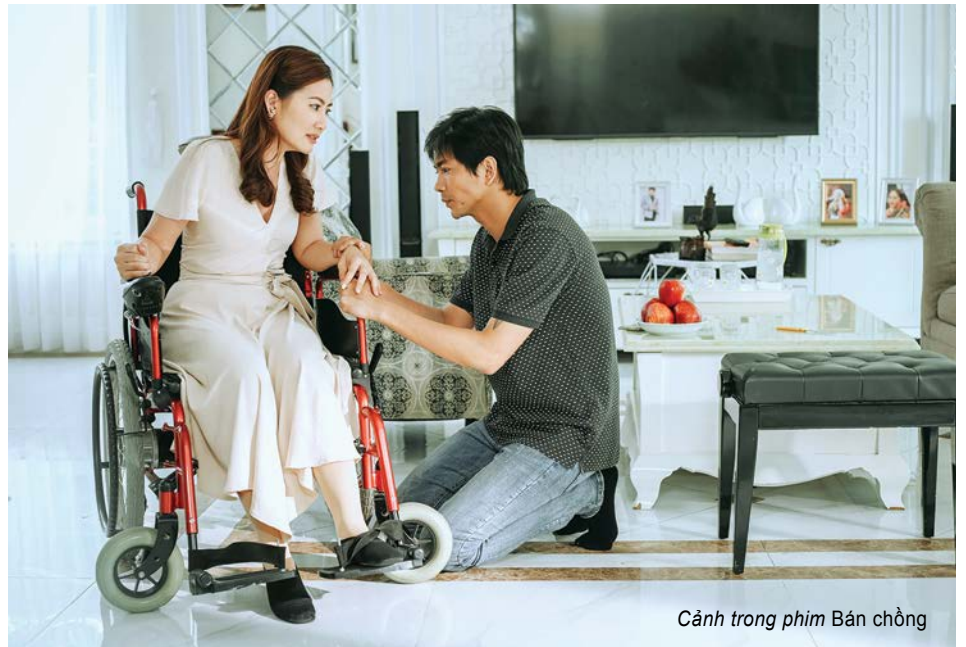
Cảnh trong phim Bán chồng

Thực tế cho thấy, đề tài gia đình là mảnh đất màu mỡ với những người làm phim. Nó là cơ hội nhưng cũng là thách thức bởi chất liệu đầy áp nhưng làm hay, làm để khán giả thấy đồng cảm lại là câu chuyện không hề đơn giản. Thị hiếu khán giả phim Việt hiện nay đã có nhiều điều khác trước rất