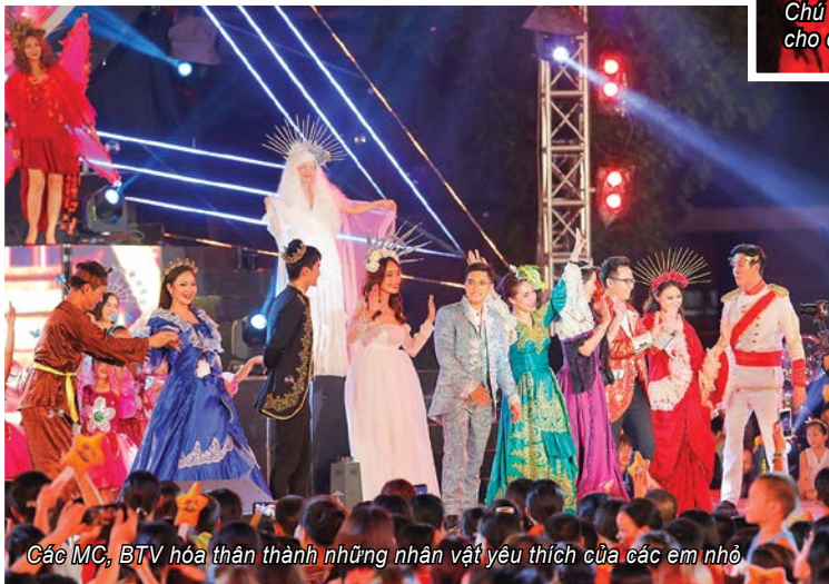
Các MC, BTV hóa thân thành những nhân vật yêu thích của các em nhỏ