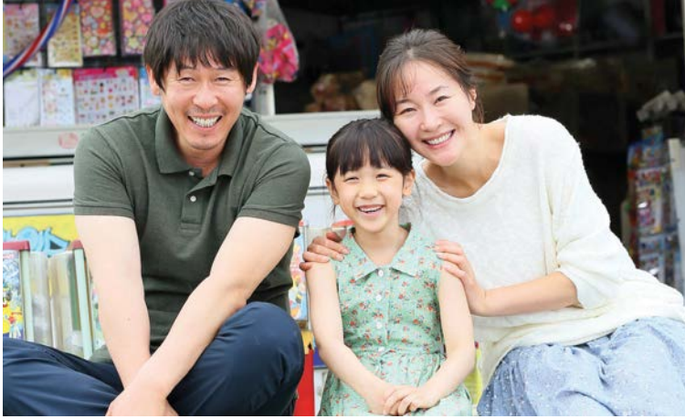
Hope (Niềm hi vọng) là một bộ phim đề tài ấu dâm dựa trên sự kiện có thật gây chấn động dư luận xứ Kim Chi