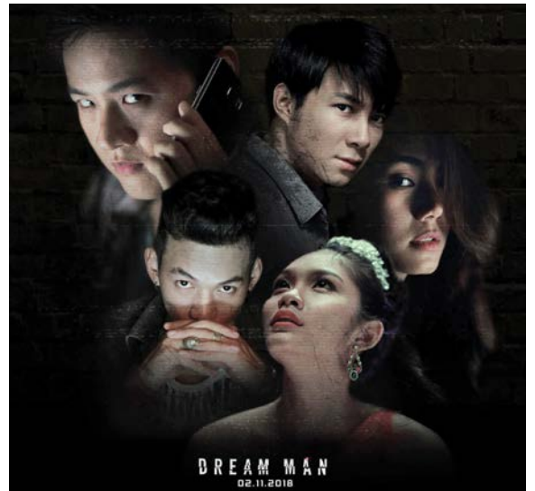
Lời kết bạn chết chóc được đánh giá là bước đột phá của phim kinh dị Việt

nhiều bộ phim Việt lấy đề tài bùa ngải, tâm linh như: Lời nguyện Huyết ngải , Scandal: Bí mật thâm đồ , Người bắt tử ... thế nhưng, đoạn kết của các bộ phim này đều khiến người xem thất vọng khi phải biến câu chuyện bùa ngải thành giấc mơ của nhân vật chính hay nhân vật chính bị ảo giác hoặc chiêu trò hãm hại của kẻ thù... Biên kịch Kay Nguyễn tiết lộ, để qua được cửa kiểm duyệt kịch bản Người bắt tử phải chỉnh sửa hơn 30 lần, riêng đoạn kết phải làm đi làm lại đến 6 lần.