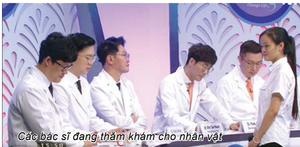
Các bác sĩ đang thăm khám cho nhân vật