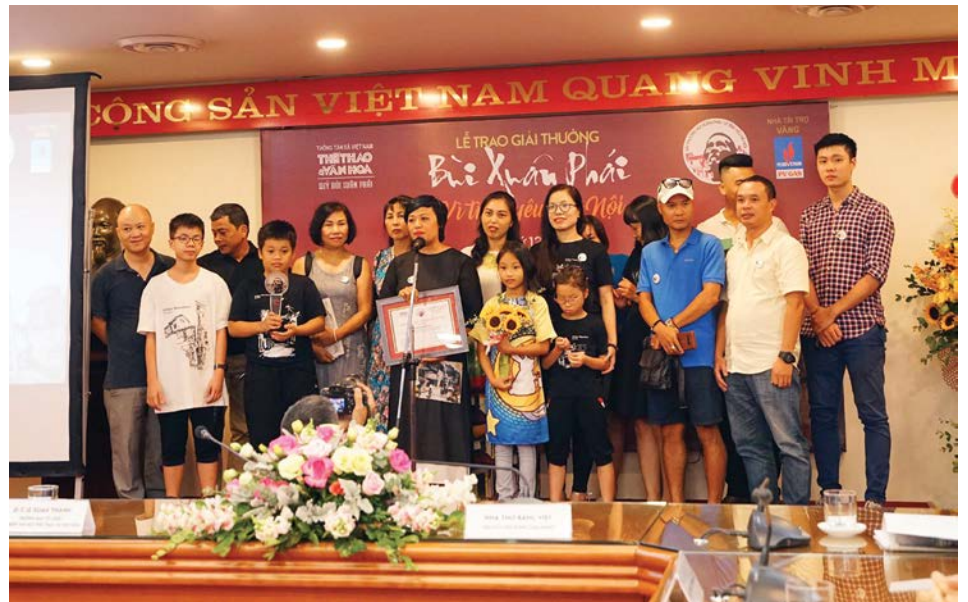
Nhóm Kí họa đô thị HN nhận giải thưởng Bùi Xuân Phái - Vì tình yêu HN 2019

Những ngày đầu tháng 9 vừa qua, nhóm Kí họa đô thị Hà Nội đang tất bật chuẩn bị cho sự kiện Hành trình Kí họa châu Á - Hà Nội 2019 mà nhóm đang cai tổ chức. Khoảng 400 họa sĩ chuyên