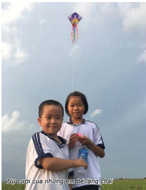
Nụ cười của những em bé làng chài

HỒ TRỊ AN THUỘC ĐỊA PHẬN TỈNH ĐỒNG NAI TỪNG XUẤT HIỆN Ở NHIỀU CHƯƠNG TRÌNH KHÁM PHÁ, DU LỊCH, VĂN HOÁ TRÊN SÓNG TRUYỀN HÌNH. Ở MỘT GÓC KHÁC ÍT NGƯỜI BIẾT TỚI, TRÊN HỒ NƯỚC MÊN MÔNG ẤY, VÀI NĂM GẦN ĐÂY XUẤT HIỆN LỚP HỌC TÌNH THƯƠNG TRÊN BÈ CHO CỘNG ĐỒNG CỦA CƯ DÂN KHOẢNG 50 HỘ LÀ NHỮNG VIỆT KIỂU CAMPUCHIA DI CƯ VỀ ĐÂY. EKIP SẢN XUẤT BỘ PHIM TÀI LIỆU GIEO CHỮ TRÊN MẶT NƯỚC (DỰ KIẾN PHÁT SÓNG THÁNG 10 TRÊN KÊNH VTV1) ĐÃ CÓ NHIỀU TRẢI NGHIỆM TRONG QUÁ TRÌNH TÁC NGHIỆP.