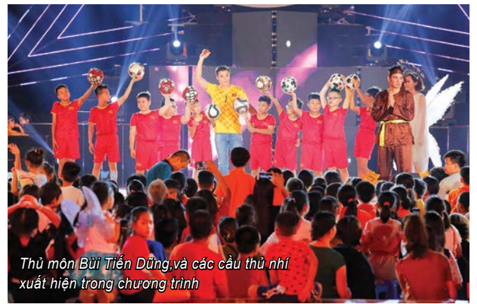
Thủ môn Bùi Tiến Dũng và các cầu thủ nhí xuất hiện trong chương trình

Đ êm thu cổ tích là nơi hội tụ các nhân vật cổ tích, thần thoại, hoạt hình được trẻ em yêu thích nhất qua các tiết mục và các phần trình diễn carnival. Năm nay, lễ hội Trung thu được Đài THVN tổ chức đúng vào Rằm Trung thu ngay tại sân Đài. Một sân khấu hoành tráng với những màn led hiện đại được thiết kế phù hợp với không khí giao lưu và trình diễn ngoài trời dành cho hàng nghìn khán giả nhí cùng cha mẹ vui đón Trung thu.