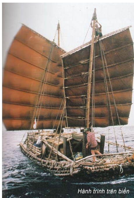
Hành trình trên biển