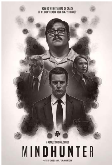
Những bộ phim của Netflix như Mindhunter có nội dung và độ dài thách thức khán giả