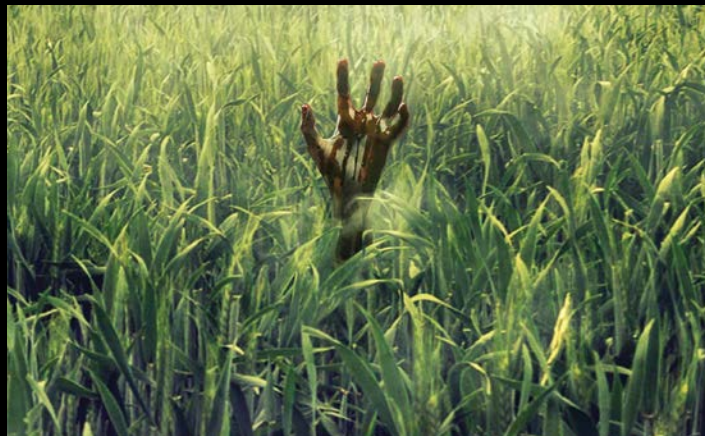
Phim In the Tall Grass

NÓI ĐẾN THỂ LOẠI VĂN HỌC KINH DỊ, CÓ LẼ KHÔNG AI LÀ KHÔNG BIẾT ĐẾN STEPHEN KING, ÔNG VUA CỦA THỂ LOẠI NÀY. VỚI HƠN 350 TRIỆU ĐẦU SÁCH ĐƯỢC BÁN RA TRÊN TOÀN THẾ GIỚI VỚI VÔ VẠN GIẢI THƯỞNG LỚN, STEPHEN KING ĐÃ TRỞ THÀNH ÔNG HOÀNG SÁCH KINH DỊ CŨNG NHƯ CỦA CÁC TÁC PHẨM CHUYỂN THỂ. TRONG NĂM 2019, “ÔNG HOÀNG CỦA NỖI SỢ HÃI” ĐÃ, ĐANG VÀ SẼ CÓ TỚI BỐN PHIM CHUYỂN THỂ RA MẮT KHÁN GIẢ TOÀN CẦU.