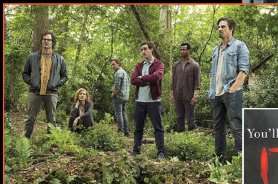
Phim Gã hề ma quái

nào giờ đây đã trưởng thành và phải cố gắng chiến đấu và chống chọi với chấn thương tâm lí nặng nề mà lúc nhỏ anh phải đối mặt tại khách sạn Overlook. Danny phát hiện ra mình có một năng lực siêu nhiên mạnh mẽ và có thể kết nối với cô bé 12 tuổi tên Abra Stone. Từ đấy, Danny và Abra đoàn kết cùng nhau để chống lại Rose the Hat và những kẻ tay sai - The True Knot - những kẻ chuyên truy sát những người có năng lực đặc biệt như Danny và Abra để có cuộc sống bất tử. Doctor Sleep: Âm ảnh kinh hoàng quy tụ dàn diễn viên tài năng gồm tài tử Ewan McGregor, minh tinh Rebecca Ferguson và nam diễn