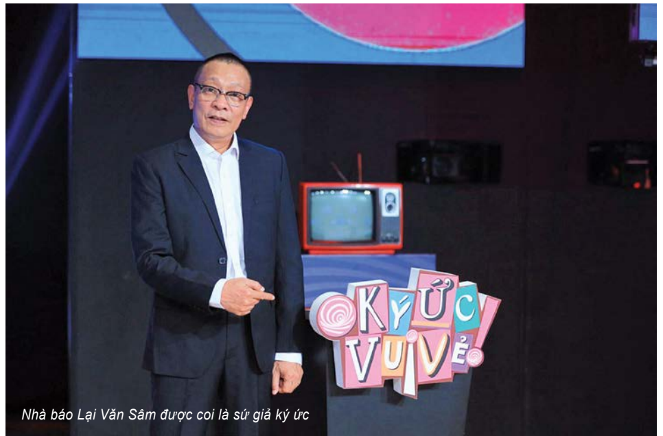
Nhà báo Lại Văn Sâm được coi là sứ giả ký ức

Năm 1997, chúng tôi có cuộc tuyển dụng lớn cho kênh VTV3, các bạn tham gia phải viết bài, trả lời phỏng vấn khá căng thẳng. Nhìn lại, tôi nghĩ đó là một khoảng thời gian vô cùng đáng nhớ vì đã phát hiện được một lớp phóng viên, biên tập viên tài năng mà đến giờ họ đều đã trưởng thành, được khán giả yêu mến,