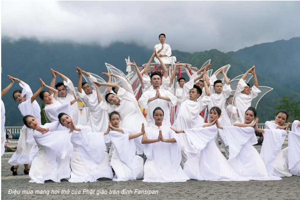
Điệu múa mang hơi thở của Phật giáo trên đỉnh Fansipan

Đ ỉnh Fansipan thuộc dãy núi Hoàng Liên Sơn, cách thị trấn Sa Pa khoảng 9 km về phía Tây Nam, được mệnh danh là “nóc nhà Đông Dương”. Đây là điểm hẹn của nhiều nhà leo núi yêu thích thử thách. Nếu không chọn cách đi bộ, bạn có thể đi cáp treo và sẽ cảm thấy thú vị khi cảm giác được bay giữa biển mây, băng qua những chặng đường ngoạn ngoèo, những phiến đá dốc đứng giữa lưng trời. Được chiêm ngưỡng cảnh sắc núi rừng Sa Pa bằng hệ thống cáp treo đạt kỉ lục thế giới với hệ thống cáp treo ba dây 6292,5 m dài nhất thế giới cũng là một thử nghiệm đáng giá. Trong hành trình di chuyển bằng cáp treo đến với Fansipan, bạn cũng có thể dừng chân tại quần thể công trình tâm linh với Thanh Vân Đắc Lộ, đại tượng Phật A Di Đà, đường La Hán, Kim Sơn Bảo Thắng tự, Tượng Quan âm như mở ra hành trình hành hương tới cõi Phật linh thiêng của người mộ đạo. Cứ như vậy, mỗi chặng đường leo tới nơi, kẻ du hành muốn mình được hòa mình cùng đất trời.