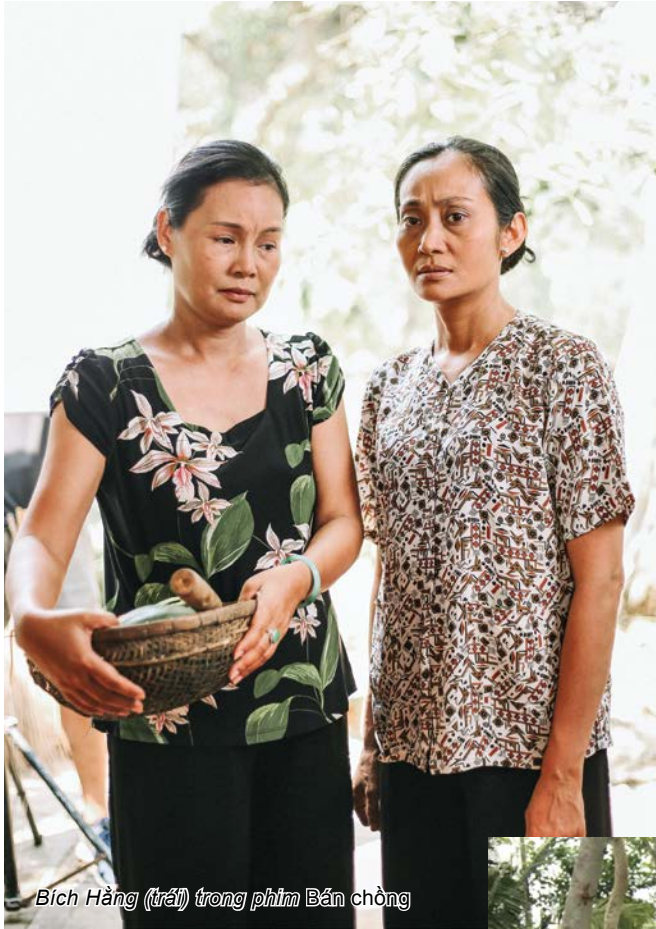
Bích Hằng (trái) trong phim Bán chồng