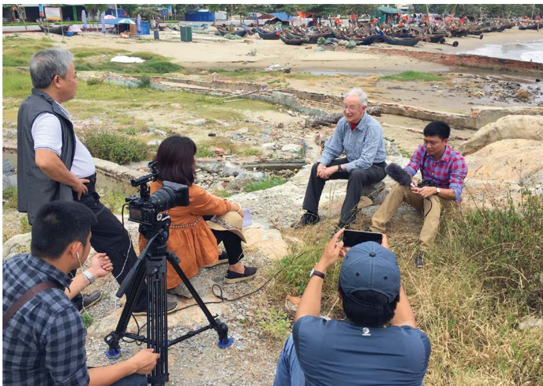
Đoàn làm phim ghi hình về nhân vật Tim

◆ Xin đạo diễn cho biết xuất phát từ đâu chị quyết định thực hiện bộ phim 5500 dặm vượt Thái Bình Dương?