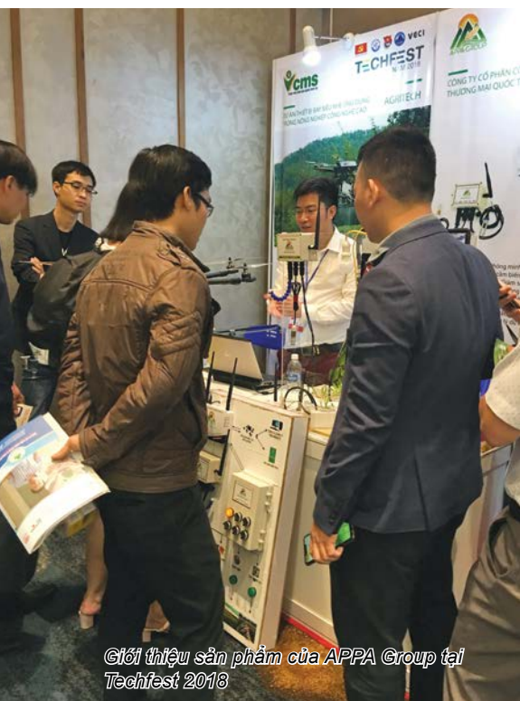
Giới thiệu sản phẩm của APPA Group tại Techfest 2018

◆ Tại Ngày hội khởi nghiệp đổi mới sáng tạo Quốc gia Techfest 2018, các sản phẩm ứng dụng IOT trong lĩnh vực nông nghiệp thông minh của APPA đã được đánh giá rất cao. Anh có thể chia sẻ cụ thể hơn về tính ứng dụng thực tiễn các sản phẩm của mình?