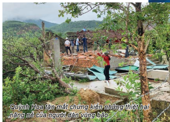
Quỳnh Hoa tận mắt chứng kiến những thiệt hại nặng nề của người dân vùng bão