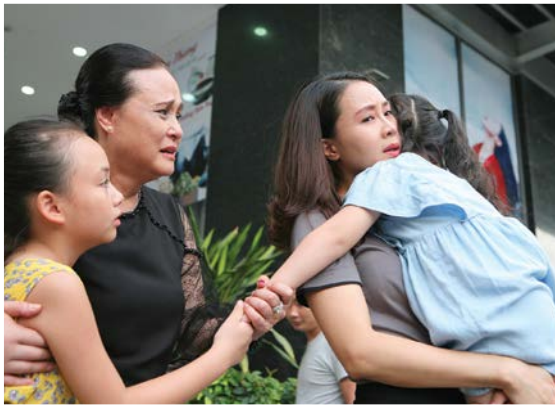
Cảnh trong phim Hoa hồng trên ngực trái

PHIM VỀ ĐỀ TÀI GIA ĐÌNH CÓ ƯU THẾ LÀ GẮN GŨI, ĐÔI KHI CHỈ LÀ NHỮNG CÂU CHUYỆN BÌNH THƯỜNG, VẬT VẠN TRONG CUỘC SỐNG NHƯNG DỄ CHẠM ĐẾN CẢM XÚC CỦA KHÁN GIẢ. TUY NHIÊN, LÀM SAO ĐỂ KHAI THÁC MẢNG NỘI DUNG TƯƠNG CŨ NHƯNG LẠI PHẢI MỚI NÀY, TÌM ĐƯỢC NHIỀU GÓC CẠNH KHÁC NHAU VÀ KỂ THÀNH CÂU CHUYỆN HẤP DẪN TRÊN MÀN ẢNH LÀ CHUYỆN KHÔNG HỀ DỄ.