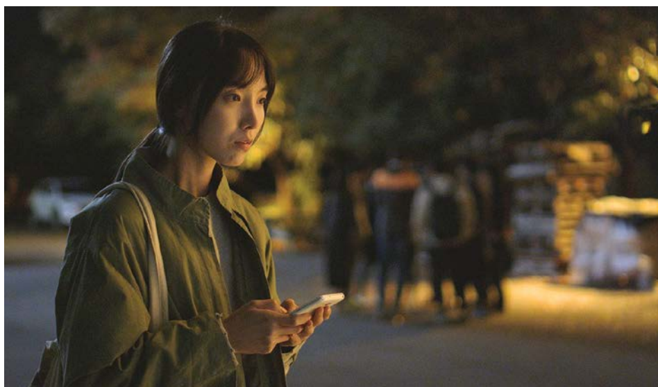
Ghost Walk cũng đã gây tiếng vang trong làng điện ảnh Hàn Quốc

vật chủ. Thế nhưng, bản thân gia đình ông Park cũng không thể tự làm chủ chính ngôi nhà, cuộc sống, họ trả tiền để sống “kí sinh”, phụ thuộc vào chính những người giúp việc của mình.