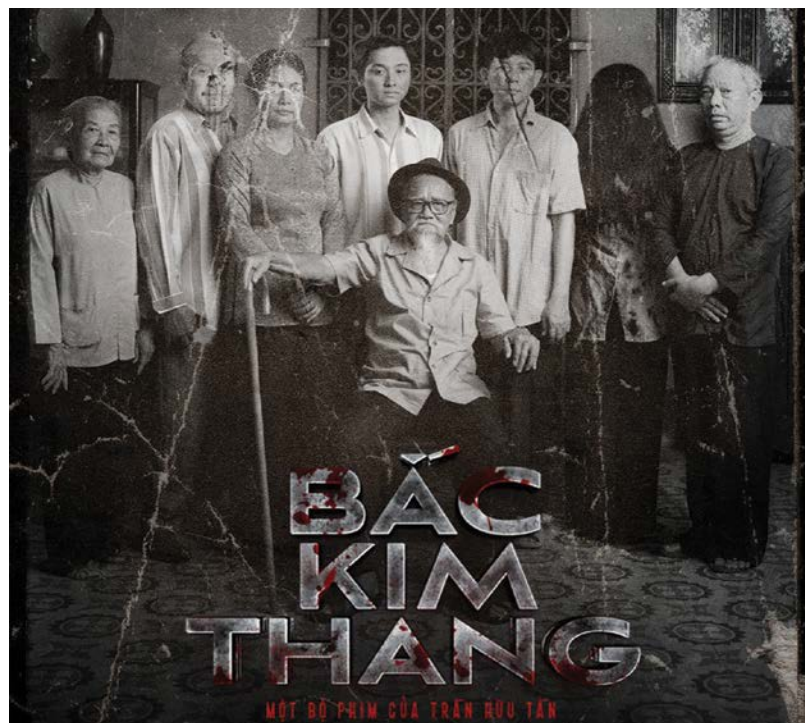
Poster đầy ấn tượng của Bắc Kim Thang