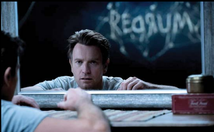
Phim Doctor Sleep