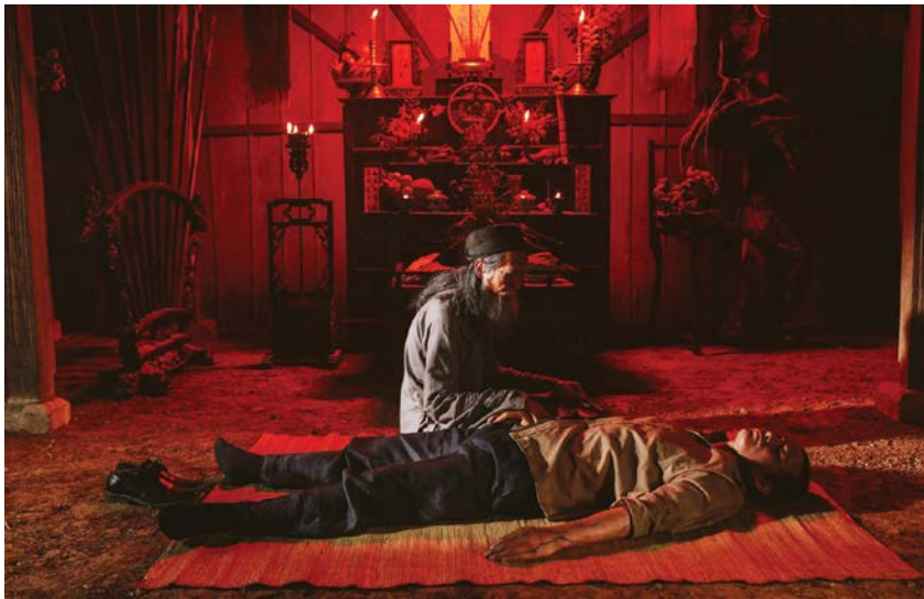
Người bắt tử phải chỉnh sửa kịch bản đến 30 lần và làm lại cái kết 6 lần để được ra rạp