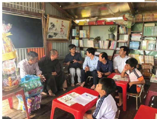
Đoàn làm phim và chính quyền địa phương huyện Định Quán, tỉnh Đồng Nai đến thăm lớp học vào ngày khai giảng 5/9

đã phát nguyện, quyết tâm đem con chữ đến với các em và người dân nơi đây vì đó là cách duy nhất để thoát nghèo, hòa nhập với xã hội. Lớp học của sư thầy Chơn Nguyên rất đặc biệt, rộng chừng 10m 2 , chỉ vài bộ bàn ghế, cái bảng đen to. Ban đầu lớp học chỉ có vài em, lâu dần các em ham thích