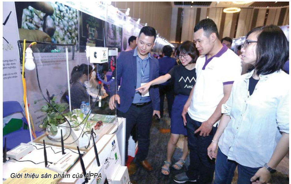
Giới thiệu sản phẩm của APPA

Bí quyết của chúng tôi nằm ở sự cam kết đồng hành chặt chẽ cùng với người nông dân. Chính điều này đã tạo nên những sản phẩm giải pháp phù hợp