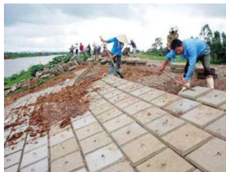
Cải tạo, nâng cấp hành lang đê Vân Cốc ở Đan Phượng.