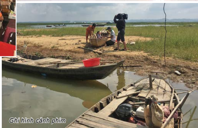
Ghi hình cảnh phim

chuyện bằng hình ảnh mà không dùng lời bình nên đòi hỏi sự chất lọc cao trong từng khung hình.