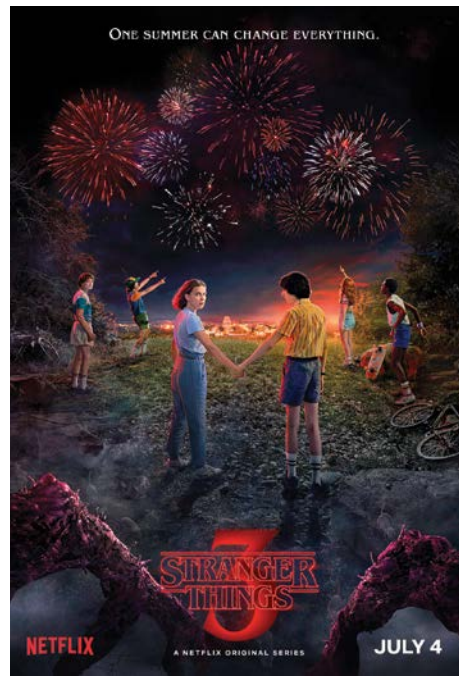
Stranger Things (Cậu bé mắt tích) mùa thứ ba dù hấp dẫn, xuất sắc nhưng cũng mất dần sự chú ý