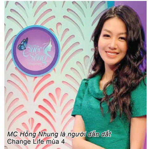
MC Hồng Nhung là người dẫn dắt Change Life mùa 4

nhưng bạn lại bị dị tật ở hàm khiến khuôn mặt biến dạng. Gia cảnh mẹ bị tai nạn nên nhà chỉ trông vào mấy sào ruộng của bố.