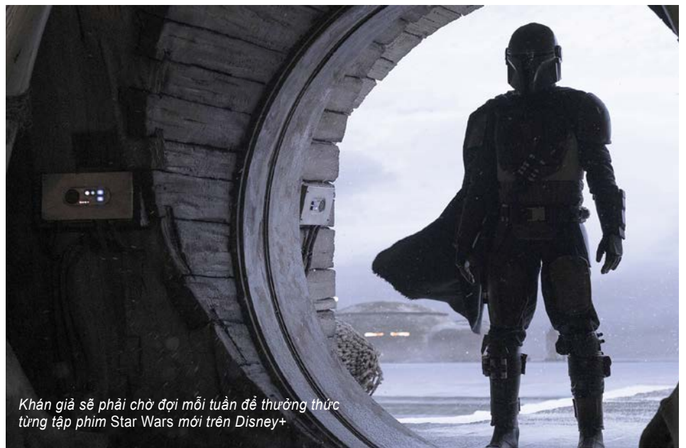
Khán giả sẽ phải chờ đợi mỗi tuần để thưởng thức từng tập phim Star Wars mới trên Disney+

Disney+ quyết định không đối đầu với Netflix theo thế mạnh của đối thủ mà bằng con đường riêng của mình. Cụ thể, người dùng Disney+ vẫn phải tiếp