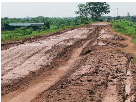
Đê Vân Cốc ở Đan Phượng xuống cấp nghiêm trọng.