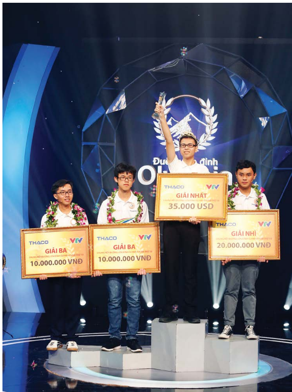
4 gương mặt trong cuộc thi chung kết Đường lên đỉnh Olympia năm thứ 19