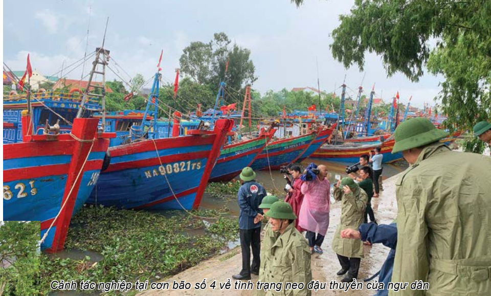
Cảnh tác nghiệp tại cơn bão số 4 về tình trạng neo đậu thuyền của ngư dân

fanpage chính thức của Thời sự). Dù quãng đường di chuyển gặp mưa gió rất lớn, nhưng khi đến các địa điểm tác nghiệp, mưa lại có phần giảm khiến cho việc ghi hình cũng không bị ảnh hưởng nhiều. Ví dụ khi ở Nghệ An, làm việc tại các khu neo đậu, tôi đã thông tin được tình hình neo đậu tàu thuyền của địa