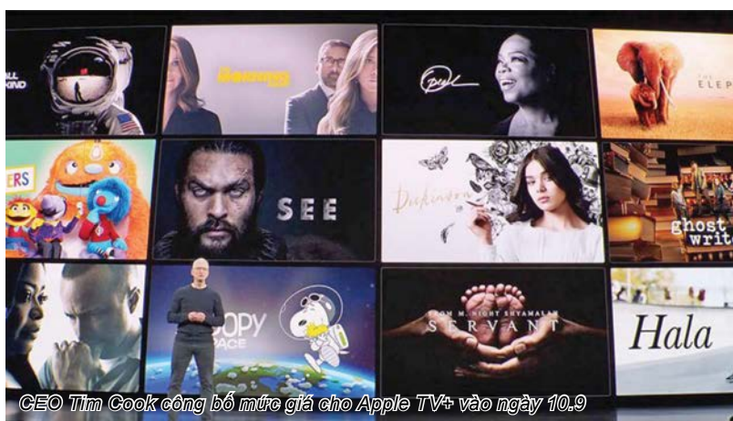
CEO Tim Cook công bố mức giá cho Apple TV+ vào ngày 10.9

TRONG BUỔI LỄ CÔNG BỐ PHÍ THUÊ BAO CHÍNH THỨC CỦA DỊCH VỤ TV+ MỚI ĐÂY, HÃNG APPLE KHẲNG ĐỊNH SẼ TRỞ THÀNH MỘT NHÀ CUNG CẤP NỘI DUNG ĐẶC SẮC VỚI NHỮNG SẢN PHẨM TRUYỀN HÌNH VÀ ĐIỆN ẢNH HÀNG ĐẦU HOLLYWOOD.