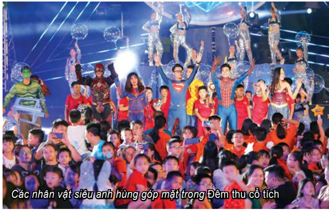
Các nhân vật siêu anh hùng góp mặt trong Đêm thu cổ tích