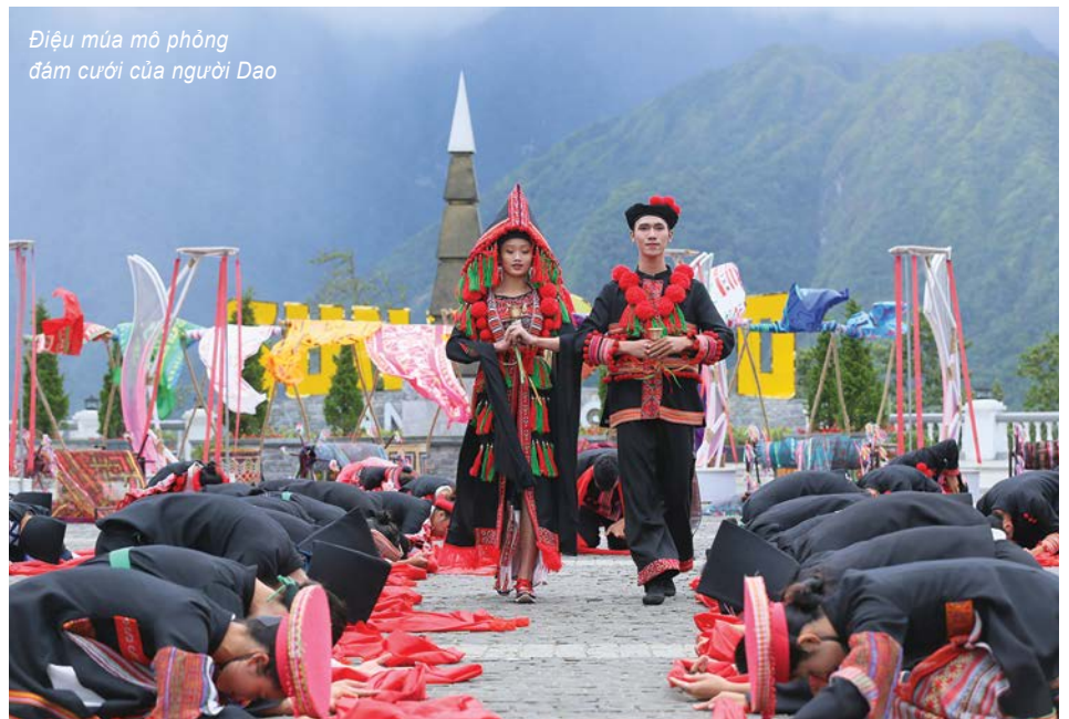
Điệu múa mô phỏng đám cưới của người Dao

Mở đầu Vũ điệu trên mây là không gian Tây Bắc được mở ra bằng thanh âm của gió và lá. Tiếng thoi đưa, nhịp khung cửi rộn ràng, trai làng gái bản vừa lao động, vừa nhảy múa. Truyền thuyết về loài hoa đỗ quyên vốn là biểu trưng nơi núi rừng Hoàng Liên được đặc tả bằng tiếng gọi kiếm tìm nhau tha thiết của tình yêu, bằng cuộc gặp gỡ trong phiên chợ tình của chàng Đỗ và