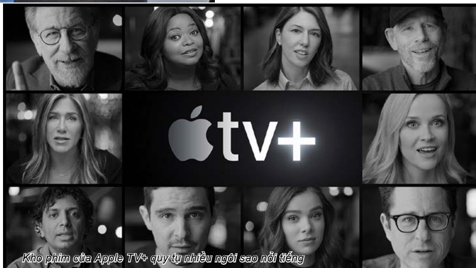
Kho phim của Apple TV+ quy tụ nhiều ngôi sao nổi tiếng

Chưa chính thức đi vào hoạt động song Apple TV+ hứa hẹn là đối thủ đáng gờm của các ông lớn trực tuyến hiện nay. Mức giá 4,99 đô la để có được dịch vụ phát trực tuyến Apple TV Plus được đánh giá là khá mềm so với