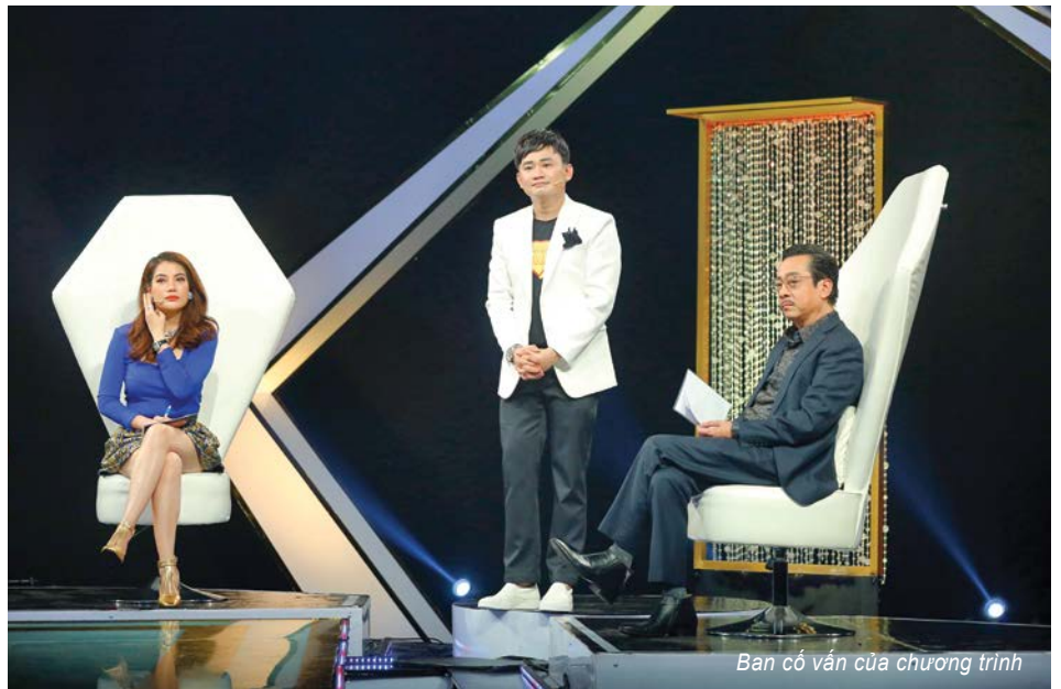
Ban cố vấn của chương trình