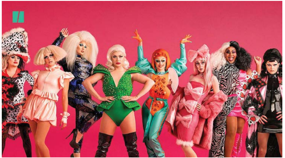
Các thí sinh của RuPaul's Drag Race

RuPaul muốn cổ vũ cho sự khác biệt, dị biệt để dù là ai cũng có thể tự tin thể hiện bản thân. Với sự xuất hiện và tài năng của những người như RuPaul, "drag queen" trở thành cộng đồng tràn đầy năng lượng, đam mê, sáng tạo với những con người vượt lên trên sự mặc định của số phận về giới tính để thỏa sức bay bổng, chinh phục những giới hạn.