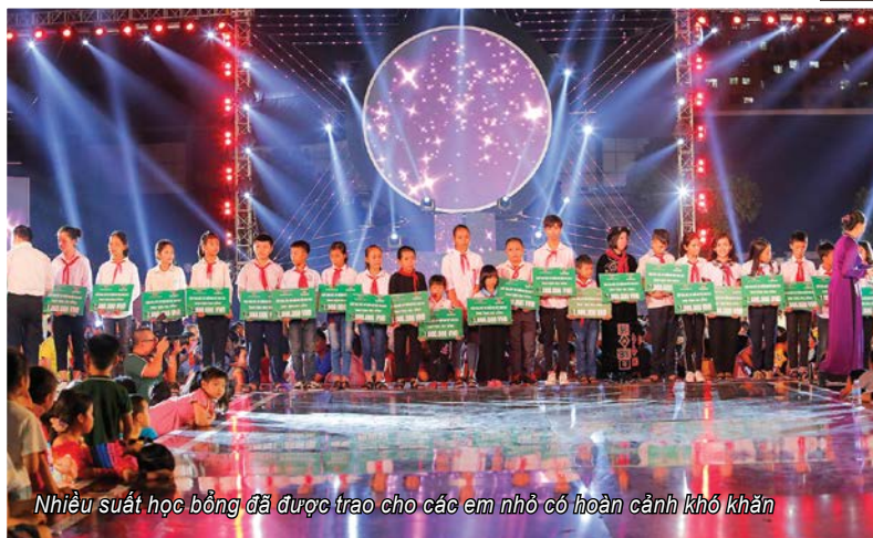
Nhiều suất học bổng đã được trao cho các em nhỏ có hoàn cảnh khó khăn

sắc màu niềm vui và sự bất ngờ. Diễn biến sân khấu và hoạt động giao lưu trình diễn liên tục có những điều ngạc nhiên dành cho các khán giả tại chỗ và khán giả xem qua truyền hình với những màn xuất hiện, trình diễn, hiệu ứng sân khấu ấn tượng. Ngay trong màn mở đầu, các em nhỏ đã trầm trồ thích thú với sự xuất hiện của Aladin