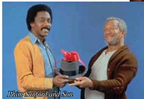
Phim Sanford and Son

Loretta Divine, một trong những ngôi sao của The Carmichael Show cho rằng, hiện nay rất nhiều chương trình đã tiên phong sử dụng “n-word” trước khi nó được pháp