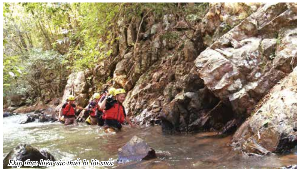
Ekip thực hiện và thiết bị lọi suối

không ngừng đổ xuống ào ào và tạt thẳng vào mặt hẳn là kỉ niệm khó quên với người chơi để chinh phục những giới hạn của bản thân. Nhưng thử thách khó nhất là leo thác máy giặt. Ở độ cao 11 - 14m, người chơi phải đu dây leo xuống giữa hai dòng nước trên thác đổ xuống ào ào. Nếu không cẩn thận sẽ bị dòng nước xoáy cuốn vào bên trong lòng hang rồi mới bị đẩy ra lại bên ngoài. Vì thế ai leo thác cũng đều phải uống no nước và để đuối sức. Mọi người cần phải có sự can đảm, nhanh nhẹn khi hoàn thành thử thách này.