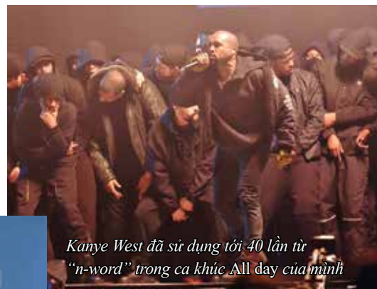
Kanye West đã sử dụng tới 40 lần từ “n-word” trong ca khúc All day của mình

Một cuộc thay đổi sâu sắc trong việc sử dụng tiếng lóng đang diễn ra trên truyền hình Mỹ. Năm 2013, một số nhà Đài đã đồng loạt yêu cầu Ủy ban Truyền thông Liên bang Mỹ FCC thông qua quy định chấp nhận công khai sử dụng “n-word” trong các chương trình truyền