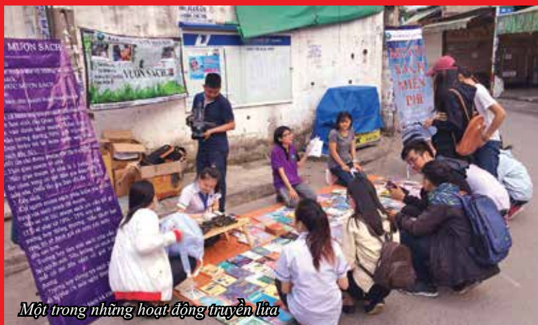
Một trong những hoạt động truyền lửa