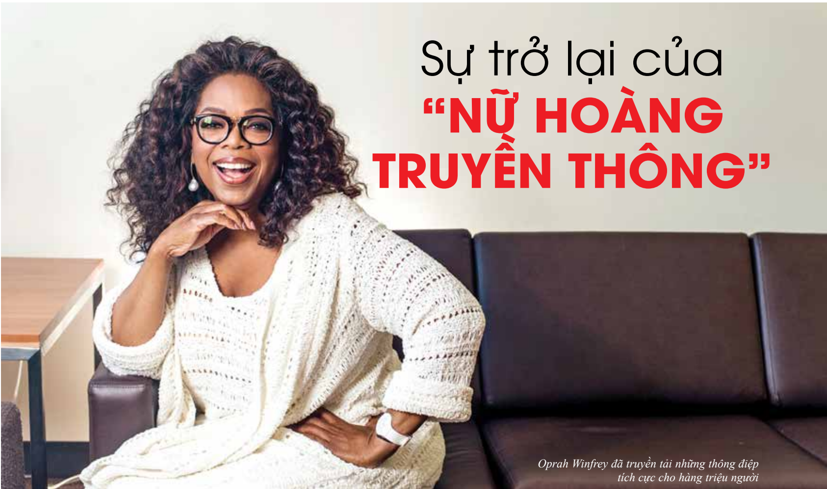
Oprah Winfrey đã truyền tải những thông điệp tích cực cho hàng triệu người

OPRAH WINFREY LÀ TÂM GƯƠNG SÁNG VỀ PHỤ NỮ GÓC PHI VƯƠN TỚI “GIÁC MƠ MỸ” NHỜ TÀI NĂNG VÀ SỰ CHĂM CHÍ. BÀ ĐƯỢC MỆNH DANH LÀ “TỈ PHÚ TINH THẦN” VÌ SUỐT NHIỀU NĂM NAY KHÔNG NGỪNG NGHĨ TRUYỀN TẢI NHỮNG THÔNG ĐIỆP TÍCH CỰC CHO HÀNG TRIỆU NGƯỜI TRÊN KHÁP THẾ GIỚI.