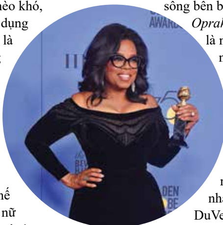
Oprah Winfrey tại lễ trao giải Quả cầu vàng

X uất thân nghèo khó, từng bị lạm dụng tình dục, lại là người da màu nhưng Oprah Winfrey đã dệt nên câu chuyện cuộc đời đẹp như huyền thoại. Nhiều năm liền, bà giữ vị trí Quán quân trong top 100 ngôi sao quyền lực nhất thế giới. Bà cũng là phụ nữ Mỹ gốc Phi đầu tiên có tên trong danh sách các tỉ phú thế giới. “Nữ hoàng truyền thông” Oprah Winfrey tâm niệm: “Cuộc sống hiện tại là kết quả của những gì mà bạn đã tin tưởng”. Không chỉ nổi tiếng với chương trình truyền hình có sức