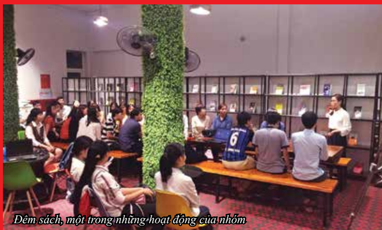
Đêm sách, một trong những hoạt động của nhóm