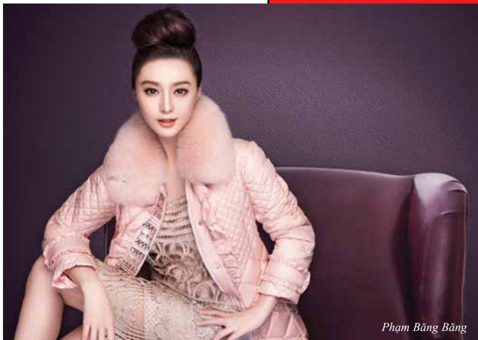
Phạm Băng Băng

viên Alex Parrish trong loạt phim truyền hình Quantico (Học viên điệp viên). Bộ phim được làm tới 4 phần giúp Priyanka giành được giải thưởng nữ diễn viên truyền hình được yêu thích nhất trong lễ trao giải People's Choice Awards . Bộ phim hài hành động Baywatch (Đội cứu hộ bờ biển), Priyanka đóng cặp với nam diễn viên Dwayne Johnson, cũng gây được tiếng vang lớn. Nữ diễn viên xinh đẹp cho biết, cô luôn muốn hoá thân vào những nhân vật có thể truyền cảm hứng cho tất cả phụ nữ trên thế giới. Bên cạnh diễn xuất, Priyanka còn hoạt động từ thiện năng nổ. Cô hiện là đại sứ thiện chí của Quỹ Nhi đồng thế giới UNICEF, đồng thời duy trì rất hiệu quả quỹ từ thiện mang tên mình The Priyanka Chopra Foundation for Health and Education , hỗ trợ y tế và giáo dục cho trẻ em bất hạnh toàn đất nước Ấn Độ. Người đẹp còn quyên góp 10 % thu