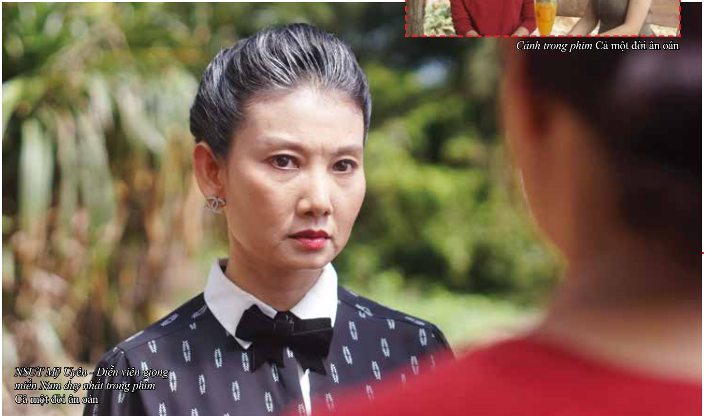
NSUT Mỹ Uyên - Diễn viên giọng miền Nam duy nhất trong phim Cả một đời ân oán