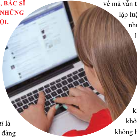
Cần trọng với các thông tin trên mạng xã hội

“bác sĩ” Google và Facebook. Điều kì lạ là, rất nhiều bà mẹ trong hội Betibuti là những người có học đàng hoàng, thậm chí có những người đi du học ở nước ngoài