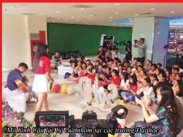
Mô hình Câu lạc bộ của nhóm tại các trường Đại học