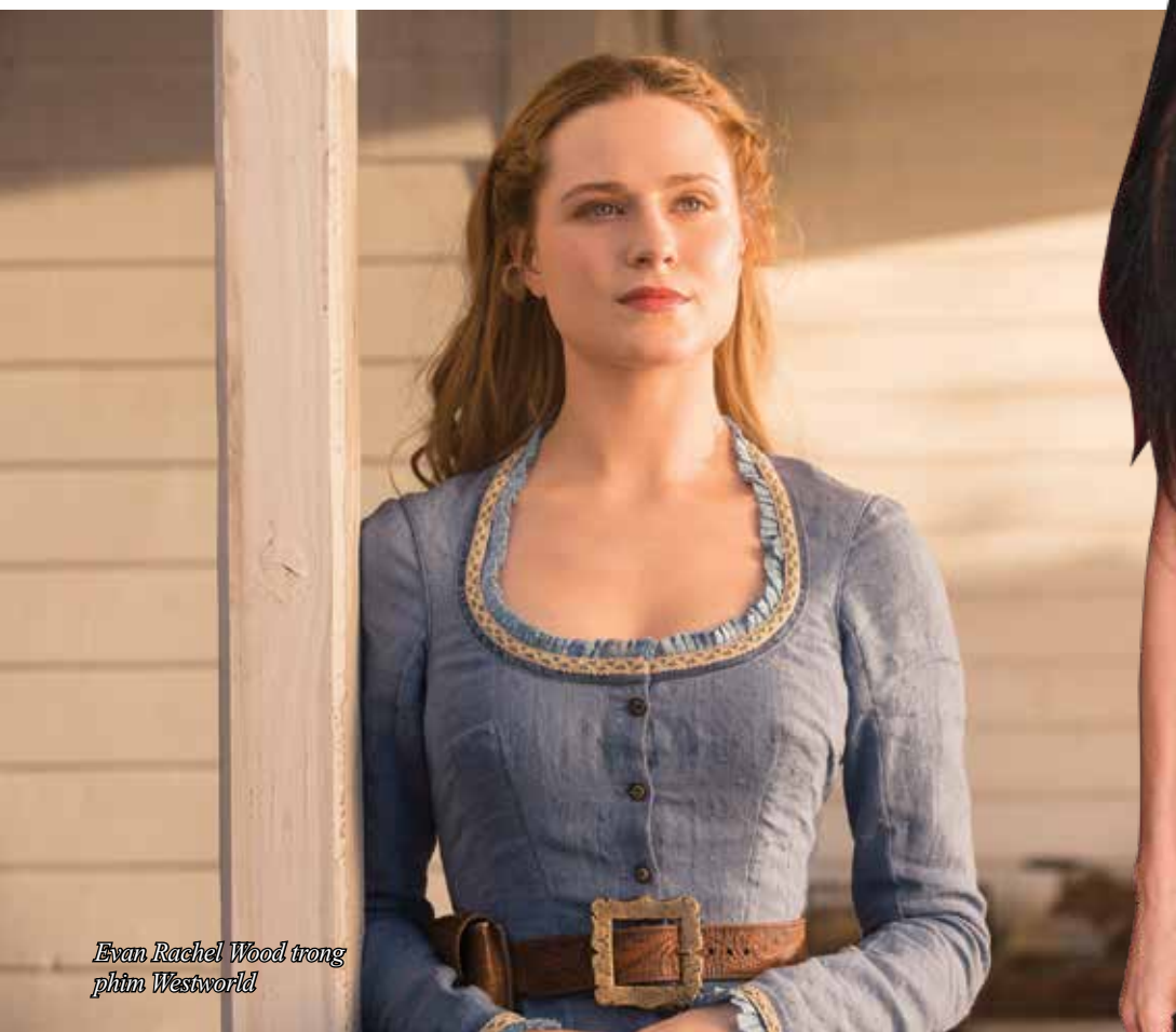
Evan Rachel Wood trong phim Westworld

nhân loại về giới trong phim lại bị kéo lùi về thời viễn Tây. Nhưng ý thức phản kháng đã nhen nhóm, âm ỉ suốt mùa phim thứ nhất và bùng lên thành cuộc nổi dậy, trong đó vai trò thủ lĩnh thuộc về hai nhân vật nữ Dolores (do Evan Rachel Wood đóng) và Maeve (Thandie Newton đóng). Một bên có diện mạo của cô gái nông thôn ngây thơ thuần khiết, một bên là bà chủ chứa lọc lõi sự đời. Chủ công viên cho họ những cuộc sống ngăn ngùi khác nhau, tùy