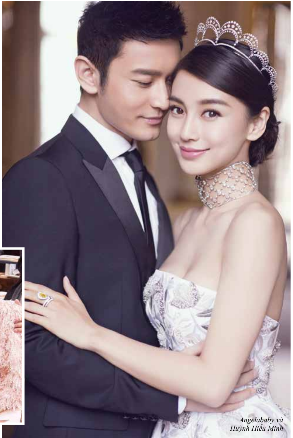
Angelababy và Huỳnh Hiểu Minh

Trong sáu năm hẹn hò bí mật cùng tài tử Huỳnh Hiểu Minh, Angelababy đã được bạn trai xây dựng cho một sự nghiệp khá vững chắc nhờ vào mối quan hệ lâu năm của anh trong nghề. Chương trình truyền hình thực tế Cùng tiến lên