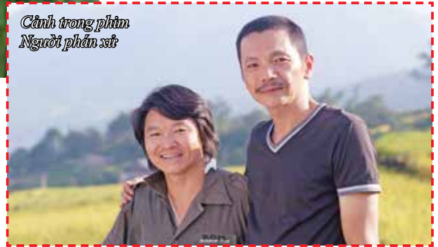
Cảnh trong phim Người phán xử

thanh là mong muốn của những người làm phim.