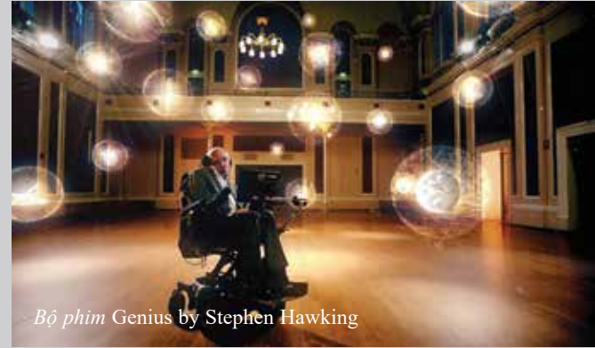
Bộ phim Genius by Stephen Hawking