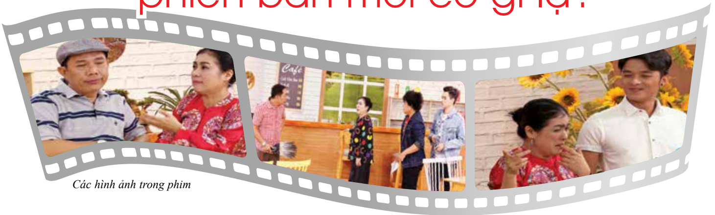
Các hình ảnh trong phim