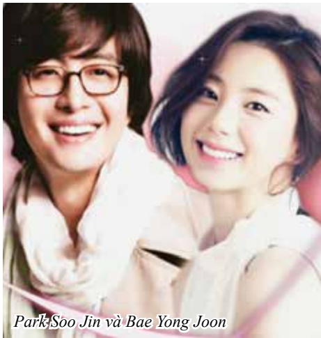
Park Soo Jin và Bae Yong Joon

nào anh em (Running Man phiên bản Trung Quốc) là nơi ghi dấu hình ảnh của cô trong lòng công chúng từ trước đến nay. Vai diễn này rất vừa vặn với cô nên trong thời gian Angelababy nghỉ sinh con, người thay thế cô là Dịch Lệ Nhiệt Ba bị phản đối kịch liệt. Do vậy, ngay sau thời kì ở cũ, Angelababy nhanh chóng trở lại với khán giả. Hiện nay, số tài sản của cô từ vai trò diễn viên, người đại diện thương hiệu, kinh doanh nhà hàng ở Hồng Kông... không hề kém cạnh người chồng nổi tiếng. Điều này giúp họ trở thành một trong những cặp đôi giàu có và quyền lực trong làng giải trí Hoa ngữ.