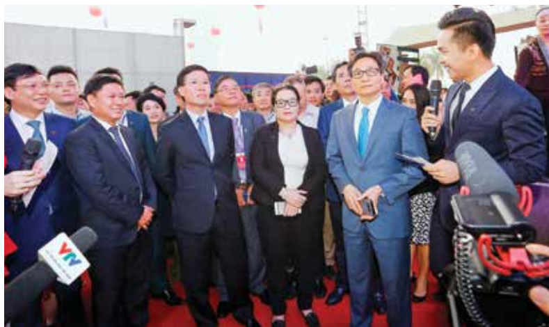
Đồng chí Võ Văn Thương - Ủy viên BCT, Trưởng Ban Tuyên giáo Trung ương và đồng chí Vũ Đức Đam - Phó Thủ tướng Chính phủ thăm gian triển lãm của VTV