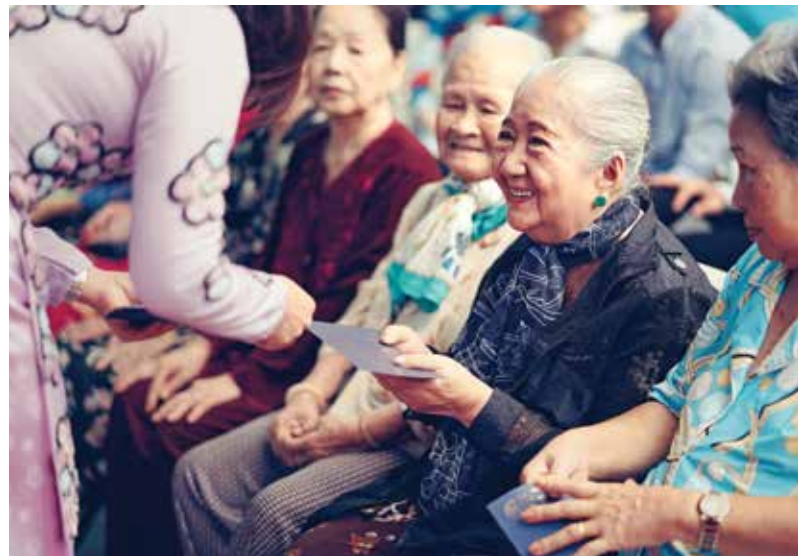
Gạo chợ nước sông được phóng tác từ truyện ngắn Cuối mùa nhan sắc về các nghệ sĩ già trong viện dưỡng lão

gánh hát. Được phóng tác từ truyện ngắn Cuối mùa nhan sắc của nhà văn Nguyễn Ngọc Tư, Gạo chợ nước sông còn là câu chuyện của những nghệ sĩ khi đã tàn phai thanh sắc. Họ chính là nhân chứng sống của thời điểm lệ nghề hát, của những mối tình ở lẫn ranh giữa đời thực và ảo mộng sân khấu. Hướng tiếp cận quá khứ này là tâm huyết đáng trân trọng của các nhà làm phim để tri ân thế hệ nghệ sĩ lão thành. Thế nhưng, từ sự chưa thành công về mặt doanh thu và hiệu ứng khán giả của Dạ cổ hoài lang hay Có căn nhà nằm nghe nắng mưa năm 2017, đòi hỏi Gạo chợ nước