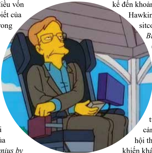
Phiên bản hoạt hình của Stephen Hawking trong phim The Simpson

Các tác phẩm tiểu sử về Stephen Hawking thường tập trung miêu tả trí tuệ, nghị lực phi thường vượt lên trên bệnh tật nhưng ở thiên tài này còn có sự hài hước, sôi nổi mà ông khá thoải mái thể hiện khi tham gia các bộ phim truyền hình với tư cách khách mời. Ấn tượng nhất phải