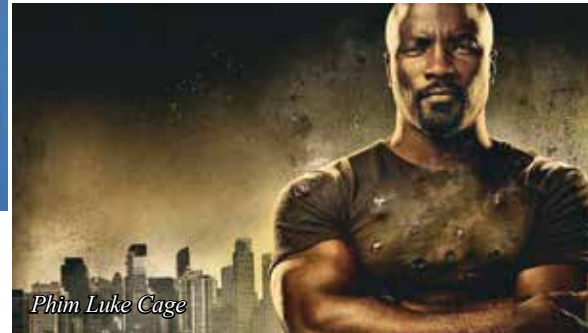
Phim Luke Cage

hình. Mặc dù chưa được chính thức thông qua, song dường như vấn đề này cũng bớt gây căng thẳng hơn giai đoạn trước kia, nhất là trong thời buổi các hãng dịch vụ trực tuyến đang nở rộ, việc sử dụng ngôn ngữ lóng đang dần trở nên cởi mở hơn. Tuy vậy, vấn đề này vẫn luôn được đặt trong giới hạn kiểm soát. Jerrod Carmichael lấy một ví dụ về trường hợp của Đài NBC, dù đã mở rộng biên giới sử dụng tiếng lóng, song theo yêu cầu của các nhà quảng cáo, nhà Đài vẫn cần phải tôn trọng khán giả. Đơn cử, trong một kịch bản, NBC đã từng được yêu cầu phải thay đổi từ “hiếp dâm” thành “tấn công tình dục”.