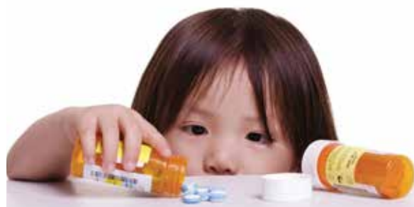
Trẻ em đối mặt với tình trạng kháng kháng sinh vì bố mẹ tin theo bác sĩ Google

bà mẹ không nên cho con tiêm vaccine và uống sữa công thức: “Với trẻ, sự phát triển tự nhiên, bình thường là quý nhất. Trẻ mới sinh ra đời thì chỉ nên bú mẹ. Da kẻ da. Quy tắc này được thiên nhiên tạo lập cho muôn loài qua triệu năm tiến hoá. Sữa công thức và vaccine thực chất chỉ là chất độc, gây hờ ruột và phá hủy cơ thể của trẻ mà thôi”. Tin theo những lập luận vô căn cứ này, rất nhiều bà mẹ đã không cho con đi tiêm phòng. Hậu quả là hơn 100 đứa trẻ vô tội tử vong khi dịch sởi bùng phát trở lại.