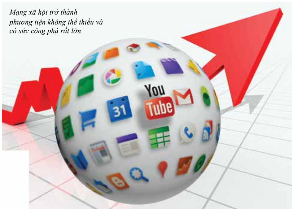
Mạng xã hội trở thành phương tiện không thể thiếu và có sức công phá rất lớn

Không chỉ có Betibuti , trên mạng xã hội hiện nay có rất nhiều hội, nhóm được lập ra, chia sẻ đủ các vấn đề, điển hình như: nuôi con, làm đẹp, hướng dẫn các cách chữa bệnh, detox, giảm cân... thu hút rất đông thành viên và hậu quả của nó cũng muôn hình vạn trạng. Minh chứng rõ nhất cho tác hại của việc mù quáng tin theo mạng xã hội là trào lưu nói không với việc tiêm vaccine. Cũng bắt nguồn từ một tài khoản tự xưng là chuyên gia trên Facebook, khuyên các