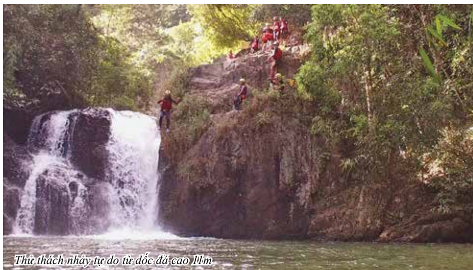
Thử thách nhảy tự do từ dốc đá cao 11m

BTV Thu Ba cho biết, trong số các thử thách của chương trình, có lẽ thú vị nhất là hành trình vượt thác 25m. Người chơi từ từ thả dây dọc theo ngọn thác xuống dòng suối bên dưới. Việc giữ thăng bằng khi chạm chân vào vách đá trơn trượt giữa lúc dòng nước mạnh