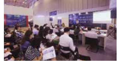
Hội thảo về vấn đề bản quyền trong Telefilm 2017

Triển lãm Quốc tế phim và công nghệ truyền hình Việt Nam - Telefilm là triển lãm thường niên được tổ chức vào tháng 6 hàng năm với định hướng Hội nhập, cùng phát triển cho các tổ chức, công ty hoạt động trong lĩnh vực phim và công nghệ truyền hình. Telefilm 2018 sẽ diễn ra tại Trung tâm Triển lãm Quốc tế - SECC, 799 Nguyễn Văn Linh, quận 7, thành phố Hồ Chí Minh từ ngày 07 đến 09/6/2018. Telefilm 2018 cũng sẽ tổ chức các hội thảo chuyên môn, cập nhật những xu thế truyền hình hiện tại cũng như tốc độ số hoá chóng mặt của truyền hình Việt Nam và quốc tế.