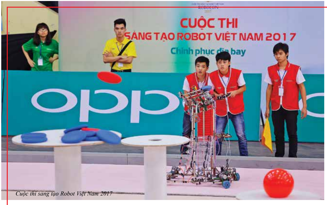
Cuộc thi sáng tạo Robot Việt Nam 2017

CUỘC THI SÁNG TẠO ROBOT CHÂU Á - THÁI BÌNH DƯƠNG (ABU ROBOCON) ĐÃ BƯỚC SANG NĂM THỨ 17 VÀ NĂM NAY LÀ NĂM THỨ 3 VIỆT NAM ĐĂNG CAI TỔ CHỨC. TINH THẦN ROBOCON ĐANG RẤT “NÓNG” ĐỐI VỚI SINH VIÊN NGÀNH KỸ THUẬT TRONG CẢ NƯỚC. CÙNG TRÒ CHUYỆN VỚI NHÀ BÁO HÀ TRANG - TRƯỞNG PHÒNG KHOA HỌC - CÔNG NGHỆ - BAN KHOA GIÁO ĐỀ CỎ NHỮNG THÔNG TIN CẬP NHẬT NHẤT VỀ TIẾN ĐỘ CHUẨN BỊ CHO SỰ KIỆN MANG TẦM QUỐC TẾ NÀY.