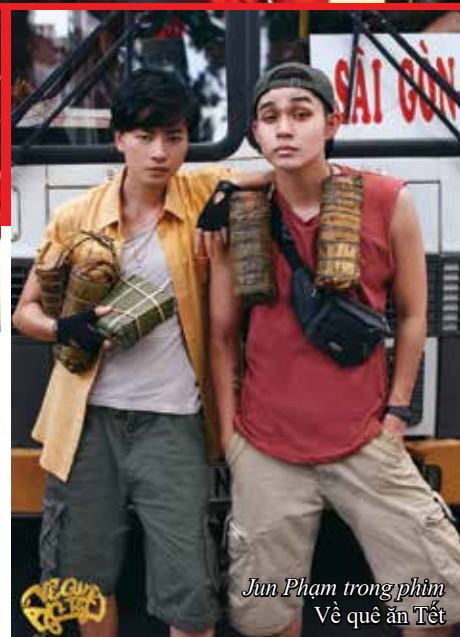
Jun Phạm trong phim Về quê ăn Tết

* Anh nghĩ sao nếu có ý kiến cho rằng, Jun Phạm quá chín chu và hơi