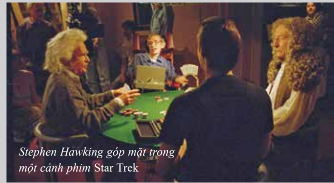
Stephen Hawking góp mặt trong một cảnh phim Star Trek

THE THEORY OF EVERYTHING (THUYẾT VẠN VẬT) - BỘ PHIM GÂY TIẾNG VANG LỚN NĂM 2014 - TRỞ THÀNH TỪ KHÓA TÌM KIẾM CỦA RẤT NHIỀU NGƯỜI TRÊN TOÀN THẾ GIỚI SAU KHI NHÀ VẬT LÝ LÍ THUYẾT VÀ VŨ TRỤ HỌC LỪNG DANH STEPHEN HAWKING QUA ĐỜI. HÀNG LOẠT TÁC PHẨM TRUYỀN HÌNH MÀ ÔNG LÀ NHÂN VẬT HOẶC TRỰC TIẾP HỢP TÁC THAM GIA BIÊN KỊCH, XÂY DỰNG SẼ GIÚP KHÁN GIẢ CÓ CÁI NHÌN RÕ RÀNG HƠN VỀ “NGƯỜI KHÔNG LÒ” ĐÃ DÀNH CẢ CUỘC ĐỜI ĐỀ HƯƠNG VỀ NHỮNG VÌ SAO NHẦM THÁU HIỂU VŨ TRỤ THAY VÌ NGHỊCH CẢNH SỐ PHẬN GẮN LIỀN VỚI CHIẾC XE LĂN.