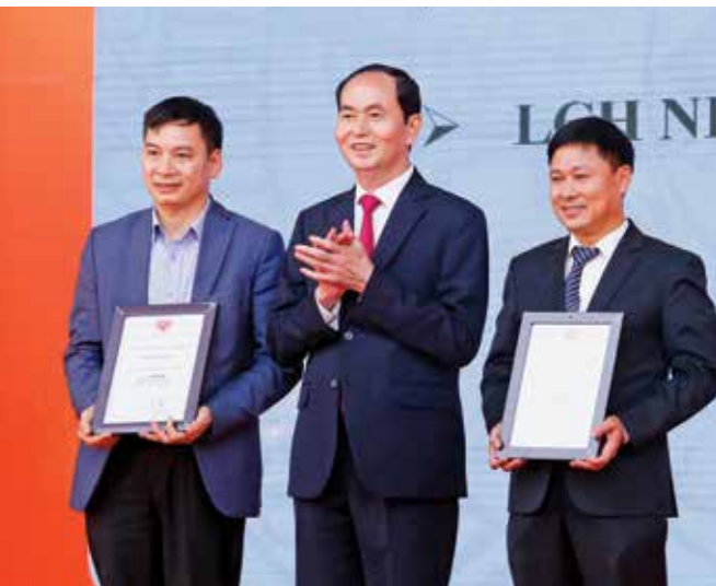
Chủ tịch nước Trần Đại Quang trao Giải Đặc biệt Gian trưng bày ấn tượng, đặc sắc cho đại diện Đài THVN và Đài TNVN