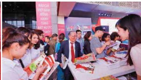
Giao lưu các nữ Tổng biên tập và tặng quà các gia đình nữ nhà báo liệt sĩ tại Hội báo toàn quốc 2018