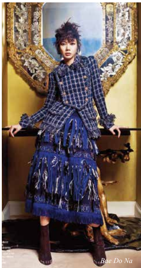
Bae Do Na

Năm 2017, Bae Do Na trở lại màn ảnh nhỏ Hàn Quốc và có màn kết hợp rất ấn tượng với nam diễn viên Jo Seung Woo trong bộ phim Stranger (Người lạ). Đây là bộ phim truyền hình duy nhất của Hàn Quốc lọt vào top 10 bộ phim hay nhất thế giới do New York Time bình chọn. Bae Do Na gây ấn tượng mạnh mẽ khi vào vai nữ cảnh sát hài hước, vui vẻ nhưng rất thông minh và chuyên nghiệp. Hầu hết các vai diễn của cô đều thể hiện sức mạnh của người phụ nữ. Không việc gì đàn ông làm được mà phụ nữ không làm được cả, thêm vào đó họ còn có sự nhạy cảm, mềm dẻo và sức chịu đựng bền bỉ. Với hình ảnh đầy cá tính, không ngại thử thách, vươn lên để bứt phá, Bae Do Na đã trở thành người Hàn Quốc đầu tiên được Louis Vuitton lựa chọn làm gương mặt đại diện cho chiến dịch quảng cáo toàn cầu.