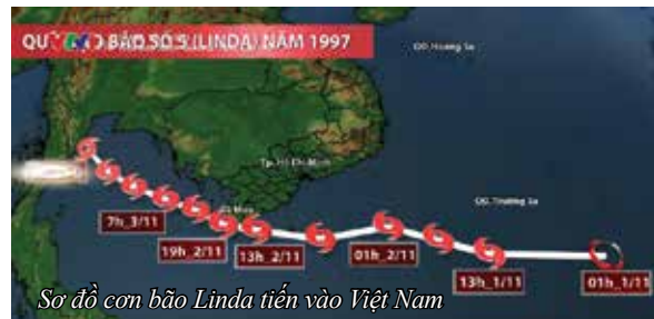
Sơ đồ cơn bão Linda tiến vào Việt Nam

đi... Có lẽ bởi vậy, khi xem xong Nỗi ám ảnh mang tên Linda , hầu hết mọi người đều nhận ra, bộ phim này được dựng hoàn toàn dựa trên mạch cảm xúc tự nhiên của nhân vật. Mỗi người tự kể lại câu chuyện của mình, những câu chuyện khiến người nghe không khỏi day dứt. Một cơn bão khủng khiếp khiến hơn 3.000 người thiệt mạng và mất tích, hàng trăm nghìn ngôi nhà bị tốc mái và sập đổ... Câu chuyện bi thương ấy không bị lãng quên, những bài học cần rút ra sau cơn bão Linda đến lúc này vẫn còn nguyên giá trị. Đó là bài học về nhận thức và ý thức của người dân trước thiên tai, bài học không nên chủ quan trước bất cứ mối hiểm nguy nào, bài học về cách phòng tránh và cách vượt qua những nỗi đau không thể nào bù đắp được.