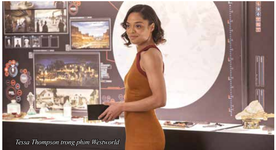
Tessa Thompson trong phim Westworld

Cán cân yêu thích từ phía khán giả không hoàn toàn nghiêng về phía các robot bởi ở “phe” con người vẫn có một vai nữ đầy tiềm năng. Trong vai một lãnh đạo cấp cao, tham vọng chiếm lĩnh quyền kiểm soát công viên, ngôi sao da màu đang lên Tessa Thompson - người vừa tỏa sáng cùng nhân vật nữ siêu anh hùng mới trong phim Thor: Ragnarok - cho thấy, cô có đủ sức mạnh trí tuệ để