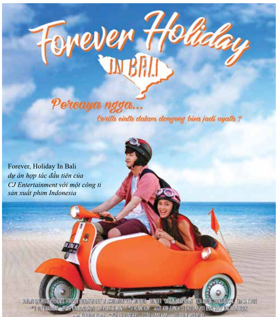
Forever, Holiday In Bali dự án hợp tác đầu tiên của CJ Entertainment với một công ti sản xuất phim Indonesia

triển các cụm rạp. Chỉ trong một thời gian ngắn, CJ CGV đã thuê tóm chuỗi rạp Bitz Megaplex của Indonesia và đổi tên thành CGV Bitz. Năm 2017, Lottle Cinema tuyên bố sẽ tấn công vào thị trường Indonesia. “Chúng tôi dự định sẽ mở thêm 15 rạp nữa ở Đông Nam Á, mà trọng tâm là Indonesia”, đại diện truyền thông của Lottle cho biết. Showbox cũng đánh dấu sự có mặt của mình tại thị trường này