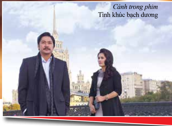
Cảnh trong phim Tình khúc bạch dương