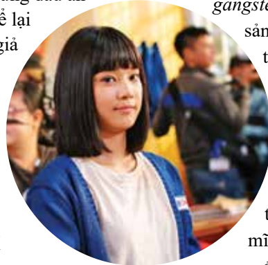
Hoàng Yến Chibi trong phim Những tháng năm rực rỡ

gangster do diễn viên, nhà sản xuất Trần Bảo Sơn thực hiện cùng ekip đến từ Hồng Kông. Đây là dự án điện ảnh được trông đợi nhất trong năm 2018 khi quy tụ được hàng loạt mỹ nhân đình đám của điện ảnh Hồng Kông như: Trương Quân Ninh, Trần Ý Hàm,