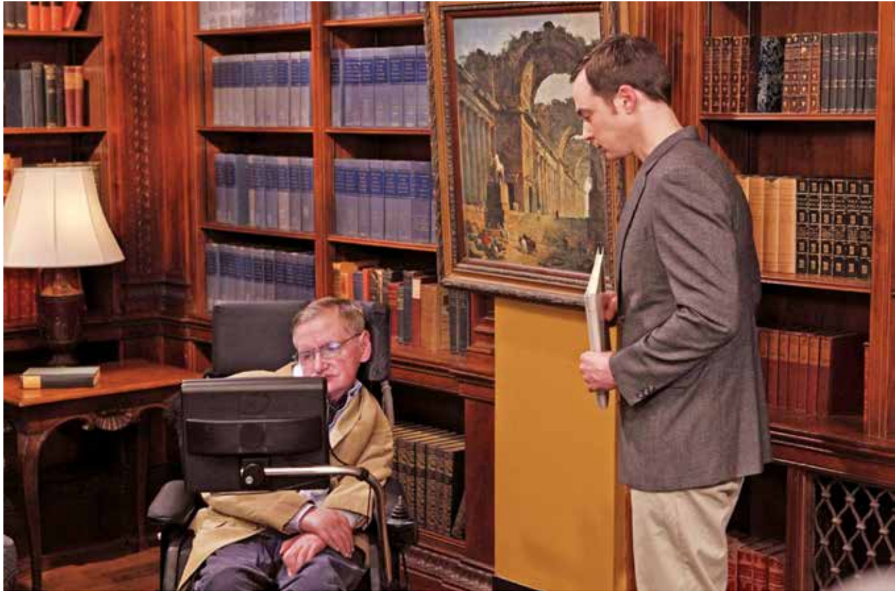
Stephen Hawking và nam diễn viên chính phim The Big Bang Theory

phá, trả lời những điều vốn thuộc về tầm hiểu biết của các thiên tài. Một trong những chủ đề yêu thích của Stephen Hawking là du hành thời gian. Và đó cũng là tập mở đầu cho loạt chương trình độc đáo này. Nếu không vì điều kiện sức khỏe và sự ra đi bất ngờ ở tuổi 76 của ông, có lẽ series Genius by Stephen Hawking sẽ có cơ hội kéo dài thêm những mùa khác nữa.